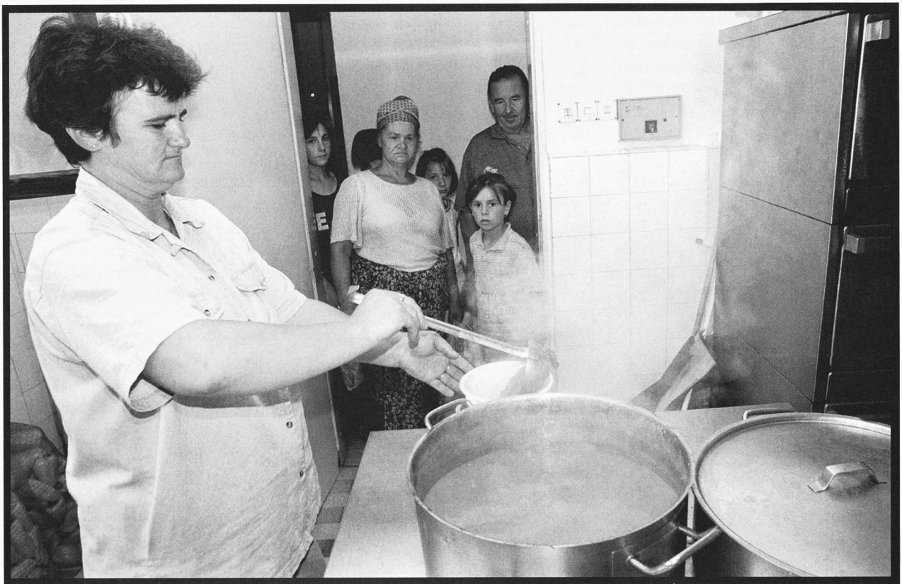
Centre pour personnes déplacées, Kladanj, août 1998