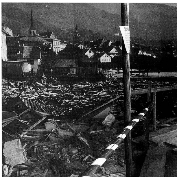
Abb. 22 Ausstellung «1887 Vorstadt-Katastrophe 1987».