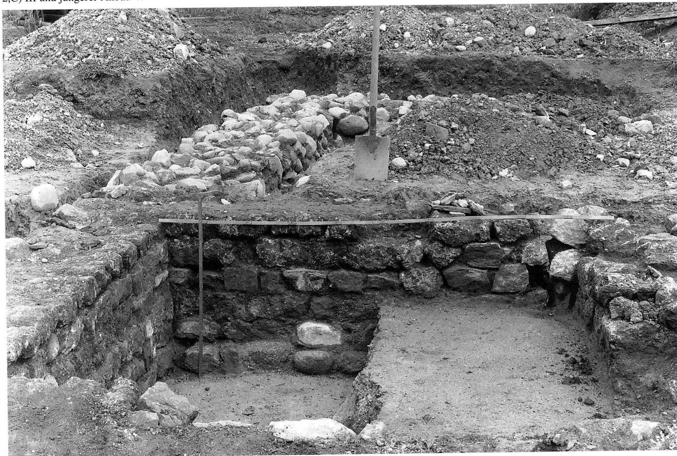
Abb. 3 Cham, Lindencham-Heiligkreuz, Römischer Gutshof. Grabung Frühjahr 1934. Blick nach Nordwesten in die mutmassliche Wasserkammer (Abb. 2,C) III und jüngerer Anbau V.