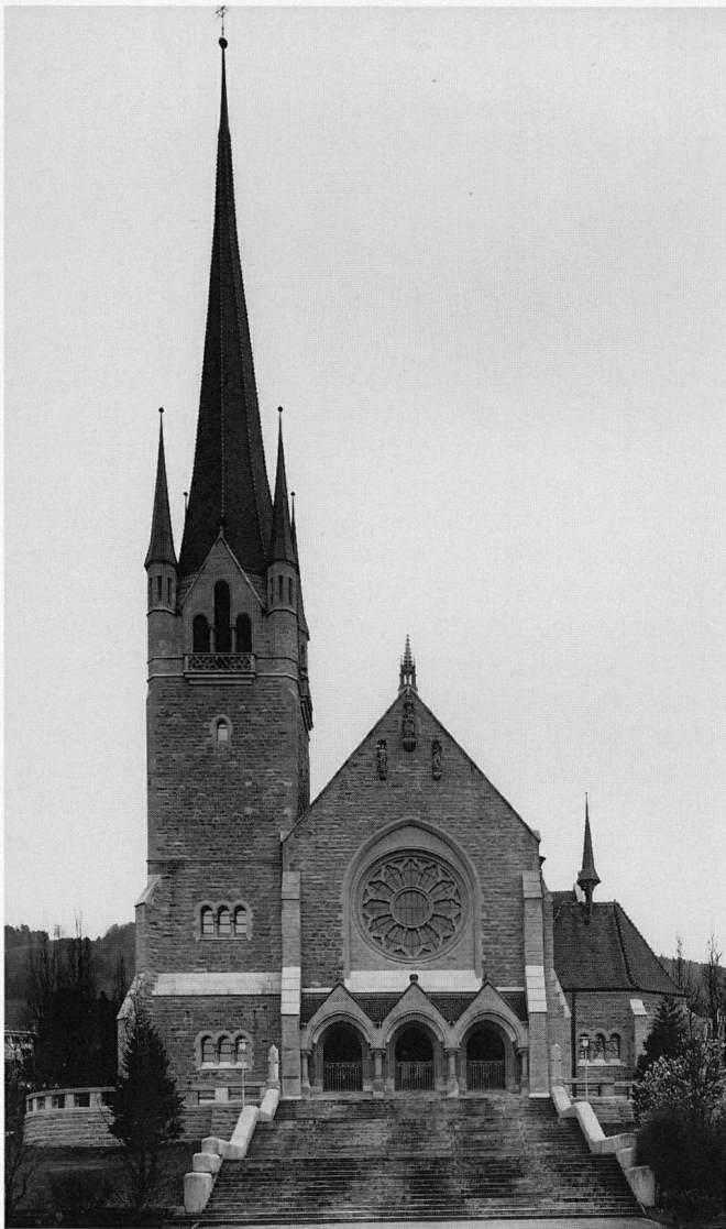
Abb. 2 Zug, Pfarrkirche St. Michael. Die Westfassade nach der Restaurierung, März 1994.

kantonale Denkmalpflege und des Architekturbüros Paul Weber, Zug, eine umfassende Aussenrestaurierung statt, die im Herbst 1993 abgeschlossen werden konnte.