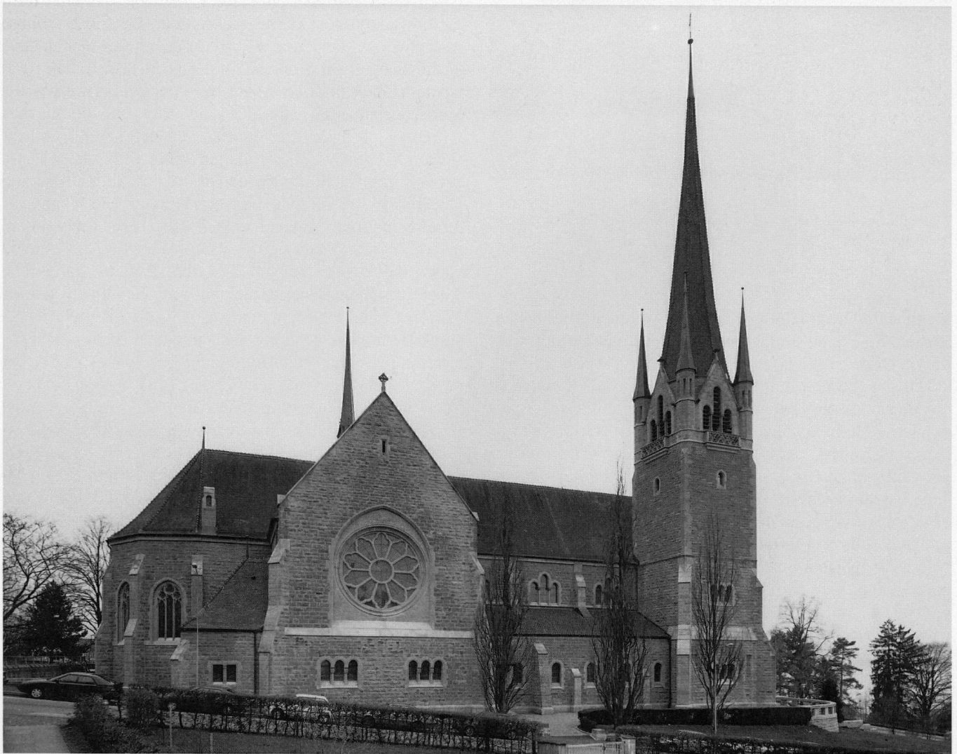
Abb. 1 Zug, Pfarrkirche St. Michael. Die Südfassade nach der Restaurierung, März 1994.