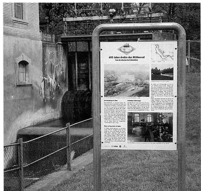
Abb. 3 Baar. Die Informationstafel vor dem Wehr der Untermühle in Cham.

an Arbeitersiedlungen vorbei, durch grossflächige Überbauungen der 1960er bis 1980er Jahre, die ältere Gewerbeanlagen vollständig ersetzt haben, entlang der Autobahn, am Ufer des Zugersees, durch Dörfer und Wälder. Immer wieder gibt es Neues zu sehen – das in diesem Band dargestellte Gärtnerhaus in Cham ist Teil des Industriepfades –,