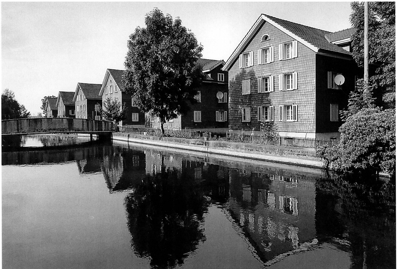
Abb. 2 Cham. Die 1866 erbaute Arbeitersiedlung in der Lorzenweid.

sönlichkeiten aus Kultur, Wirtschaft und Politik angehören, unterstützt die Bemühungen der neuen Vereinigung. Zur wichtigsten Aufgabe des Vereins zählte vorerst einmal die Beschaffung von finanziellen Mitteln für die Realisierung des Pfades, war doch die technische Produktion sämtlicher Schautafeln und Wegweiser mit beträchtlichen Kosten verbunden. Nach einer ansehnlichen Startinvestition durch den Kanton Zug und die Gemeinden gelang es dem Verein, zwei Weltfirmen als Hauptsponsoren für den Industriepfad zu gewinnen: Die Nestlé und die LEGO. Mit ihrem Sponsoring knüpft Nestlé an die eigene Firmengeschichte an: Die 1905 erfolgte Fusion zwischen der «Anglo Swiss Condensed Milk Company» in Cham und der Firma Henri Nestlé in Vevey legte den Grundstock zum heutigen Weltkonzern. Die LEGO, deren Schweizer Hauptsitz sich in Baar befindet, unterstützt das Projekt vor allem seines familienfreundlichen Charakters wegen.