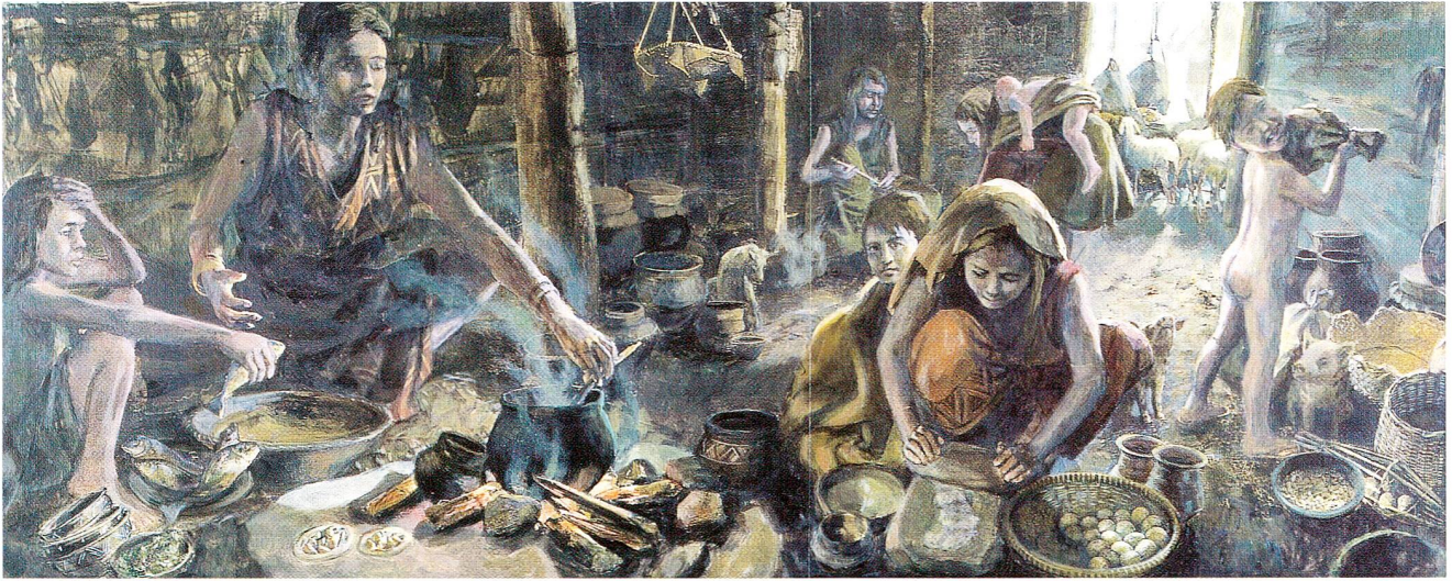
Abb. 3 Kochbuch «Kulinarische Reise in die Vergangenheit». Illustration zur Bronzezeit von Anita Dettwiler.