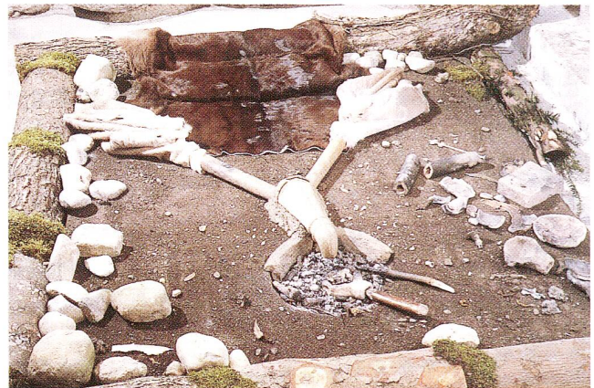
Abb. 1 Sonderausstellung 1995. Der nachgestellte Giesserplatz.

Auf Jahresende schliesslich erschien in der Schriftenreihe des Museums ein urgeschichtliches Kochbuch. Es trägt den Titel «Kulinarische Reise in die Vergangenheit. Ein Kochbuch mit Rezepten von der Steinzeit bis ins Mittelalter». Anhand von mehr als fünfzig von den Autorinnen nachgekochten Rezepten ist es möglich, einen direkten Einblick in die Küche unserer Vorfahren zu erhalten (Abb. 3), und in kurzen Einleitungen zu den verschiedenen urgeschichtlichen Epochen wird auf die jeweilige Vegetation und das Nahrungsangebot hingewiesen. Wie schon das Bronzezeit-Quartett des Vorjahres entwickelte sich auch das Kochbuch zu einem eigentlichen Verkaufsschlager. Es wird nicht nur in Zug, sondern auch in verschiedenen urgeschichtlichen Museen des In- und Auslandes zum Verkauf angeboten. In einer von rund sechzig Personen und der Presse besuchten Vernissage konnten einige der Rezepte gleich vorgestellt werden.