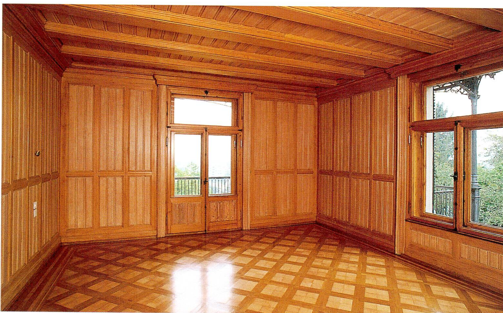
Abb. 5 Villa Burgweid. Das Westzimmer im ersten Obergeschoss.