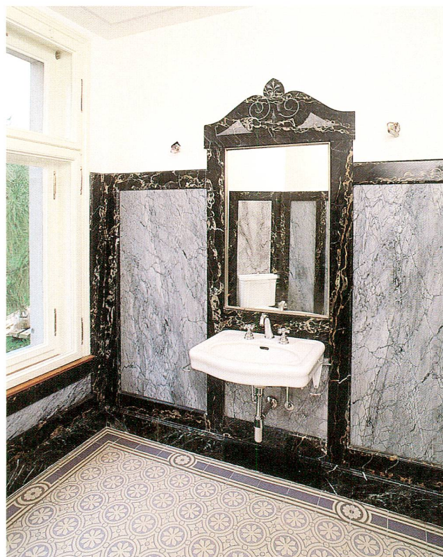
Abb. 6 Villa Burgweid. Die Toilette im ersten Obergeschoss.

Das Nordzimmer zeigte mehrere Fassungen. Die Gipsdecke mit Stuckrahmen und reicher, elegant zierlicher Stuckrosette war in erster Schicht blau gefasst und mit Bronzierungen akzentuiert. Die Stukkaturen und die Far-