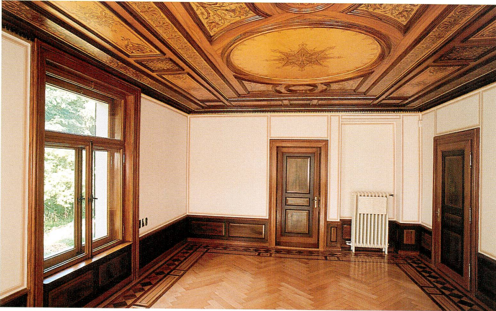
Abb. 3 Villa Burgweid. Das Westzimmer im Erdgeschoss.