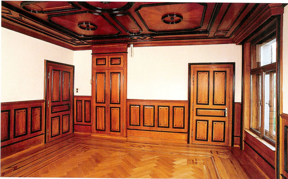
Abb. 4 Villa Burgweid. Das Stützzimmer («holländisches Zimmer») im Erdgeschoss.