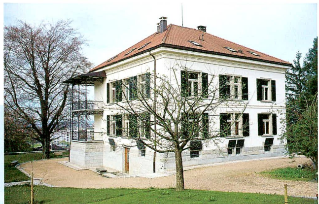
Abb. 1 Villa Burgweid. Ansicht von Westen (links) und Osten (oben).