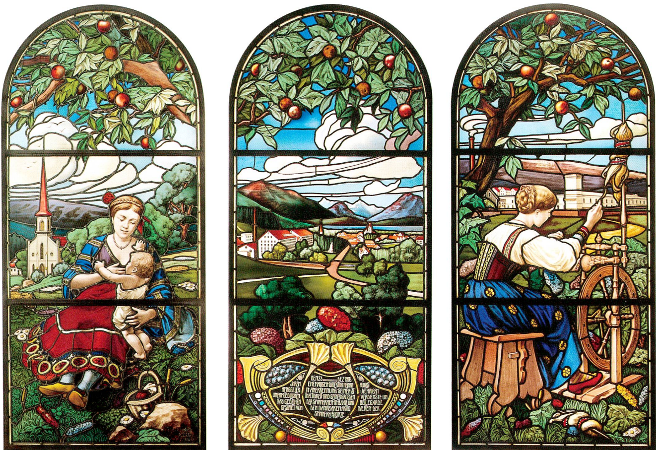
Abb. 7 Villa Burgweid. Dreiteiliges Glasgemälde im Treppenhaus, 1906/07 datiert.

um das Gedeihen der Spinnereien in Baar und Bellegarde gestiftet von den dankbaren Aktionären der Spinnerei a/d Lorze». Das Triptychon besteht aus drei hochrechteckigen, je 82 cm breiten und 180 cm hohen, im Rundbogen schliessenden Bildern, die auch vertikal dreigeteilt sind. Die Rundbogenfelder sind mit Apfelzweigen geschmückt. Auf dem linken Bild erscheint im Hintergrund die reformierte Kirche Baar und vorne eine rot gekleidete, ihr Kind stillende Frau. Auf der Mitteltafel ist unten die genannte Dedikationsinschrift sichtbar, darüber eine Ansicht der Spinnerei an der Lorze in Baar mit der Parkanlage, der noch heute bestehenden Arbeitersiedlung an der Langgasse, dem Turm der protestantischen Kirche, dem Dorf Baar mit der St.-Martins-Kirche, See und Bergen. Auf der rechten Tafel sitzt eine Frau am Spinnrad, vor der Filialfabrik («Filature») Bellegarde in Frankreich. Die Glasmalerei ist in verschiedenen Techniken geschaffen worden und zeigt auch stilistische Einflüsse der Belle Epoque und des Tiffany. August Henggeler-Frei (1848–1929) war 1870–1906 kaufmännischer und technischer Direktor, 1907–15 Vizepräsident und 1915–28 Präsident des Verwaltungsrates. Das Geschenk wurde offensichtlich anlässlich seines Rücktritts als Fabrikdirektor in Auftrag gegeben und 1907 gefertigt. Für welchen originalen Standort das Glasgemälde geschaffen worden ist, konnte nicht eruiert werden.