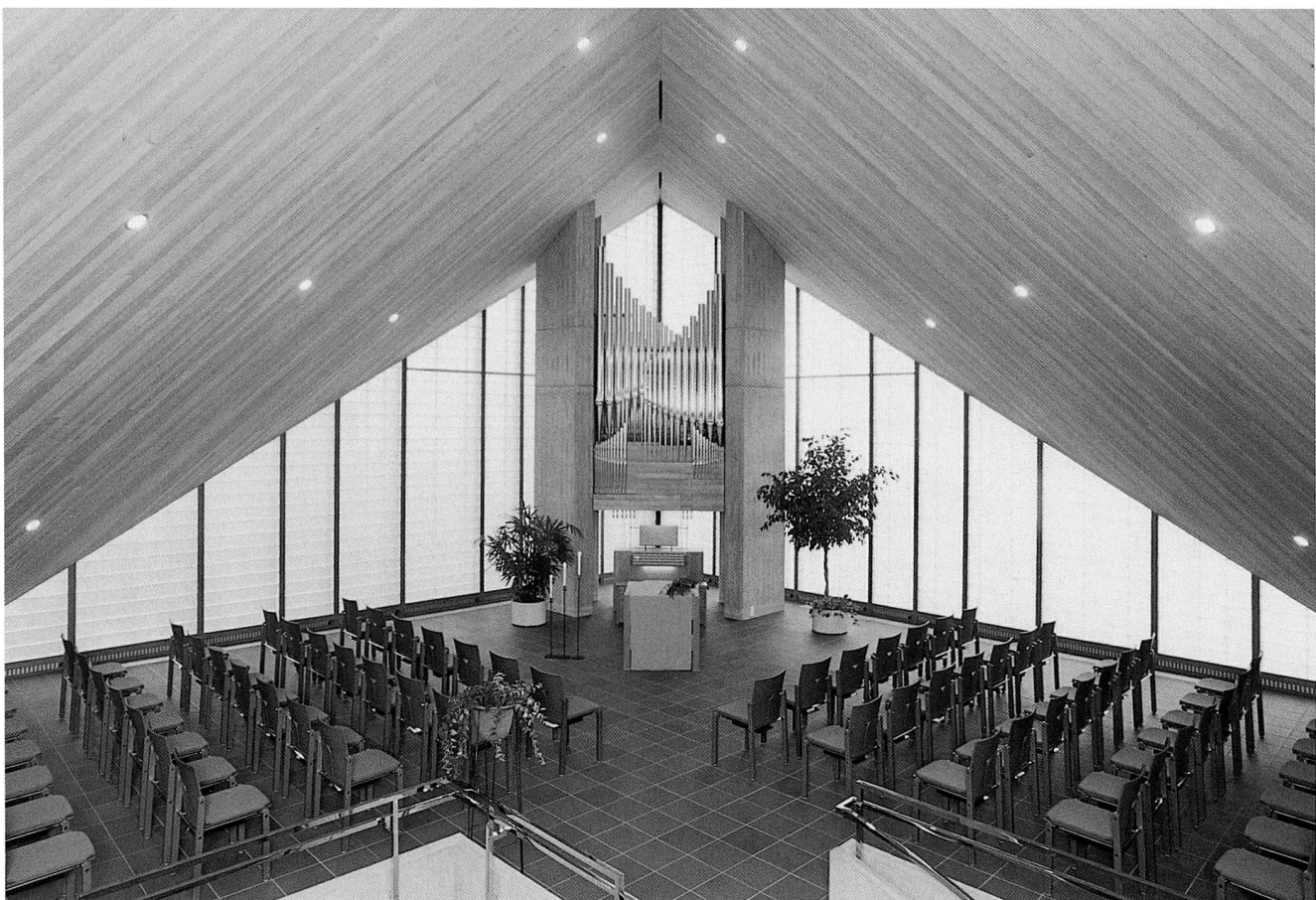
Abb. 3 Der Kirchenraum nach der Restaurierung. Blick Richtung Westen.

Am 20. Oktober 1998 stellte der Regierungsrat des Kantons Zug die Kirche unter Denkmalschutz, dann begann die eigentliche Restaurierungsphase, und am 9. April 2000