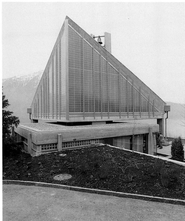
Abb. 1 Die reformierte Kirche Walchwil nach der Restaurierung von 1998–2000.

Am 22. September 1962 fand der Spatenstich statt, am 14. März 1964 trafen die drei Glocken in Walchwil ein, und am 23. August 1964 weihte man die Kirche ein. 6 Die Berichterstatter schrieben, das Gebäude finde allgemein Zustimmung. Es sei ein «kühnes, eigenwilliges, ja für manchen vielleicht noch befremdendes Werk, ... in der Architektur wie im Material kompromisslos dem Modernen zugewandt, bestechend in seiner Schlichtheit, das sicher zu einem markanten, bald vertrauten Punkt in unserem Dorfbild werden wird». 7