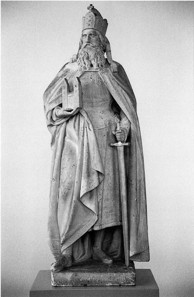
Abb. 1 Statue Karls des Grossen von Ludwig Keiser. Modell für Brunnenfigur. Museum in der Burg Zug.