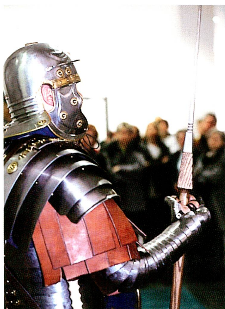
Abb. 1 Eröffnung der Ausstellung «Vom Geschirr zum Genuss». Legionär der Legio XI.