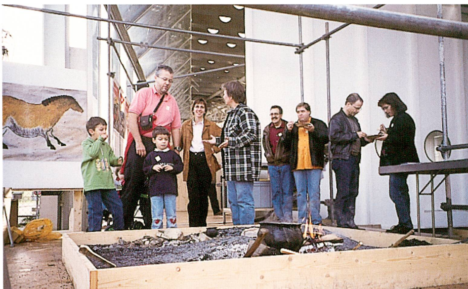
Abb. 5 Das Museum für Urgeschichte als Gast im Verkehrshaus Luzern. Bronzezeitlicher Eintopf, serviert mit interessanten Hintergrundinformationen.