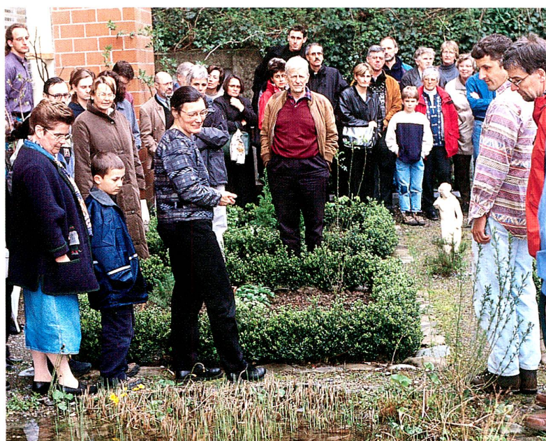
Abb. 2 Eröffnung der Ausstellung «Vom Geschirr zum Genuss». Grossen Anklang fand wie immer der Museumsgarten.