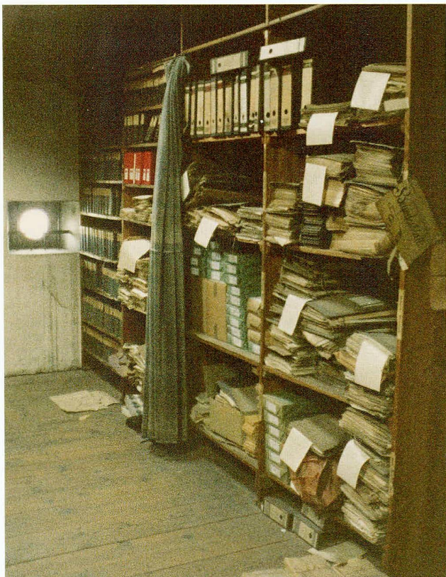
Abb. 1 1983 erhielt das Staatsarchiv im um- und ausgebauten Estrich des Regierungsgebäudes zwei Magazinräume mit einer Lagerkapazität von maximal 500 Laufmetern. Für die heikle Entrümpelung dieses Estrichs, der seit über hundert Jahren als Stauraum für Druckschriften, Akten und anderes mehr genutzt worden war, hatte im Jahr zuvor das Staatsarchiv die Verantwortung übernommen.

auch sehr langsam, stockend und nicht ohne Rückschläge. Insgesamt konnte man nach den ersten fünf Jahren der professionellen Betreuung des Staatsarchivs bilanzieren, dass die archivinterne Organisation methodisch und arbeitstechnisch gefestigt, die Arbeitsfelder abgesteckt und die Prioritäten gesetzt waren. Die konkrete Umsetzung hingegen steckte in fast allen Bereichen noch in den Anfängen oder war sogar erst im Keim angelegt. Was aus dieser Disposition in den letzten zwanzig Jahren herausgewachsen ist, sei im Folgenden für einige ausgewählte Felder in knappen Strichen skizziert.