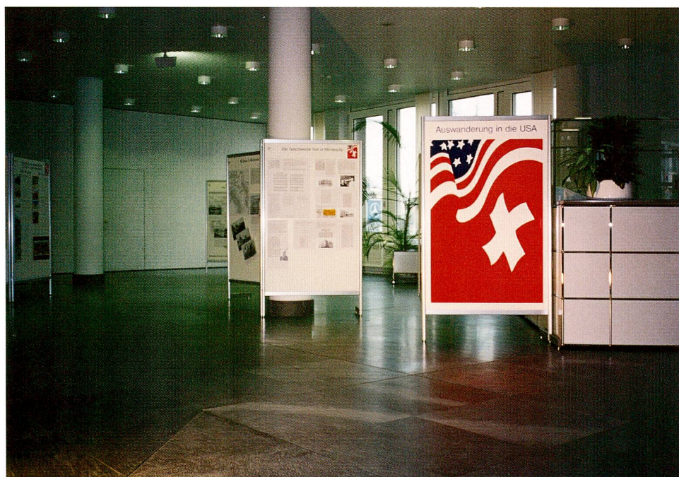
Abb. 2 Die grosse, dem Staatsarchiv unmittelbar vorgelagerte Eingangshalle des Verwaltungsbauwerkes «An der Aa» bietet sich für Ausstellungszwecke geradezu an. 1995 gestaltete Urs Peter Schelbert am Beispiel der sechs Geschwister Iten, genannt Grab-Beters, die 1855 und 1866 von Unterägeri nach Minnesota gezogen waren, das Thema «Auswanderung in die USA».

Jegliche Geschichtsschreibung ist nur auf der Grundlage erschlossener Archive möglich. Und umgekehrt führt die natürliche Beziehung zwischen Archiv und Geschichte gerade in Nicht-Universitätskantonen wie Zug dazu, dass das kantonale Archiv subsidiär die Rolle des regionalen historischen Forschungszentrums übernimmt. Vor diesem Hintergrund wird es verständlich, dass das Staatsarchiv in Bezug auf seine Verpflichtung, die zugerschen Gemeinden in Archivfragen zu beraten, den Schwerpunkt zunächst einmal auf die Ordnungs- und Erschliessungsarbeit im historischen Archivbereich legte. Seit 1985 wurden oder werden die in vereinzelt Fällen bis ins 13. Jahrhundert zurückreichenden Bestände von mehr als einem Dutzend gemeindlicher Archive in Zug, Baar, Cham, Hünenberg und im Ägerital geordnet, neu verpackt, signiert und durch detaillierte Verzeichnisse für die rasche Informationssuche aufbereitet. Am erfolgreichsten verlaufen diese Arbeiten, wenn das Staatsarchiv als Projektleiter und nicht nur als punktueller Berater auftreten kann: Das Staatsarchiv gibt eine verbindliche Zeit- und Kostenschätzung ab, vermittelt einen Bearbeiter, führt diesen Bearbeiter und stellt sein eigenes methodisches Wissen und seine Infrastruktur