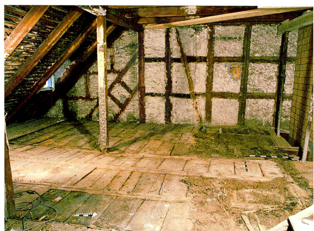
Abb. 8 Zug, Kolinplatz 5, erstes Dachgeschoss. Übersicht Südteil während der Bauuntersuchung 1996.