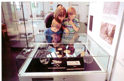
2003 «Gold aus Schweizer Bächen»