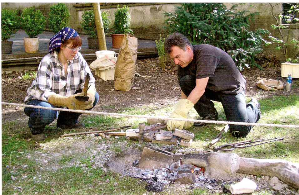
Abb. 1 Sonderausstellung «Der Löffel. In Höhepunkten durch die Kultur- geschichte». Demonstration eines Bronzegusses.

Der Kanton Zug verfügt schon seit 1928 über ein eigenes ur- und frühgeschichtliches Museum. Diese frühe Gründung beruht auf verschiedenen Initiatoren und Faktoren: Zum einen verfügt der Kanton Zug über reichhaltige Zeugnisse aus der Vergangenheit, zum andern wurde das Interesse an der Zuger Vergangenheit schon zu Beginn des letzten Jahrhunderts durch eine aussergewöhnlich aktive Bodenforschung in besonderem Masse geweckt. Ein weiterer wichtiger Aspekt ist, dass der Grossteil der im Kanton zutage getretenen Funde im Kanton blieb und nicht in alle Welt verstreut wurde. Wesentlich dafür verantwortlich war Michael Speck (1880–1969), der eigentliche Pionier der zugerischen Urgeschichtsforschung und Begründer des Museums. Er trug eine umfangreiche Sammlung urgeschichtlicher Funde zusammen, die bis heute den Grundstock des Museumsbestandes bildet. Specks Initiative und der 1928 gegründeten Zuger Vereinigung für Ur- und Frühgeschichte ist es zu verdanken, dass das Museum für Urgeschichte in Zug am 9. November 1930 zum ersten Mal eröffnet wurde. Von Beginn an wurde viel Wert auf eine attraktive und erlebnisintensive Vermittlung von Archäologie und Urgeschichte gelegt. Insbesondere für Schulklassen wurde ein breites Spektrum an didaktischem Material bereitgestellt, was sich bis heute erhalten hat und sich positiv auf das generelle Vermittlungskonzept auswirkte.