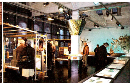
2004/05 «Alles aus Holz»