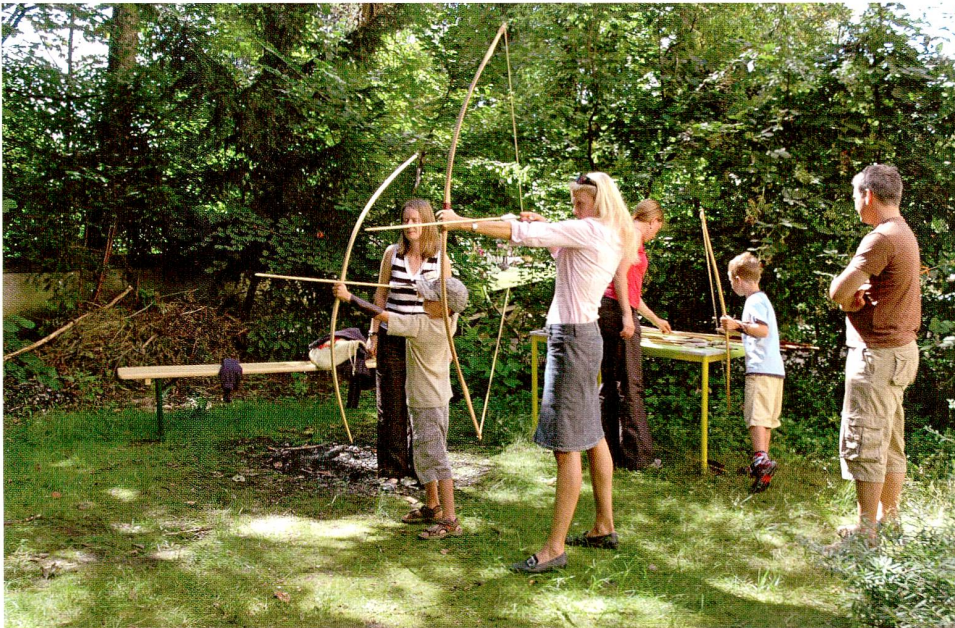
Abb. 7 «Museum nach Mass». Familie beim Bogenschiessen im Museumsgarten.

archäologischen Sammlung optimal zu nutzen und die Besucherattraktivität zu verbessern, sind folgende Raumentwicklungen nötig: