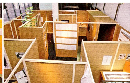
2007 «Von der Ausgrabung ins Museum»