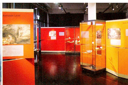
2006/07 «Der Löffel»