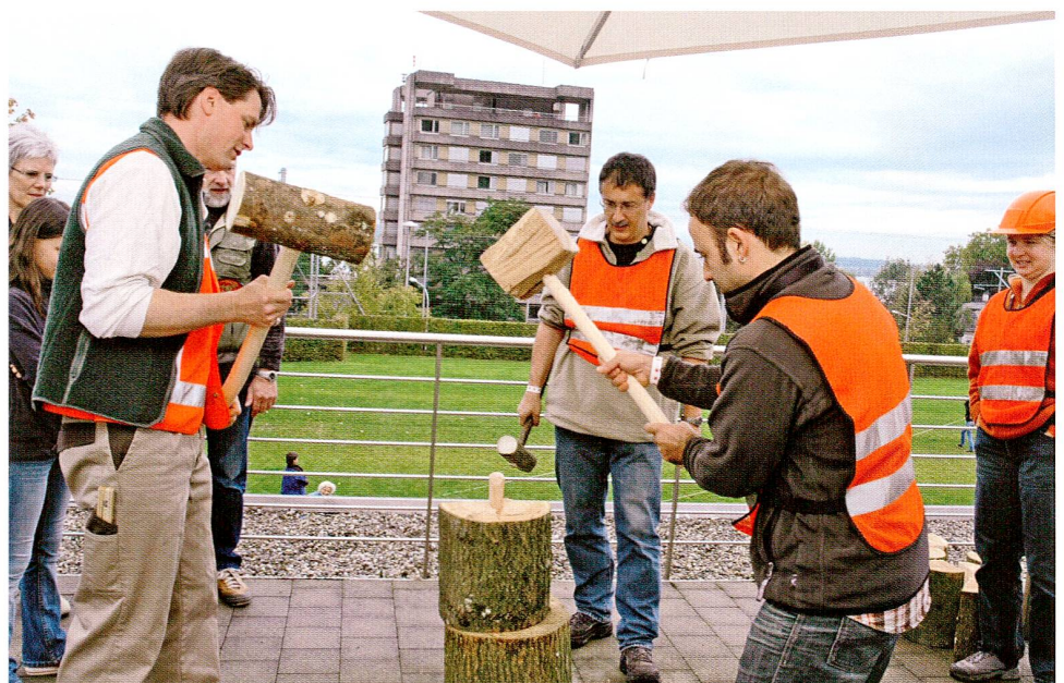
Abb. 4 Jubiläumsfest «Tugiade» 2007. Das Team der Kantonsarchäologie Zug beim «urgeschichtlichen» Holzspalten.

Wechselausstellungen sind laut verschiedenen Studien der wichtigste Grund, warum Menschen ins Museum kommen. Im Museum für Urgeschichte(n) jedoch nehmen die monatlich stattfindenden Sonntagsveranstaltungen, die während der Sonderausstellungen zum Begleitprogramm gehören, einen wahrscheinlich bedeutenderen Stellenwert ein. Sie sind zentral für die Vermittlung von Inhalten und für die Dynamisierung des Museumsbetriebs sowie für eine publikumsorientierte Öffnung. Dabei hat Familienfreundlichkeit eine hohe Priorität. So waren etwa an der 2007 durch-