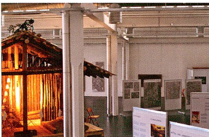
1997 «Zeichen im Fels»

Von grosser Bedeutung für das Museum, aber auch für die archäologische Forschung im Kanton Zug war die Aus-