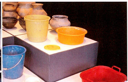
2000 «Können Sie mir mal die Butter reichen?»