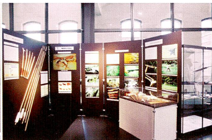
1998/99 «Mit dem Pfeil, dem Bogen ...»