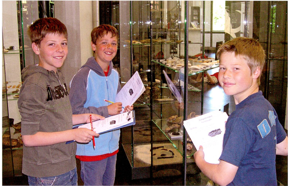
Abb. 6 Dauerausstellung, Schüler beim Ausfüllen von Arbeitsblättern.

die Vergangenheit geweckt werden. Unser Kernpublikum bei diesen Anlässen besteht aus generationsübergreifenden Besuchergruppen (Kinder in Begleitung Erwachsener), weshalb wir – neben der experimentellen Präsentation – ein (eher aktives) Kinderprogramm als auch ein (eher informatives) Erwachsenenprogramm anbieten. Beispielsweise organisieren wir bei einer Sonntagsaktion zum Thema Bronzegiessen verschiedene Stationen. Highlight ist die Demonstration des Bronzegusses. Für die Erwachsenen werden die einzelnen Arbeitsschritte und die Entwicklung der Technologie ausführlicher dargestellt, wozu sowohl Museumspersonal als auch Mitarbeitende des Experiments zur Verfügung stehen. Die Kinder können parallel dazu einen Radanhänger aus Zinn giessen und diesen überarbeiten. Indem sie die einzelnen Arbeitsschritte bis zum Endprodukt selber ausprobieren, «begreifen» sie die technischen Vorgänge – und können schliesslich auch noch ein Andenken mit nach Hause nehmen.