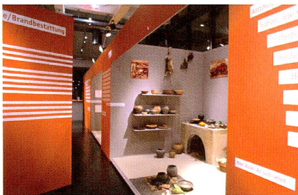
2001 «Vom Geschirr zum Genuss»