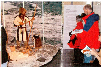
2002 «Ötzi aus dem Eis»