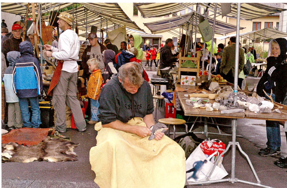
Abb. 5 Jubiläumsfest «Tugiade» 2007. Marktstände mit Präsentationen von Experimentalarchäologen (Feuersteinschlagen).

Für die lebendige Archäologievermittlung in Museen haben die Experimentalarchäologie und Archäotechnologie eine zunehmend grössere Bedeutung erlangt. Ihre handlungs- und gesprächsorientierten Veranstaltungen sind äusserst attraktiv und generieren viel Publikum, da nicht bloss Wissen weitergegeben wird, sondern eigenes Erleben im Zentrum steht. Neben dem Spass soll das Verständnis für