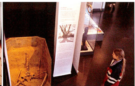
2002/03 «Fromm – fremd – barbarisch»