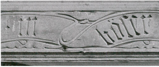
Abb. 12 Zug, Neugasse 21, Decke. Flachgeschnitzter Zierfries (Ausschnitt), Schriftband. Die ganze Inschrift lautet: «es ist besser böser lut fintschaft den sin in böser geselschaft, 1538».

böser lut fintschaft den sin in böser geselschaft, 1538». 48 Von dieser Decke hat sich im Jahr 2004 nur noch ein Fragment des schmalen Frieses, auf dem das geschweifte Band mit der Inschrift eingeschnitzt ist, erhalten (Abb. 12). 49 Die Formen sind flächig und ihre Ränder linear aus der glatten Holzoberfläche herausgearbeitet. Daher wirkt die Schnitzerei wenig räumlich und formal reduziert.