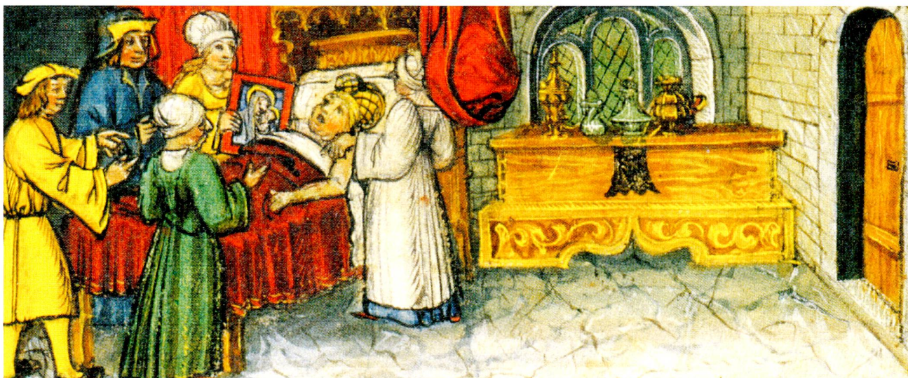
Abb. 2 Tod Philipps des Schönen von Kastilien (1506) in seinem Schlafgemach, rechts eine Kastentruhe mit flachgeschnittener Sockelzone. Illustration aus der Luzerner Chronik von Diebold Schilling, 1511/13.

schichtenanalyse zeigt, dass der flachgeschnittene Zierfries nicht grundiert ist und dass die einzelnen Bereiche mit einer einzigen Farbe ausgemalt sind. Die Farben sind mit blosserem Auge nur teilweise erkennbar. Mit Hilfe der Pigmentanalyse (s. dazu den Textkasten S. 119) wird der optische Eindruck bestätigt und teilweise konkretisiert: Das Akanthusblatt, das sich um den zentralen Mittelstab schlingt, war ursprünglich auf der Rückseite mit einem kräftigen, warmen Rot bemalt. Das rote Pigment konnte als Zinnober identifiziert werden. Die Blatt-Vorderseite war von türkisgrüner Farbe, die möglicherweise ein oder mehrere undefinierte Kupferpigmente enthielt. Die Adern des Blattes auf der Rückseite waren in einem dunkelbraunen Ton gehalten, welcher vorwiegend aus rot-orangen und schwarzen Pigmenten bestand. Das darin nachgewiesene Kupfer könnte aus korrodierten Kupferpigmenten stammen. Die Blattadern auf der Vorderseite sowie die feinen Linien an den