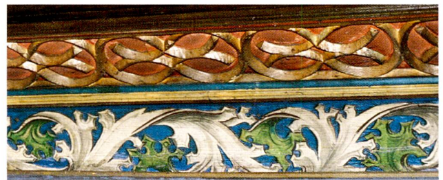
Abb. 9 Zug, Beinhaus St. Oswald, Decke. Flachgeschnitzter Zierfries (Ausschnitt), Akanthusranke mit Mittelstab. 1535.

Die in sich geschlossenen, schmalen Friese sind mit der Jahrzahl 1535 und den Initialen «JO W» signiert. Beim Schnitzer handelt es sich ver-