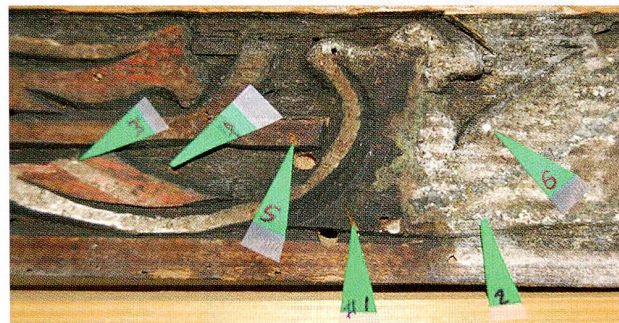
Zug, St.-Oswalds-Gasse 10. Fragment einer flachgeschnitzten Zierleiste (Ausschnitt). Entnahmestellen der Proben 1–6.

Aufgrund einer Pigment- und Malschichtenanalyse kann die ehemalige Farbigkeit des Frieses genauer bestimmt und rekonstruiert werden (vgl. Abb. 1). 5 Die Mal-