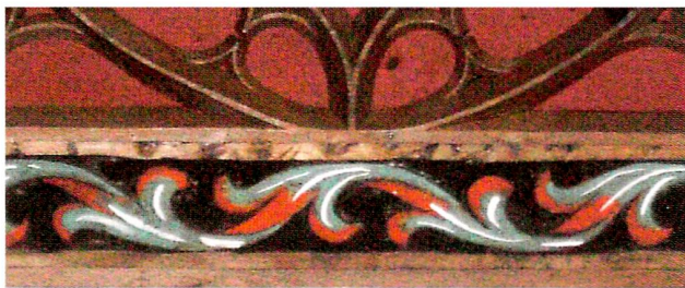
Abb. 7 Menzingen, Beinhaus St. Anna, rekonstruierte Decke im Chorbereich. Flachgeschnitzter Zierfries (Ausschnitt), Akanthusranke. 1512.