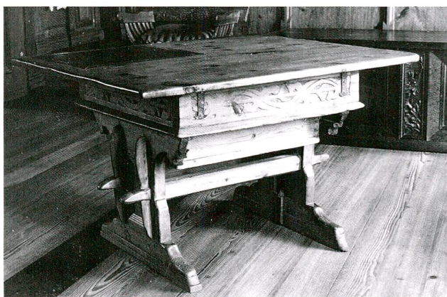
Abb. 3 Spätgotischer Wangentisch aus dem Engadin mit flachgeschnitztem Akanthusband auf dem Schubladenkörper. Föhre, 1572. (Sammlungszentrum des Schweizerischen Landesmuseum Zürich)

Die Flachschnitzerei ist eine dekorative und effektvolle und zudem eine schnelle und einfache Schnitztechnik. Im Gegensatz zur dreidimensionalen Reliefschnitzerei ist der Flachschnitt in der Regel aus einem flachen Stück Holz gearbeitet und weist zwei Ebenen auf: eine erhabene vordere, welche das Motiv darstellt, und eine tiefere hintere, welche die Zwischenräume beschreibt. Diese positiv-plastische Schnitzerei ist eine stark reduzierte dreidimensionale Form, die bei seitlichem Lichteinfall ein dezentes Schattenspiel erzeugt. Sowohl Vorder- als auch Hintergrund können bemalt sein. Im Gegensatz zu zweidimensionalen, gemalten Friesen wirken die flachgeschnitzten aufgrund ihrer Räumlichkeit und dem daraus resultierenden Licht-Schatten-Spiel lebendiger. 6