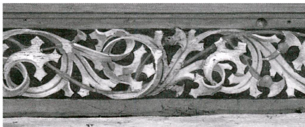
Abb. 8 Zug, Beinhaus St. Michael, Decke. Flachgeschnitzter Zierfries (Ausschnitt), Akanthusranke mit Mittelstab. Hans Winkler, 1516, später übermalt.

Die flachgeschnitzte Holzdecke in der Beinhauskapelle St. Anna wurde von Hans Winkler gestaltet und um 1516 eingebracht, wie die eingeschnitzten Initialen und die Jahrzahl belegen. 29 Die Decke wird durch flachgeschnitzte Friese umfasst und der Balkenkonstruktion entsprechend in acht Felder geteilt. Wie Schlusssteine sitzen Medaillons auf deren Kreuzungen, und Halbmedaillons stossen an die Nord- und Süd-wand. Darauf sind figurative Motive dargestellt. Die Schnitzereien und deren Bemalungen wurden mehrfach überarbeitet, und so zeigt sich heute eine Mischung von verschiedenen Fassungen. 30 Die flachgeschnitzten Zierfriese sind geschlossen und schmal. Dargestellt sind Blattranken-