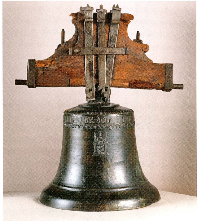
Abb. 1 Hünenberg, Kapelle St. Wolfgang. Angelusglocke von 1480, vermutlich gegossen von Peter II. Füssli in Zürich. (Depositum in der Burg Zug)

gerade vier auf diese Weise geschmückte Glocken bekannt geworden. 4 In der Pilgerzeichen-Forschung hat die Hünenberger Glocke bisher nicht die ihr gebührende Beachtung gefunden; 5 mit der vorliegenden Untersuchung soll diese Lücke geschlossen werden.