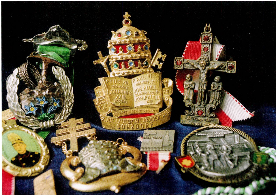
Abb. 3 Volksmarschabzeichen, zweite Hälfte 20. Jahrhundert. Niello- kreuz von St. Trudbert (rechts hinten), Papsttiara mit Petrus- Schlüssel über Buch (hinten Mitte), Papsttiara mit dreifachem Kreuz (vorne) sowie weltliche Symbole.

nuel Levinas (gestorben 1995) stammt die Formulierung: Nicht primär im Denken, sondern in der Sinnlichkeit vollzieht sich Transzendenz.