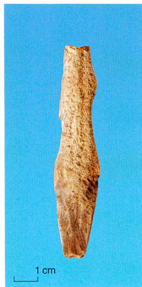
Abb. 1 Zug-Riedmatt. Fragment einer Stabharpune aus Hirschgeweih.

Beim Fischspeer sind die Spitze oder die Spitzen fest mit dem Schaft verbunden. Mit dem Speer werden zumeist kleinere Fische vom Ufer oder Einbaum aus gestochen. Die