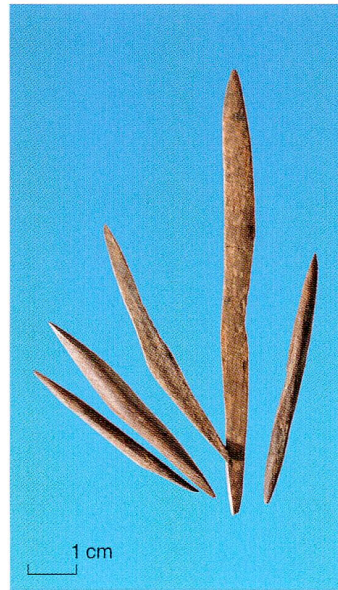
Abb. 4 Zug-Riedmatt. Querangeln aus beid- seitig zugespitzten Spänen von Hirsch- rippen.

Spitzen können mit Widerhaken bewehrt sein. Sind die Speere zwei- oder mehrzinkig, spricht man von Fischgabeln, Fischzangen oder Fischrechen. Der Fisch wird dabei vom Speer durchbohrt oder in der Fischgabel eingeklemmt. Auch Pfeile sind in diese Gerätegruppe einzubeziehen.