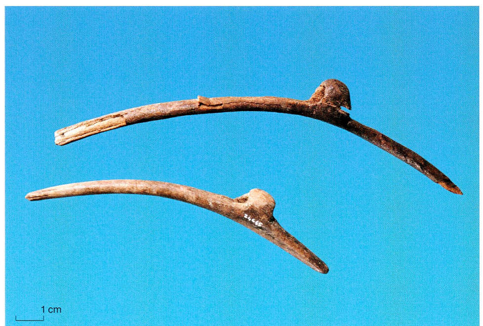
Abb. 9 Steinhausen-Sennweid West. Mit Ösen versehene Netznadeln aus Hirschgeweih.