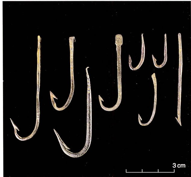
Abb. 6 Zug-Sumpf. Verschieden grosse Angelhaken aus Bronze.

Neben den Doppelsitzen kommen in den jungsteinzeitlichen Seeufersiedlungen bereits auch Angelhaken aus Hirschgeweih und Knochen vor. In der Seeufersiedlung Steinhausen-Sennweid West wurde ein eher grob geschnitzter Angelhaken aus Hirschgeweih geborgen (Abb. 5); speziell an ihm und selten ist die doppelte Durchlochung des Schaftendes zur Befestigung der Leine. Ab circa 2000 v. Chr. treten vermehrt aus Metall gefertigte Angelhaken auf. Zu ihrer Herstellung wurde der neue Werkstoff Bronze und später auch Eisen benutzt. Schon in prähistorischer Zeit sind verschiedene Typen bekannt: Einzel- oder Doppelangelhaken, mit oder ohne Widerhakenspitzen. Für die Leinenbefestigung waren umgebogene Ösen oder flache, teils gekerbte Ösenplatten beliebt. Zu heutigen Angelhaken besteht kaum ein Unterschied.