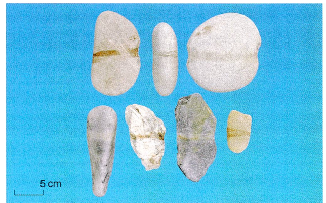
Abb. 8 Cham-Eslen. Steinerne Netzsenker.

Weitere Zeugen der urgeschichtlichen Netzfischerei sind steinerne Netzsenker und Netzschwimmer aus Holz. Sie hielten das Netz an der richtigen Stelle im Wasser. Diese Objekte haben sich in ihrer Form und Machart von der Steinzeit bis zum Mittelalter kaum verändert. Aus den Seeufersiedlungen liegen vor allem steinerne, zur Beschwerung der Netzunterkante dienende Netzsenker vor. Verwendet wurden flache Kieselsteine, bei denen zwei Kerben herausgeschlagen wurden. Das ideale Holz für die Netzschwimmer war Pappelrinde. Die urgeschichtlichen Netzschwimmer sind rundlich bis viereckig und zentral durchlocht (Abb. 7).