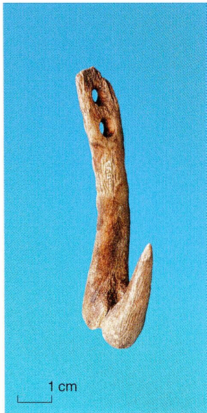
Abb. 5 Steinhausen-Sennweid West. Grosser Angelhaken mit doppelter Durchlochung aus Hirschgeweih.