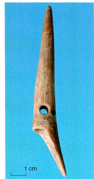
Abb. 2 Steinhausen-Sennweid West. Tüllenkebelharpune aus der Spitze einer Hirschgeweihsprosse.