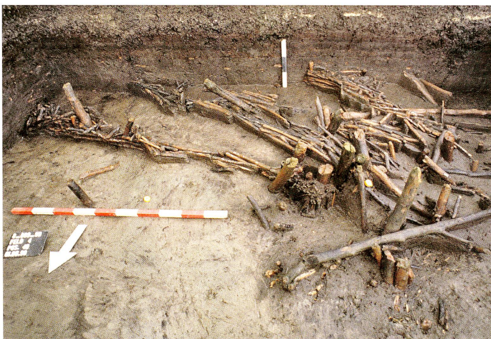
Abb. 10 Steinhausen-Sumpfstrasse West. Frühmittelalterliche Fischfang- anlage mit drei aufeinander zulaufenden Flechtwerkzäunen (von links oben zur Bildmitte) und Pfosten zur Befestigung von Reusen (Bildmitte).

Von grosser Bedeutung ist der Fund einer frühmittelalterlichen Fischfangeinrichtung im Jahr 1998/99 in Steinhausen-Sumpfstrasse West. 11 Es handelt sich dabei um ein grösseres «Leitsystem» in der ehemaligen Flachwasserzone am Nordufer des Zugersees (Abb. 10). Die in verschiedenen Ausgrabungsflächen ergrabenen Leitwerke aus Flechtwerkzäunen des unteren Holzhorizonts bilden einen Trichter (Grossreuse), der nach Südosten, gegen den See hin offen ist. Am Trichterende im Nordwesten standen verschiedene Pfosten und Staken, wo flexible Netzreusen oder