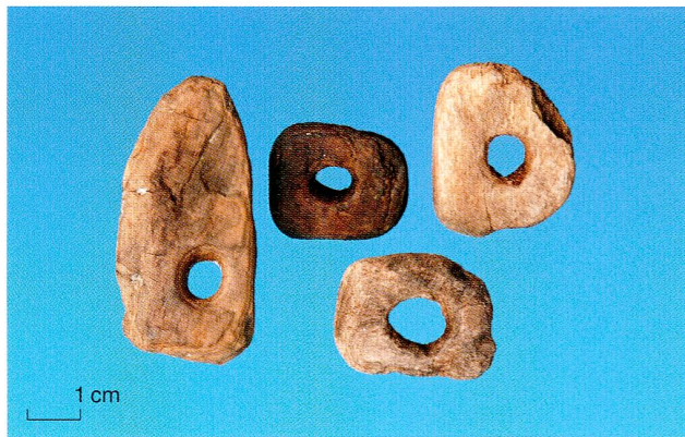
Abb. 7 Verschiedene Zuger Seeufersiedlungen. Netzschwimmer mit zentraler Durchlochung aus Pappelrinde.