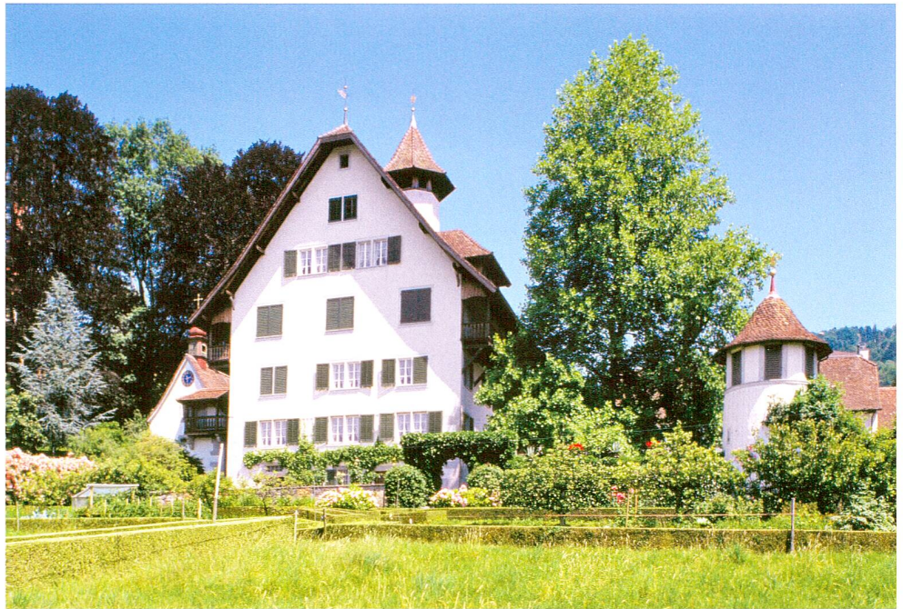
Abb. 2 Der «Zurlaubenhof» an der heutigen Hofstrasse in Zug war bis 1799 mit wenigen Unterbrüchen im Besitz der Familie Zurlauben.