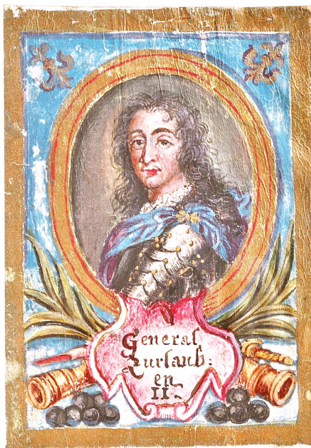
Abb. 3 Kolorierte Miniatur von Beat Fidel Zurlauben (1720–1799), Generalleutnant des Schweizer Garderegiments in französischen Diensten (Aargauer Kantonsbibliothek, MsZF 21: D).

grösstenteils Beat Fidel Zurlauben (1720–1799) zu verdanken, dem letzten männlichen Nachkommen der Familie (Abb. 3). 11 Seines Zeichens Offizier in französischen Diensten, sah sich Beat Fidel ebenso als Historiker wie als militärwissenschaftlicher Schriftsteller. 12 Hinzu kommt, dass er ein Büchernarr war, der die geerbte Familienbibliothek mit zahllosen Neuerwerbungen vermehrt hat – zu keiner Zeit ist die zurlaubensche Privatbibliothek dermassen angewachsen wie zu Lebzeiten von Beat Fidel. 13