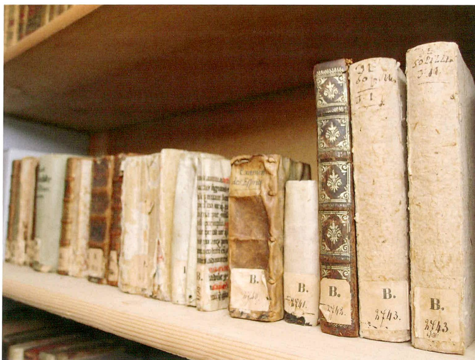
Abb. 7 Einige Bücher aus der Zurlauben-Bibliothek, wie sie sich heute im «Bücherturm» der Aargauer Kantonsbibliothek präsentieren.

der 1950er Jahre nahm der damalige Vizedirektor der Landesbibliothek, Wilhelm Joseph Meyer, die Erschliessung der «Acta Helvetica» an die Hand und liess über 22 000 Regesten, also kurze Zusammenfassungen des Inhalts mit Angaben von Datum, Entstehungsort sowie Orts- und Personennamen, zu den «Acta Helvetica» und den «Miscellanea Helveticae Historia» erstellen. Obwohl die Regesten ein beträchtliches Namenmaterial zur Personen- und Ortsgeschichte erschlossen, befriedigte diese Form der Bearbeitung die Fachwelt nur bedingt. 35