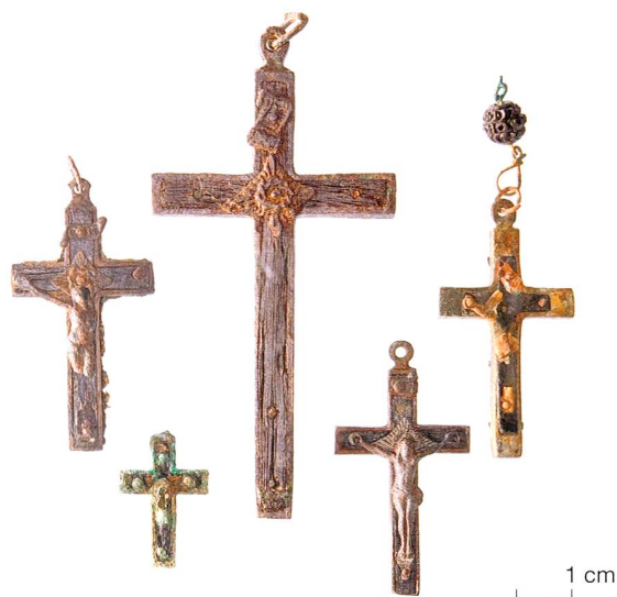
Abb. 1 Steinhausen, ehemaliger Friedhof. Auswahl von Kreuzanhängern. Die kleinen Kreuze stammen aus Gräbern der Belegungsperioden ca. 1890–1920 und 1941–1946, das grosse in der Mitte ist ein Streufund aus einer Lehmschicht.

Die Grabbeigaben – Rosenkränze, Kreuzanhänger und eine Medaille – fanden sich in Gräbern der Belegungsperiode 1941–1946 (Grab Nr. 1 und 2) sowie in Gräbern der Belegungsperiode ca. 1890–1920 (Gräber Nr. 5, 7, 10, 12 und 14) (Abb. 1). 5 Ihr Erhaltungszustand ist mehrheitlich schlecht. Sämtliche Rosenkränze sind nur noch in Reststücken vorhanden. Oftmals bestehen sie aus kleineren und grösseren Gruppen von Rosenkranzperlen, teilweise aber auch aus gekettelten Rosenkranzfragmenten. Die Kreuzanhänger weisen ebenfalls zum Teil starke Beschädigungen auf. In einem Grab (Grab-Nr. 10) fanden sich gleich zwei Kreuzanhänger neben mehreren geschnitzten Holzperlen. Eine päpstliche Medaille (Grab-Nr. 5) schliesslich lag im Brustbereich eines Verstorbenen (Abb. 2). 6 Auf der einen Seite zeigt sie die Mariendarstellung der sogenannten Wunderbaren Medaille, auf der anderen das