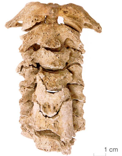
Abb. 5 Steinhausen, ehemaliger Friedhof St. Matthias. Halswirbelsäule, die von degenerativen Verände- rungen und rheumatoider Arthritis gezeichnet ist.

Es handelt sich dabei um die häufigste entzündliche Erkrankung der Gelenke. Dabei sind insbesondere die Hand-, Knie-, Schulter-, Fuss- und Hüftgelenke sowie die Halswirbelsäule betroffen, was auch beim Individuum aus Steinhausen gut erkennbar ist. Die Ursachen der Erkrankung sind bislang weitgehend ungeklärt. Es wird eine autoimmune Ursache angenommen, bei der körpereigene Substanzen vom Immunsystem angegriffen werden.