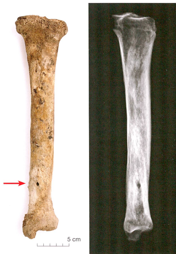
Abb. 3 Steinhausen, ehemaliger Friedhof St. Matthias. Schienbein mit Osteomyelitis. Im unteren Drittel kann die runde Öffnung des Eiterabszesses (Pfeil), auf der Röntgenaufnahme (rechts) zusätzlich die ganze Ausdehnung des Entzündungsherds erkannt werden.

marks bezeichnet. Ursachen sind in den meisten Fällen offene Knochenbrüche und Operationen am Skelett, die zur Kontamination mit Bakterien führen. 9