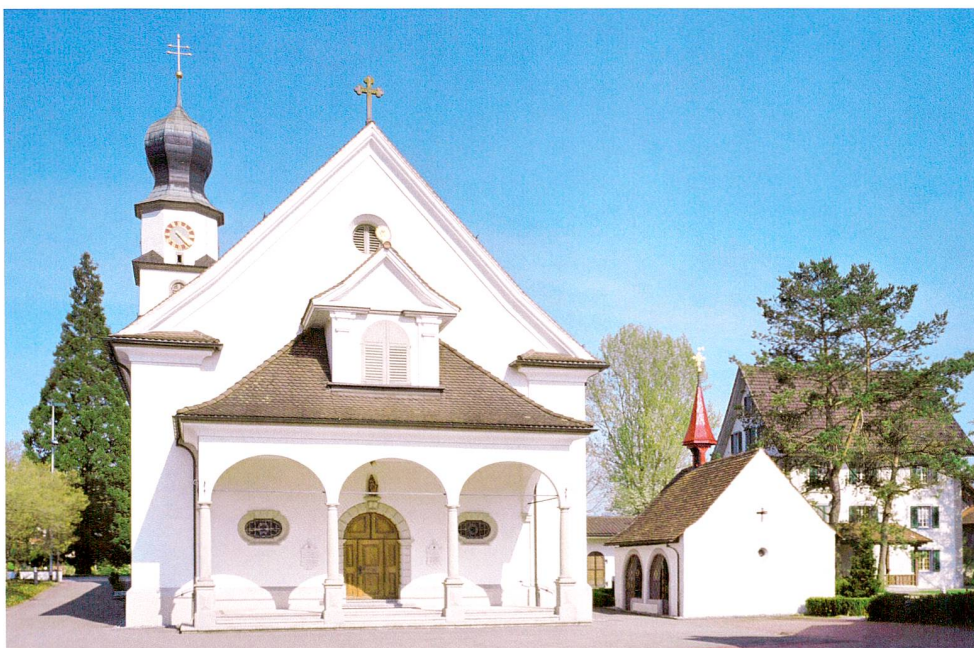
Abb. 1 Steinhausen. Pfarrkirche St. Matthias und Beinhaus «Unserer Lieben Frau». Die heutige Kirche wurde 1913/14 neu gebaut. Ansicht von Westen, vor den Baumassnahmen von 2011/12.