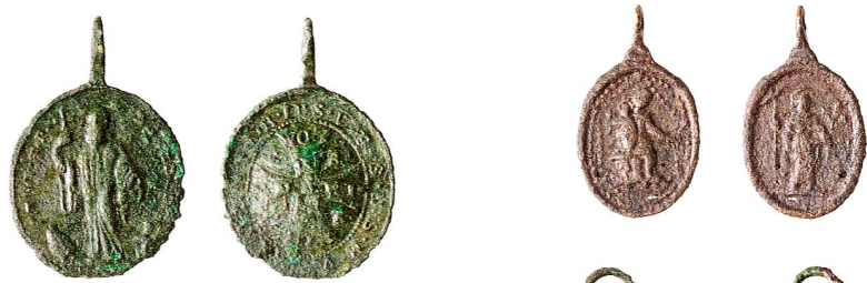
Abb. 6 (rechts)

Steinhausen, ehemaliger Friedhof. Benediktuspenninge aus dem 18. und 19. Jahrhundert. Streufunde. Massstab 1:1.