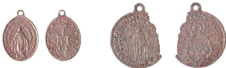
Abb. 4 Steinhausen, ehemaliger Friedhof. Medaillen zu Ehren der Unbefleckten Empfängnis Mariens, zweites Drittel 19. bis Anfang 20. Jahrhundert. Streufunde. Massstab 1:1.

Empfängnis Mariens geprägt worden sind (Abb. 4). Die erste, eine sogenannte Wunderbare Medaille, hat ihren Ursprung in den Visionen, welche die Novizin Catherine Labouré (1806–1876) im Jahre 1830 in der Kapelle des Mutterhauses der Barmherzigen Schwestern in Paris hatte. 13 Die zweite zeigt auf ihrer Vorderseite die Mariendarstellung der Wunderbaren Medaille und auf der Rückseite den hl. Franz von Assisi. 14 Unter den Marienmedaillen ist die Wunderbare Medaille jene mit der grössten Verbreitung. Ab 1832 geprägt, erreichte sie bereits im 19. Jahrhundert Auflagen in Millionenhöhe. Laut Aussage der 1947 heiliggesprochenen Catherine hatte Maria allen ihren besonderen Schutz zugesichert, welche eine gesegnete Medaille auf sich tragen und die auf der Medaille festgehaltene Anrufung mit Andacht sprechen. 15 Beide Medaillen können in die Zeit zwischen dem zweiten Drittel des 19. Jahrhunderts und dem Anfang des 20. Jahrhunderts datiert werden. Im Medaillenbild gehen – als Sinnbild der Wirkungskraft Mariens – Strahlen der Gnade von ihren Händen aus. Der Medaille werden durch das Wirken der unbefleckten Jungfrau unter anderem Heilungen in Krankheit, Beistand in Notlagen sowie Hilfe für kranke Seelen und für die Sterbenden zugesprochen.