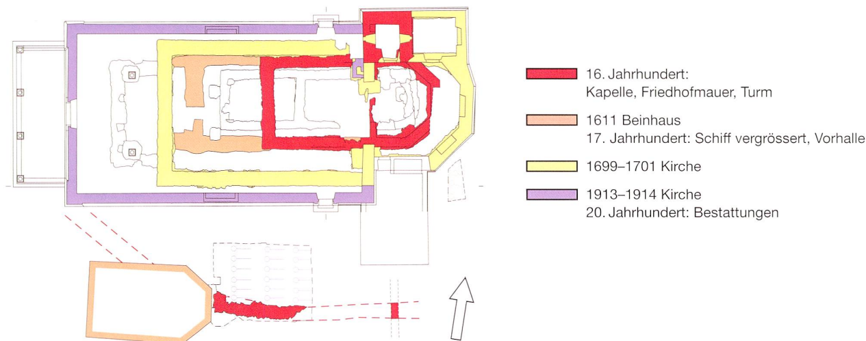
Abb. 2 Steinhausen, Pfarrkirche St. Matthias. Rekonstruierte Grundrisse der Kapellen, Kirchen und der Friedhofsmauer. Eingezeichnet sind auch das Beinhaus sowie die beiden Grabungsflächen aus dem Jahre 2010. Massstab 1:400.

eine Aushubüberwachung durch. 6 Die dabei geborgenen Skelette wurden nach der anthropologischen Untersuchung in einer neu erstellten Gebeinegruft östlich des Beinhauses würdevoll wiederbestattet.