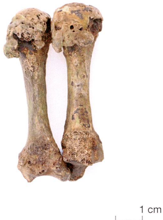
Abb. 4 Steinhausen, ehemaliger Friedhof St. Matthias. Die ausgeprägten degenerativen Veränderungen (Osteophyten) an den oberen Gelenkenden zweier Mittelhand- knochen sind klare Merkmale für rheumatoide Arthritis.