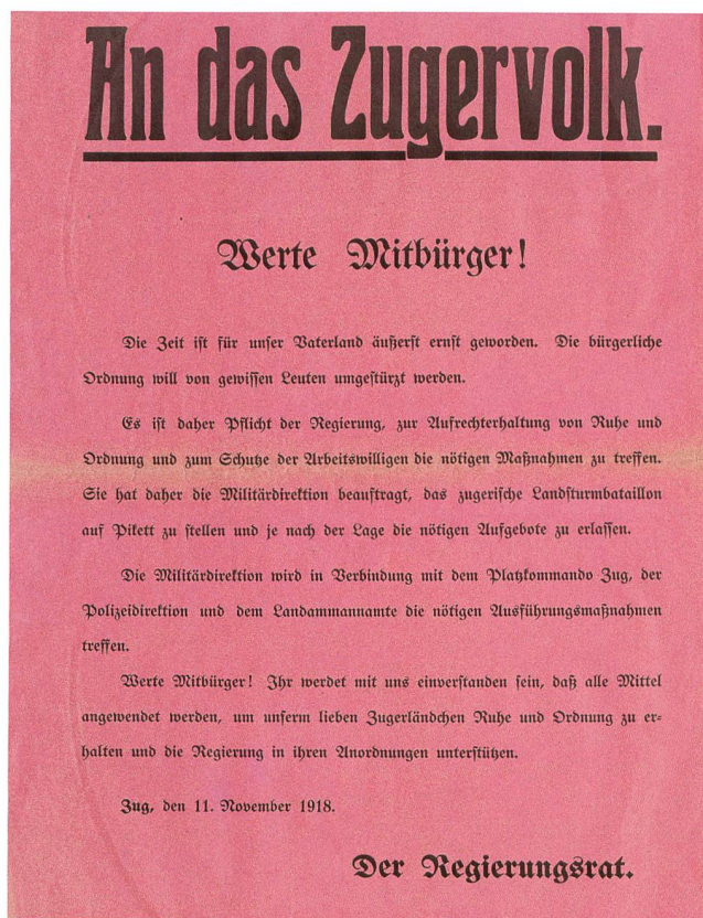
Abb. 2 Beim Ausbruch des Landesstreiks erliess der Zuger Regierungsrat am 11. November 1918 einen Aufruf an das Zuger Volk.

Die beiden Zuger Landwehrkompanien III/142 und IV/142 leisteten dagegen ihren gut fünfwöchigen sechsten Aktivdienst vom 22. April bis 1. Juni 1918 auf «Schmuggler-