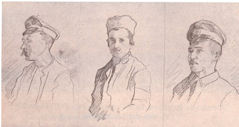
Abb. 3 Aus deutscher Kriegsgefangenschaft entwichene russische und serbische Soldaten, die im Mai 1918 von Zuger Landwehrsoldaten am schaffhausischen Grenzposten Merishausen aufgegriffen wurden. Skizzen von Wachtmeister Hans Zürcher; Füs Kp IV/142.

ständigkeit. Jeder ist nun ein Herr [sic], jeder trägt grosse Verantwortung. Das muss jedem bewusst sein.» 17