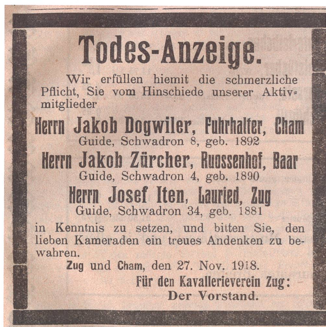
Abb. 6 Todesanzeige des Kavallerievereins Zug für die drei Zuger Guiden, die im November 1918 im Aktivdienst an der Grippe starben.

der Grippe zum Opfer gefallen sein. Die Zahl der Grippetoten wäre sicher um einiges höher, wenn das Füs Bat 48 mit gegen 800 jungen Männern, die besonders grippegefährdet waren, unter den Fahnen gestanden wäre.