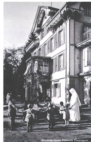
Abb. 2 Spielende Kinder vor dem Kinderheim «Theresia» in Unterägeri, wohl um 1930. Das 1881 gegründete Heim war das erste im Ägerital. Seit 1928 wurde es von den Schwestern des Klosters Heiligkreuz in Cham geführt.

lichen, idyllischen Stätte für die erholungsbedürftige Jugend geworden.» 11 Zunächst bot das «Theresia» Platz für fünfzehn Kinder, im Laufe der Zeit wurde es ausgebaut. Bis 1965 wurde es unter der Leitung von Schwestern des Instituts Heiligkreuz bei Cham geführt, anschliessend wurde es zu einem Altersheim umfunktioniert. Insgesamt gab es im Kanton Zug rund sechzig Kinder- und Jugend-, Ferien- und Lehrlingsheime. Fast zwei Drittel dieser Institutionen befanden sich im Ägerital (Abb. 3), gefolgt von der Region Zug und Baar und einzelnen Heimen in Menzingen, im Ennetsee und in Walchwil. Viele der genannten Heime gingen auf private und gemeinnützige Gründungen zurück, aber auch von Bürgergemeinden getragene Waisenhäuser nahmen Kinder auf. 12