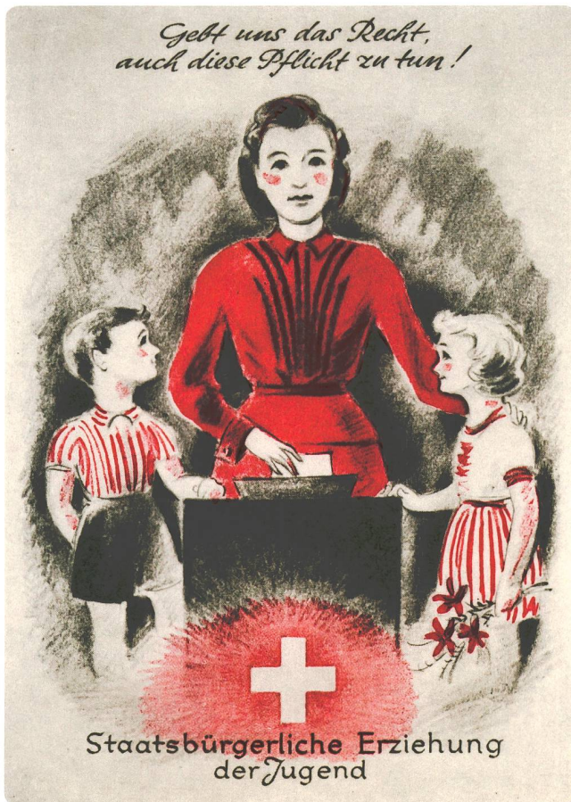
Abb. 7 Plakate für und gegen das Frauenstimmrecht, vermutlich eingesetzt bei den kantonalen Abstimmungen über die Einführung des Frauenstimmrechts in Zürich und Basel-Stadt, um 1920.