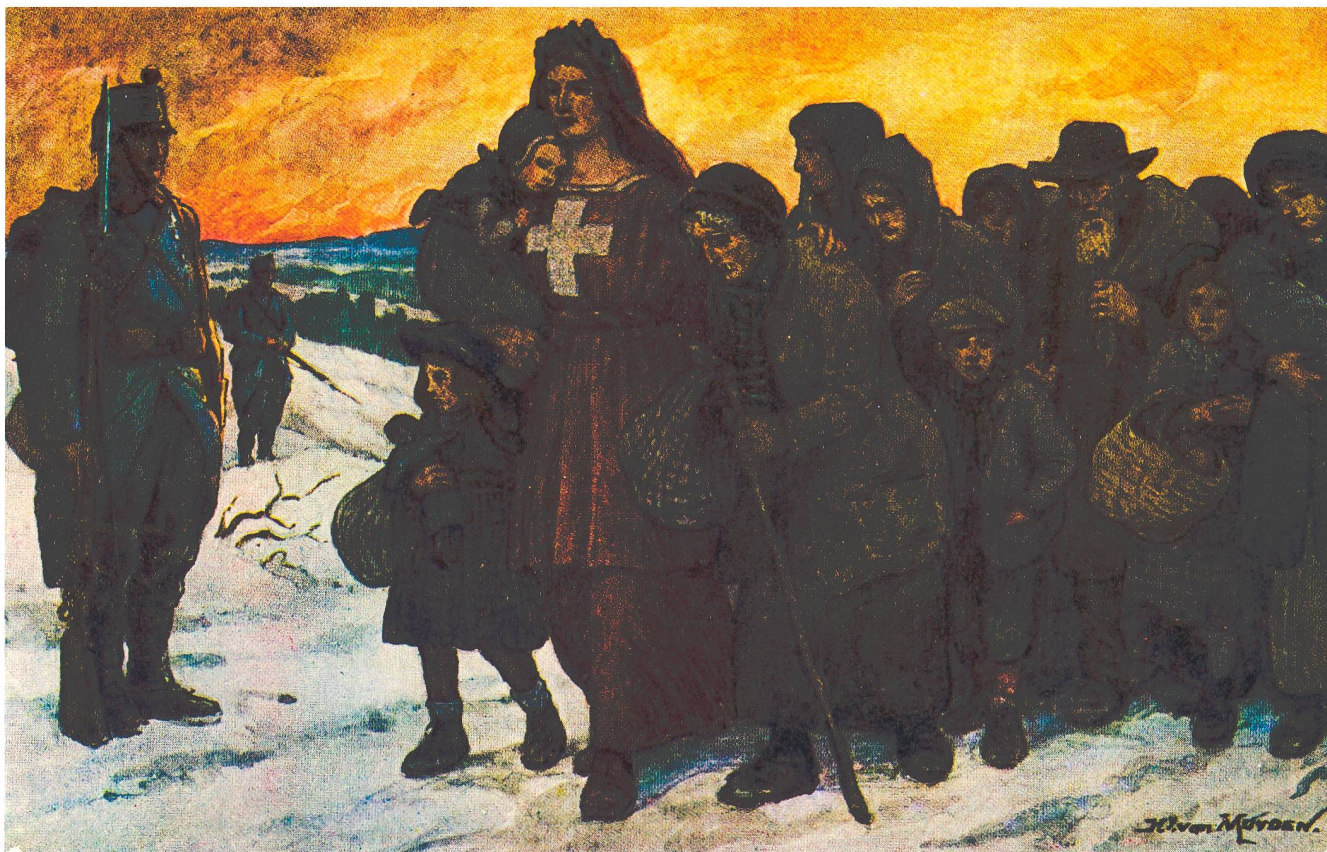
Abb. 1 Postkarte zur Bundesfeier 1915. Helvetia als weibliche Verkörperung der nationalen Identität und als Symbol für karitative Zuwendung kümmert sich um Notleidende, Kinder und Alte. Die Soldaten schützen stramm die Schweiz.

Wie reagierten die Zuger Frauen auf diese Situation? Organisierten sie sich neu, traten sie an die Öffentlichkeit und gewannen dadurch an Selbstständigkeit und Selbstbewusstsein? Fanden Forderungen nach rechtlicher und politischer Gleichstellung mit dem Mann, wie sie von einzelnen Organisationen zunehmend erhoben und in mehreren Staaten, wo Millionen von Männern nicht mehr aus dem Krieg zurückkehrten, auch erfüllt wurden, in Zug einen Widerhall? 3 Zuerst