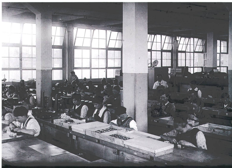
Abb. 3 Arbeiterinnen und Arbeiter in einer Werkhalle der Firma Landis & Gyr; 1920. Für Frauen aus unteren sozialen Schichten bedeutete Fabrikarbeit die einfachste Möglichkeit, regelmässig Geld zu verdienen. Allerdings erhielten sie nur rund die Hälfte des Lohnes der Hilfsarbeiter. Einige Frauen setzten sich für Verbesserungen ein. 1916 wurde in Zug ein Arbeiterinnenverein, die «erste sozialdemokratische Frauenorganisation in der katholischen Hochburg», gegründet. In der ersten Versammlung wurden Missstände in Kaufläden, Fabriken und im politischen Leben thematisiert. Vor allem junge Frauen zeigten sich militant: Während des Streiks in der Glühlampenfabrik 1918, begannen aufgrund der Entlassung einer agitierenden Arbeiterin, verprügelten «Jungburschinnen» die Streikbrecher.