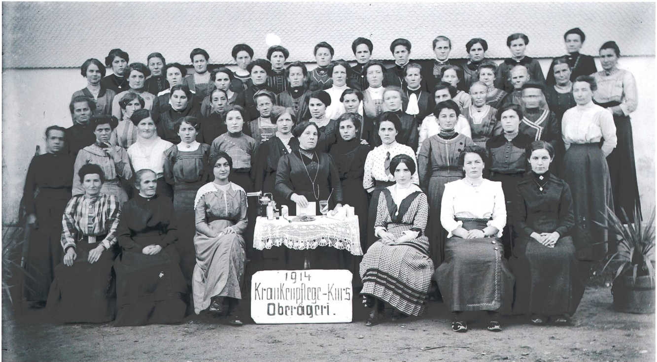
Abb. 4 Krankenpflegekurs in Oberägeri 1914 mit rund sechzig Teilnehmerinnen, organisiert vom «Haushaltverein» mit nur zehn Mitgliedern. Die Bereitwilligkeit, Hilfe zu leisten, war zu Beginn des Kriegs besonders gross. In Zug beteiligten sich rund 120 Teilnehmerinnen sowie einige «Jünglinge» am Kurs des Frauenhilfswerks. In Baar nahmen 62 Frauen und 8 Herren am Kurs des Samaritervereins teil.

und Töchter, «freiwillige Hilfskräfte», sollten sich in der «Anmeldezentrale für den Kanton Zug» im Marienheim in der Zuger Altstadt melden, Anmeldestellen in den Gemeinden würden später bekannt gegeben.