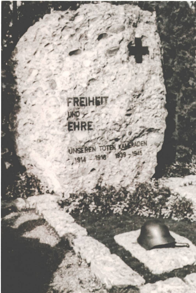
Abb. 11 Soldatengrab auf dem Friedhof St. Michael in Zug, enthüllt anlässlich der Gedenkfeier vom 30. September 1945.

Sterbens setzte der Trend ein, der in den neuen nationalen Massenheeren Verstorbenen auf egalisierende Weise zu gedenken. 103 In Kontrast zu den Hierarchien in der real existierenden Gesellschaft und im Militär wurden die Menschen resp. die Männer als gleichwertige Teile der abstrakten Kategorien Nation und Tod beschworen und inszeniert.