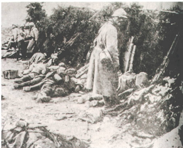
Abb. 6 Im «Zuger Volksblatt» vom 24. August 1964 publizierte Fotografie einer französischen Stellung in den Argonnen nach einem deutschen Angriff, Zeitpunkt unbekannt. Die kollektiv geteilten Bilder zum Ersten Weltkrieg verändern sich in den 1960er Jahren: An die Stelle der wahlweise fleissigen oder geselligen Aktivdienst-Leistenden in heimischer Landschaft tritt das Grauen der Schützengraben an der Westfront.

auf die chaotischen Verhältnisse während des Ersten Weltkriegs hinwies, um zu bezeugen, dass inzwischen aus Fehlern gelernt worden sei. 74