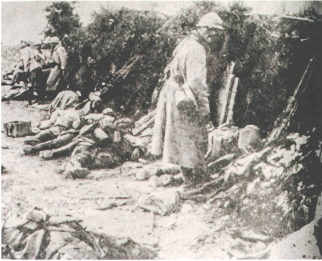
Abb. 6 Im «Zuger Volksblatt» vom 24. August 1964 publizierte Fotografie einer französischen Stellung in den Argonnen nach einem deutschen Angriff, Zeitpunkt unbekannt. Die kollektiv geteilten Bilder zum Ersten Weltkrieg verändern sich in den 1960er Jahren: An die Stelle der wahlweise fleissigen oder geselligen Aktivdienst-Leistenden in heimischer Landschaft tritt das Grauen der Schützengräben an der Westfront.

auf die chaotischen Verhältnisse während des Ersten Weltkriegs hinwies, um zu bezeugen, dass inzwischen aus Fehlern gelernt worden sei. 74