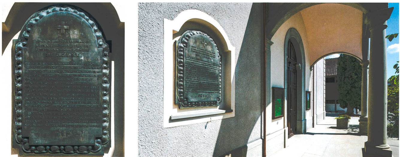
Abb. 8 Kirche St. Vitus in Morgarten/Haselmatt, Gemeinde Oberägeri. Gedenktafel zu Ehren der Zuger Wehrmänner, die während des Aktivdienstes im Ersten Weltkrieg starben. Die Sterbedaten ab dem Juli 1918 verweisen darauf, dass die «Spanische Grippe» auch unter den Zuger Truppe Opfer forderte.

Folge hatte, dass neben Vertretern der kantonalen und gemeindlichen Exekutiven 1500 Personen anwesend waren, darunter gut 600 für den Wettkampf eingeschriebene Schützen. Der Anlass wurde zugleich zur militärischen Leistungsschau genutzt. So kreisten drei Doppeldecker «während der Enthüllungsfest bei der Kapelle in majestätischem Fluge mehr als