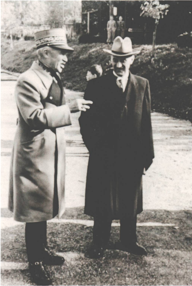
Abb. 12 Der vormalige General Henri Guisan (1874–1960) und der erste Zuger Bundesrat Philipp Etter (1891–1977) anlässlich der Feier zum einhundertjährigen Bestehen der Offiziersgesellschaft des Kantons Zug. Guisan und Etter kam im Festakt die Ehre zu, beim Soldatengrab auf dem Friedhof St. Michael in Zug die «Grabinsignien» Schwert und Helm niederzulegen.