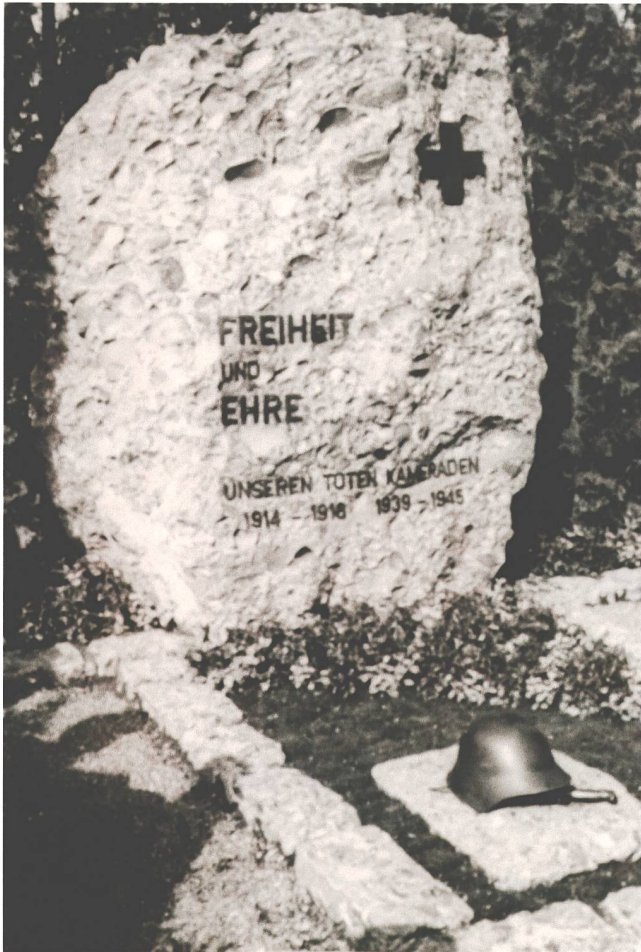
Abb. 11 Soldatengrab auf dem Friedhof St. Michael in Zug, enthüllt anlässlich der Gedenkfeier vom 30. September 1945.

Sterbens setzte der Trend ein, der in den neuen nationalen Massenheeren Verstorbenen auf egalisierende Weise zu gedenken. 103 In Kontrast zu den Hierarchien in der real existierenden Gesellschaft und im Militär wurden die Menschen resp. die Männer als gleichwertige Teile der abstrakten Kategorien Nation und Tod beschworen und inszeniert.