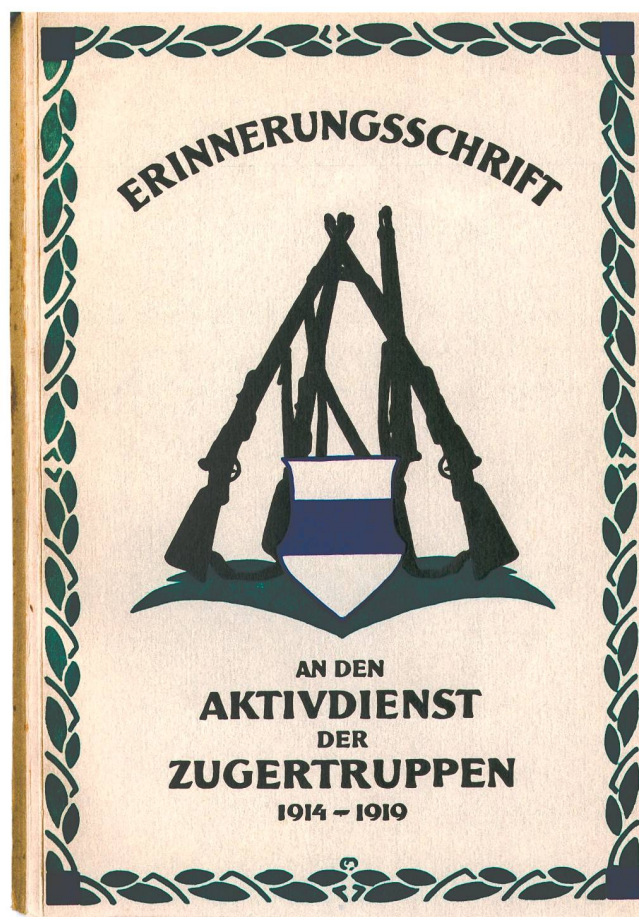
Abb. 1 «Erinnerungsschrift» von 1924. Auf Geleitworte und einen kurzen historischen Abriss zu den kantonalen Infanterie-Einheiten folgen Schilderungen der Aktivdienste im Ersten Weltkrieg. Am meisten Aufmerksamkeit erhält die zahlenmässig stärkste Zuger Einheit, das Auszugsbataillon 48. Den Abschluss bildet ein hierarchisch strukturiertes Verzeichnis sämtlicher Zuger Wehrmänner, die Aktivdienst geleistet haben.

auf Soldatenbriefen, die von «Kameraden aller Grade» stammten. 5 Sie beinhaltet Berichte zu (fast) sämtlichen Zuger Truppen. Und sie listet namentlich alle Zuger auf, die zwischen 1914 und 1919 Aktivdienst geleistet haben. Tatsächlich ist die Schrift aber das Produkt einer militärischen, politischen und sozioökonomischen Elite des Kantons: Die Initianten der Schrift waren hochrangige Militäranghörige, unter ihnen Hermann Stadlin, der ehemalige Kommandant des Zuger Auszügerbataillons 48, und Hauptmann Philipp Etter. Stadlin,