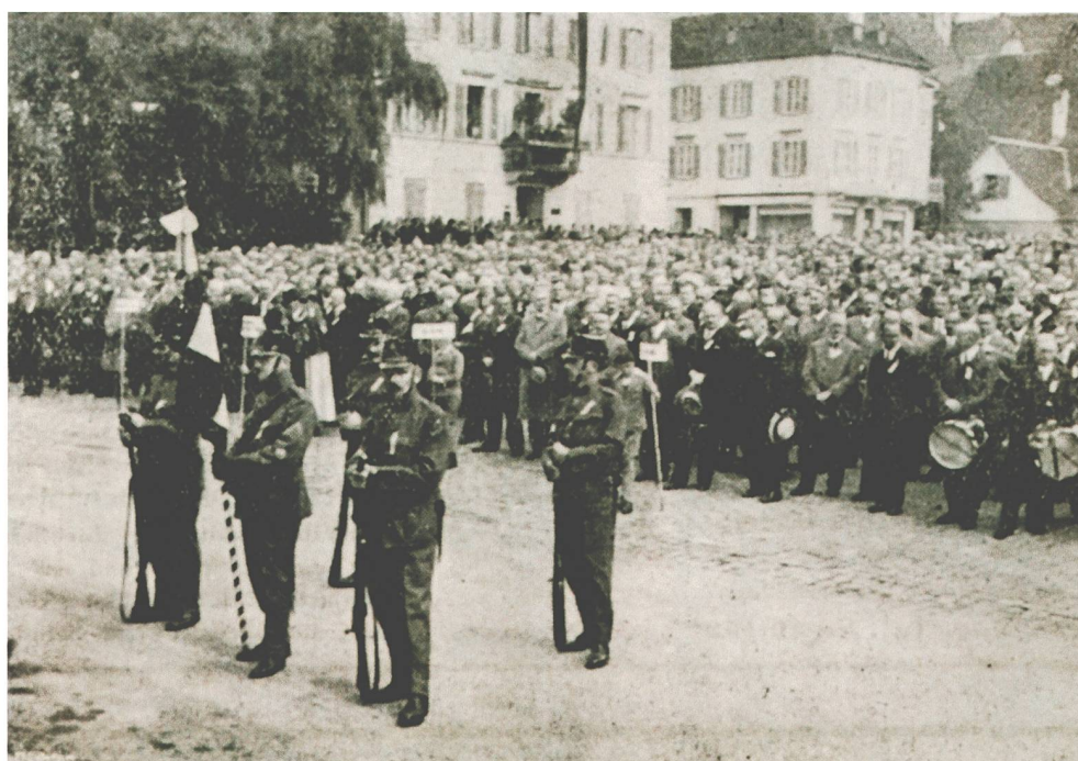
Abb. 2 Der Postplatz in Zug anlässlich des zweiten Zuger Soldatentags am 24. Oktober 1934. Der Verzicht auf den Uniformierungszwang dürfte neben dem kostenlosen Mittagessen dazu beigetragen haben, dass 1934 rund 1400 Personen zur «Grenzbesetzungsfeier» kamen, nicht nur 800 wie zehn Jahre zuvor.