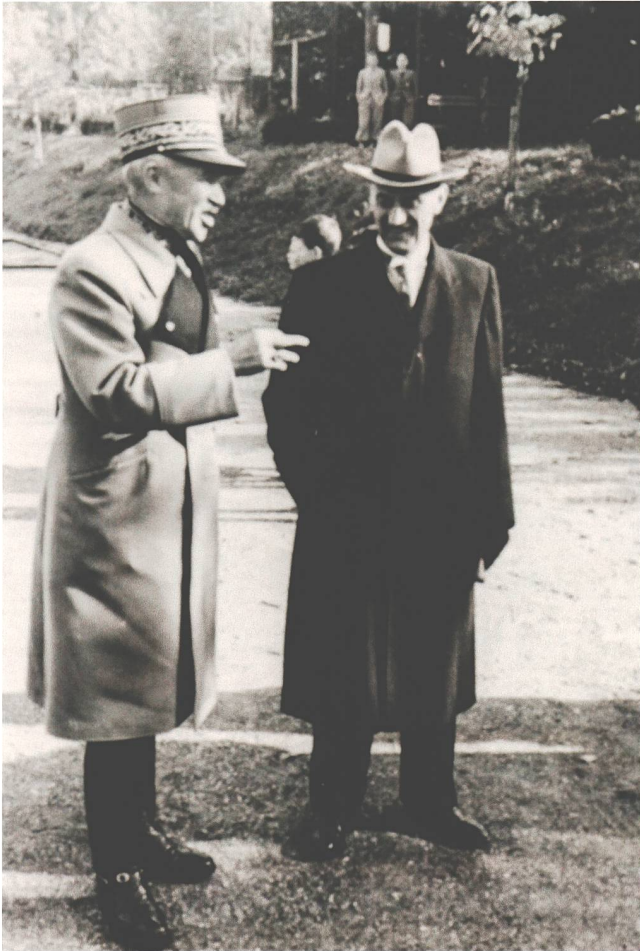
Abb. 12 Der vormalige General Henri Guisan (1874–1960) und der erste Zuger Bundesrat Philipp Etter (1891–1977) anlässlich der Feier zum einhundertjährigen Bestehen der Offiziersgesellschaft des Kantons Zug. Guisan und Etter kam im Festakt die Ehre zu, beim Soldatengrab auf dem Friedhof St. Michael in Zug die «Grabinsignien» Schwert und Helm niederzulegen.