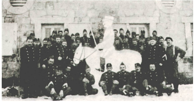
Abb. 3 und 4 Vom «echten Soldatenhumor» wurde in der «Erinnerungsschrift» von 1924 nicht nur erzählt. Er fand seinen Niederschlag auch auf einzelnen Fotografien, beispielsweise unter dem Titel «Der jüngste Landwehr-Offizier» (links) oder «Unser Herr Major» (rechts). Wie es jeweils zur «ergötzlichen Kurzweil» gekommen ist, wird im Bericht des Landwehrbataillons nicht ausgeführt.

mung wird im Bericht von Weiss und den entsprechenden Soldatenbriefen nur selten verwiesen. Dafür ist die Rede von der grossen Kameradschaft, vom soldatischen Humor (Abb. 3 und 4), von Naturspektakeln, von den Freizeitaktivitäten, 57 vom selektiven Engagement bei Präsenz der Vorgesetzten 58 und – vor allem – vom Alkoholkonsum, der Ausdruck kameradschaftlicher Ausgelassenheit sein sollte, aber auch als Indikator für Langeweile oder gar Unbehagen interpretiert werden kann. 59 So berichtete ein Brief vom Dienst in der Leventina: «Auch den wenigen Wirtschaften oder Pintchen statteten wir gelegentlich ein Besüchlein ab und netzten unsere Kehlen mit echtem Südländerblut, mit feurigem Tessiner-Rebensaft. Er war gut und was ebenfalls angenehm war, spottbillig. 20 bis 30 Cts. per Halbliter.» 60