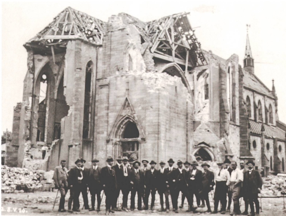
Abb. 5 Vom 7. bis 9. Mai 1920 besuchte eine Gruppe der Offiziersgesellschaft Zug im «Touristenanzug» ehemalige Schlachtfelder im Elsass. Mehrere Teilnehmer schossen dabei Fotografien von militärischen Anlagen, kriegsversehrten Landschaften und Gebäuden sowie posierenden Gruppenmitgliedern. Die Bilder wurden nach der Reise in einem Album gesammelt, das anschliessend unter den Reisenden zirkulierte («Um eine prompte Zirkulation zu erhalten, wollen Sie das Album nicht länger als 1 Tag behalten»). Fotografie von Oskar Arnold, Mai 1920.