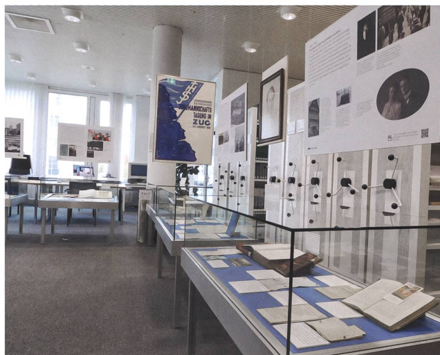
Abb. 3 Die Kabinettausstellung «Der ewige Bundesrat» über Philipp Etter von 2020 umfasste sieben Vitrinen mit Archivalien insbesondere aus dem Staatsarchiv Zug.