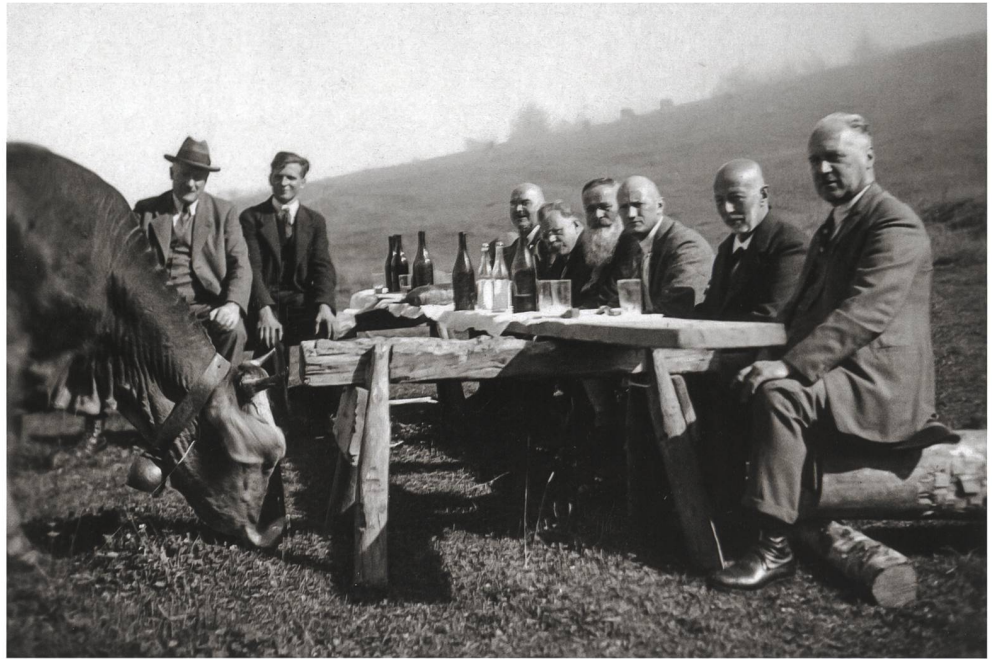
Abb. 10 Mitglieder des Zuger Regierungsrats auf einem Ausflug, um 1930.

1939 gegründeten Kulturstiftung Pro Helvetia? Welche inhaltlichen Schwerpunkte und personellen Netzwerke bestimmten etwa die nationale Forschungsförderung oder die Filmpolitik? Solche Fragen können mit Materialien des Bestandes angegangen werden, stellte doch Etters Innendepartement insbesondere nach 1945 eine wichtige Schaltstelle in diesen Bereichen dar.