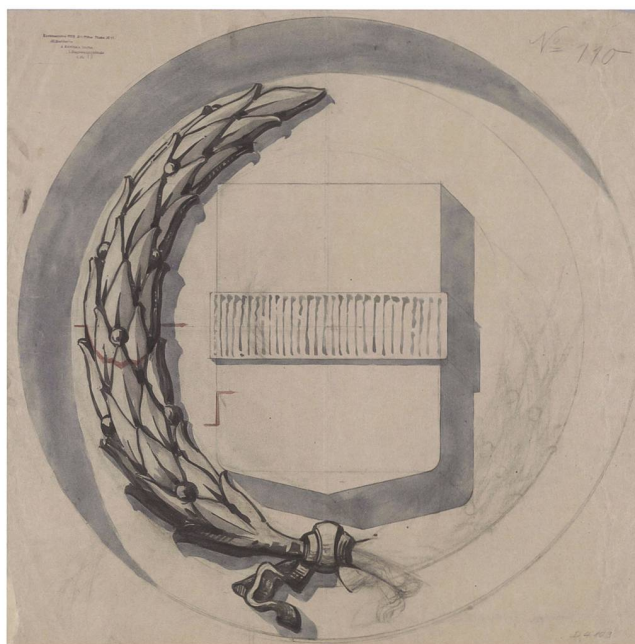
Abb. 1 Sinnbild für die wachsende Zuger Geschichtsschreibung: Detailzeichnung zur Wappenumrahmung für das Regierungsgebäude, 1857–1875.

Das Staatsarchiv Zug ist gemäss Archivgesetz – neben den weiteren öffentlich zugänglichen Archiven auf dem Kantonsgebiet – Zentrum der geschichtlichen Aufarbeitung und eine Stelle, die sich mit der Überlieferungs- und der historischen Bewusstseinsbildung befasst. Indem Unterlagen der Organe der Verwaltung, des Parlaments und der Gerichte so-