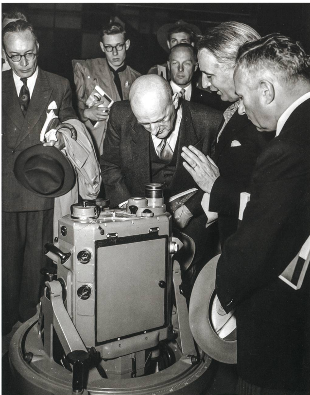
Abb. 7 An der Weltausstellung der Fotografie in Luzern 1952 wird Bundesrat Etter eine Fliegerkamera der Firma Wild aus Heerbrugg über einem Alpenrelief vorgeführt.