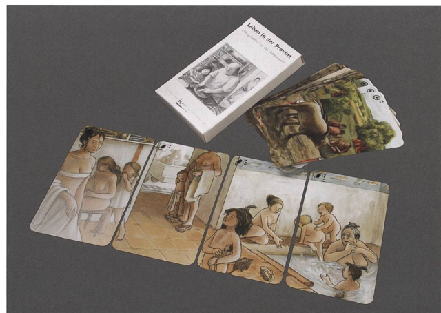
Abb. 6 Bildquartett zur Römerzeit. Badeszene. Lebensbilder: buntherhund Illustration, Zürich.