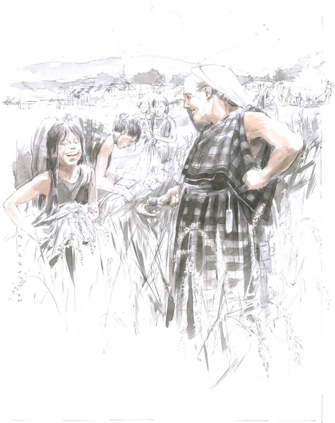
Abb. 4 Frauen und Mädchen bei der Getreideernte. Aquarell aus der Museumsschrift 45. Illustration: Benoît Clarys, Bousval (Belgien).

erstellten Bilder wurden einerseits in der Wanderausstellung «Mercur & Co. – Kult und Religion im römischen Haus» verwendet und dienten andererseits als attraktive Illustrationen des Begleithefts (Abb.3). Im Weiteren setzt das KМУZ Lebensbilder auch in seinen Museumsschriften ein. In «Bronzegeisser und Bronzeschmiede am Zugersee» von Irmgard Bauer und Peter Northover zum Beispiel verleihen die Illustrationen von Benoît Clarys der Broschüre eine ganz besondere