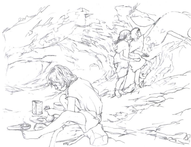
Abb. 2 Das Lebensbild der Sonderausstellung «Löffel» zeigt die Verwendung der löffelförmigen Lampen in einer Höhle. Skizze: buntherhund Illustration, Zürich.

Ein klassisches Beispiel für eine thematische Serie über alle Epochen hinweg ist die Ausstellung «Löffel – In Höhepunkten durch die Kulturgeschichte», die das KMuZ 2006/07