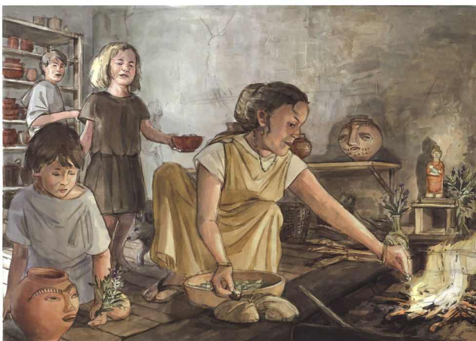
Abb. 3 Kuchenopfer am Herd. Lebensbild aus der Sonderausstellung «Merkur & Co. – Kult und Religion im römischen Haus», auch publiziert in der Begleitschrift. Lebensbild: buntherhund Illustration, Zürich

Die Lebensbilder zum römischen Hauskult sind ein Beispiel aus dem KMuZ für eine Serie, die ein Thema vertieft im Rahmen einer bestimmten Epoche behandelt. Die dazu