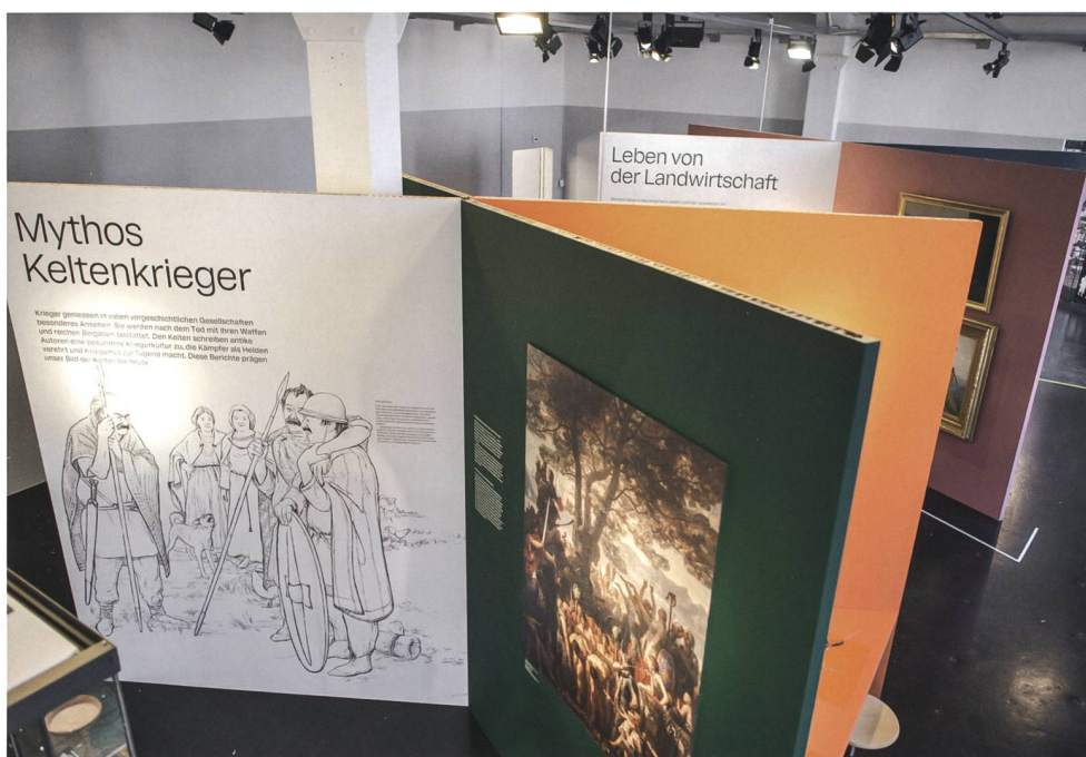
Abb. 1 Sonderausstellung «Bildergeschichten» mit lebens-grossem Lebensbild und histo-rischen Bildern. Lebensbilder: buntherhund Illustration, Zürich.

Mit dem Aufkommen der modernen Forschung im 18. Jahrhundert werden wissenschaftliche Erkenntnisse nicht nur schriftlich festgehalten, sondern immer häufiger mit Illustrationen