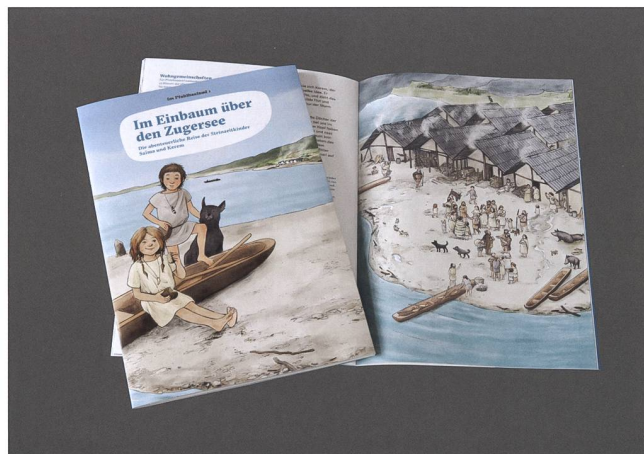
Abb. 5 Front- und Wimmelbild aus der Museumsschrift 49. Lebensbilder: buntherhund Illustration, Zürich.

Schliesslich kann der Wunsch nach einem thematischen Spiel sogar Anlass für die Produktion eines Lebensbilds sein.