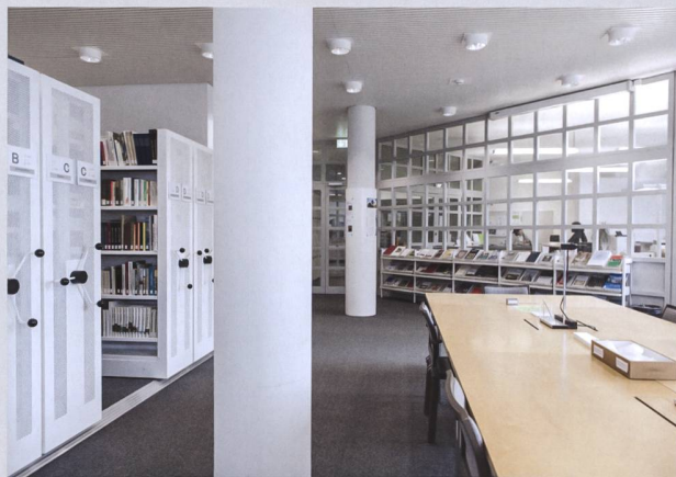
Abb. 7 Blick in den Lesesaal des Staatsarchivs des Kantons Zug.

Insgesamt verbrachten die Forschenden 226 Tage im Lesesaal des Staatsarchivs. Dabei konsultierten sie 2773 Archivalieneinheiten. Die drei Jahre bis Ende 2021 prägte ein intensiver Austausch zwischen den Forschenden und dem Team des Benutzungsdienstes, das eine spezielle Zeit erlebte. Das Thema ging tief, berührte und bewegte. So war es dem Team auch ein grosses Anliegen, dass es zur Aufarbeitung dieser mit viel Unrecht und Schmerz verbundenen Geschichte auf seine Weise beitragen konnte.