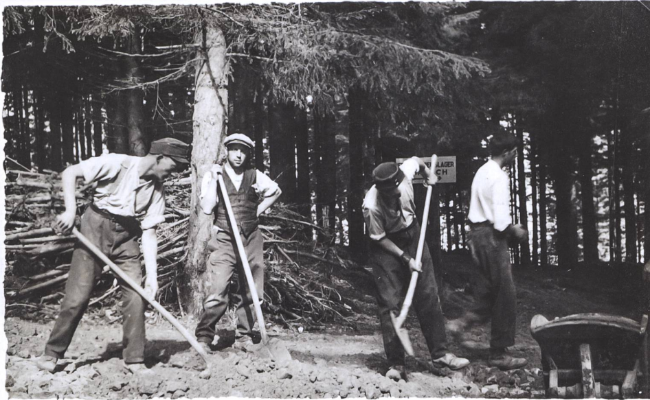
Abb. 10 Vier Männer bei Strassenmeliorationsarbeiten auf dem Zugerberg.

sogenannte «Arbeitsscheue», «Liederliche» oder «Unsittliche», allesamt Zuschreibungen, die eine Wirkungsmacht entfalteten: Auf solche Personen wurde auf Grundlage des 1880 in Kraft getretenen Armengesetzes (abgelöst 1982 vom Sozialhilfegesetz) mittels einer administrativen Versorgung zugegriffen. Gemeinden konnten armengemässige Bürger und Bürgerinnen vorübergehend ins Armenhaus einweisen oder beim Regierungsrat einen Antrag auf die Versorgung in eine Zwangsarbeits- oder Korrekptionsanstalt für bis zu drei Jahren stellen. Teil drei liefert eine Bestandesaufnahme der fürsorgereichen Massnahmen, der genutzten Infrastrukturen sowie der involvierten Trägerschaften und Akteure («versorgen»).