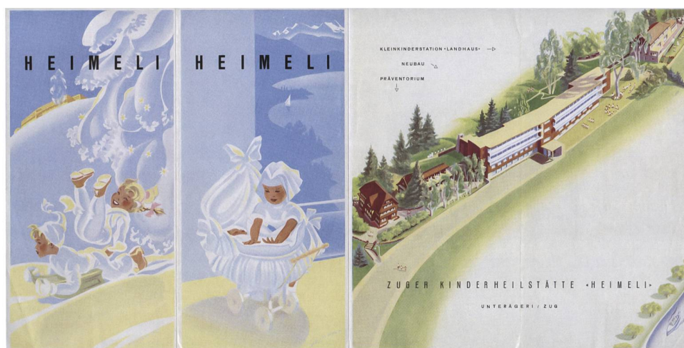
Abb. 2 Prospekt Zuger Kinderheilstätte «Heimeli», ca. 1955. Die Gestaltung des Prospekts übernahm der Zuger Grafiker Martin Peikert (1901–1975).

tionsstelle bei der Aktensuche in den eigenen und in Zusammenarbeit mit zugerischen Einwohner- und Bürgergemeinden oder ausserkantonalen Archiven auch in deren Beständen. 5