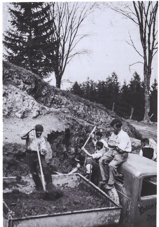
Abb. 8 u. 9 Die Zuger Regierung unterstützte das Gesuch der stadtzugerischen Jungfreisinnigen um Errichtung eines freiwilligen Arbeitslagers auf Horbach, um jungen arbeitslosen Männern durch Beteiligung an einem Strassenkorrektionsprojekt sowie der Errichtung eines Spielplatzes ein Einkommen während der Weltwirtschaftskrise zu ermöglichen. Letzterer war für die Kinder des Ferienheims Horbach Zugerberg, der späteren Waldschule, gedacht (s. Beitrag Sigg, Abb. 28.1–4).