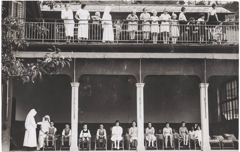
Abb. 3 Kinder und Schwestern auf der Terrasse und der Veranda des «Heimeli».