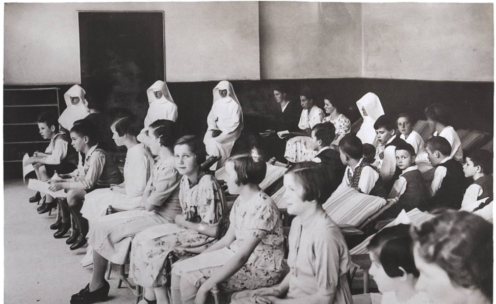
Abb. 4 Innenaufnahme der Veranda mit Liegestühlen.

als Heimleiterinnen, Sozialarbeiter, Erzieherinnen, Vormünder oder Behördenmitglieder beteiligt waren. 16 Insgesamt entstanden 29 leitfadengestützte Interviews, in 14 Fällen handelte es sich um Betroffene fürsorgerischer Massnahmen, in 12 um Beteiligte sowie in 3 um Interviewpartner, die beide Seiten erlebt hatten.