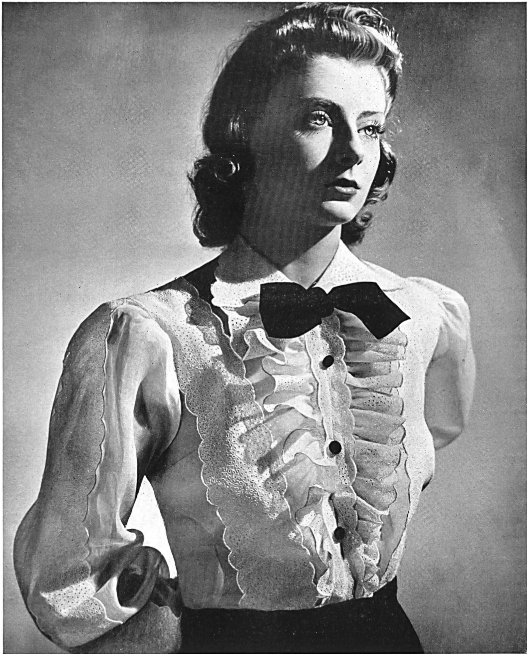
Bluse von Robert Piguet, in glattem und gesticktem Organdi. St. Galler Stickerei.

Die St. Galler Stickerei hat im Auslande einen guten Ruf; man kennt sie an ihrer Qualität und ihrer technischen Vollendung.