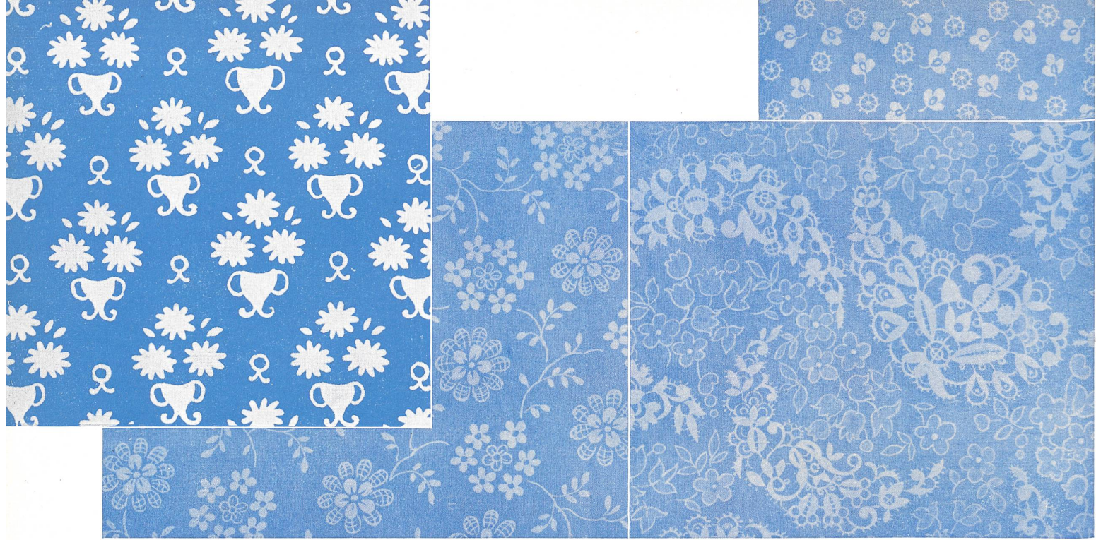
Neue Dessins in Imago-Druck weiss und farbig für die kommende Verkaufssaison. New white and colored designs in Imago-print for the coming season. Nuevos dibujos « Imago », blancos y tintos, para la próxima temporada, Jacob Baenziger A.-G., St. Gallen.