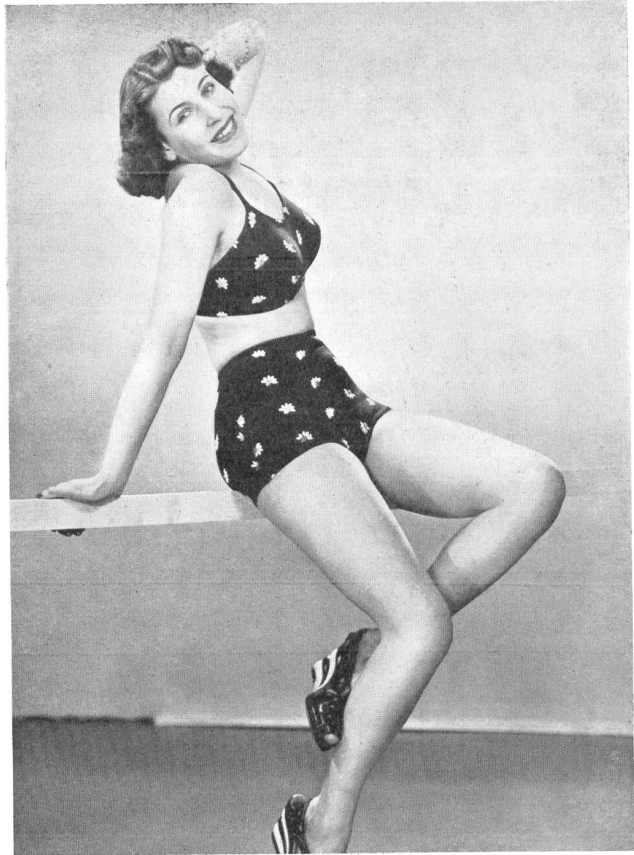
Modelle A. G. vorm. W. Achtnich & Co., Winterthur.