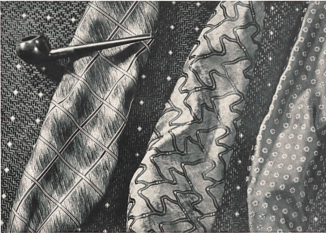
Krawattenstoff — tissus pour cravates — tejidos para corbatas — tessuti per cravatte Robt. Schwarzenbach & Co., Thalwil.

rechts — à droite — a la derecha — a destra