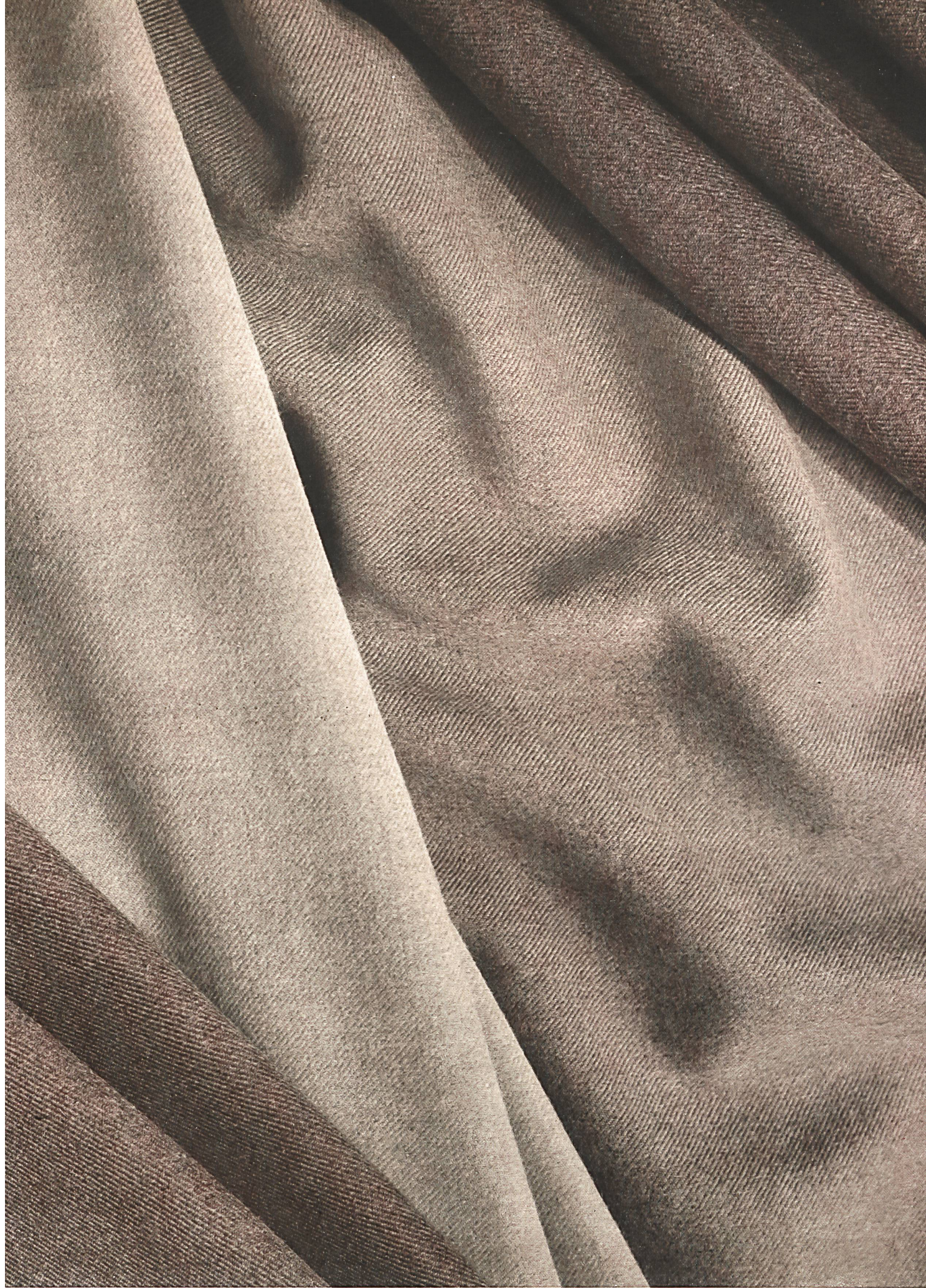
Kammgarn « Tennis » in Mischung 50 % Wolle und 50 % Kunstfaser für Frühjahr 1943.