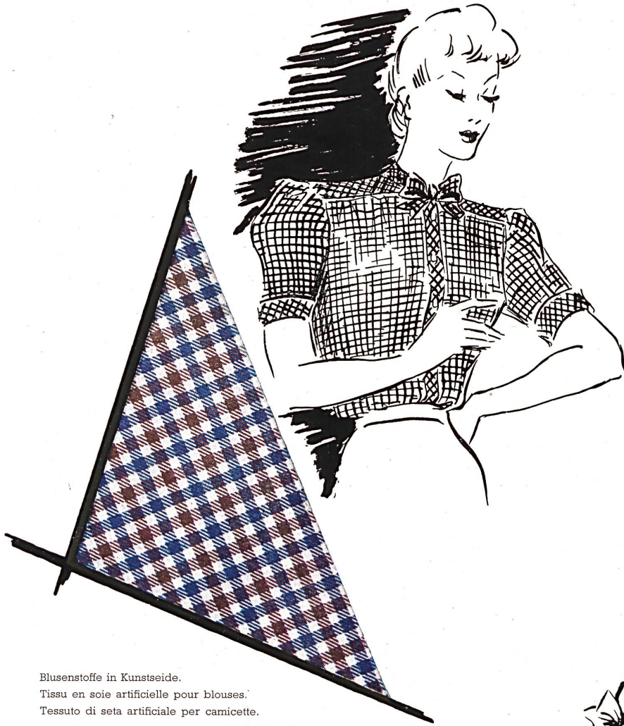
Blusenstoffe in Kunstseide. Tissu en soie artificielle pour blouses. Tessuto di seta artificiale per camicette.

Der Zellwollstoff mit grossem Dessin für Jupes, der auf dem Umschlag dieser Nummer zu sehen ist, stammt von der Firma Bosshard-Bühler & Co. A.-G., in Wetzikon.