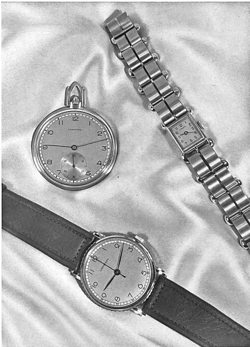
Compagnie des Montres Longines, Francillon S.A., St-Imier.