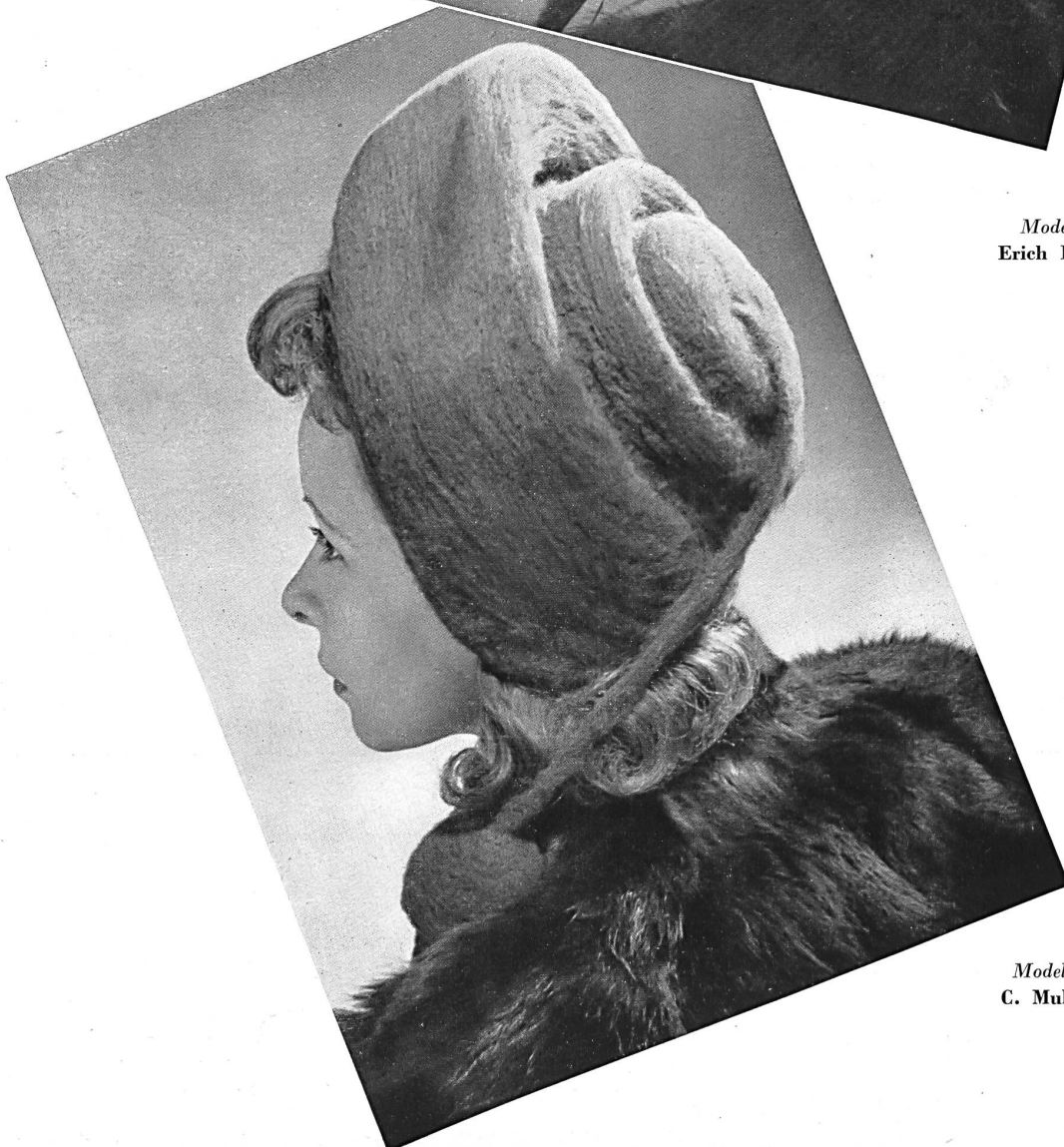
Modell Modèle C. Muller S.A., Zurich.