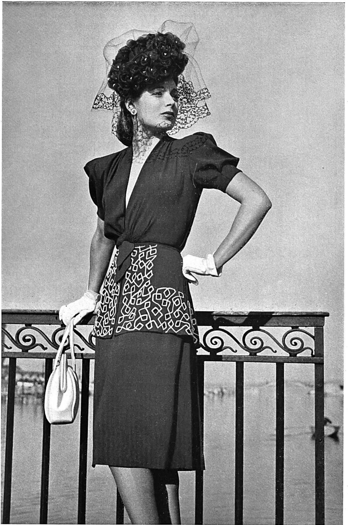
Seidenstoffwebereien vorm. Gebr. Näf A.-G., Zürich. Crêpe « Evelyne » Kunstseide. Modell Léon Fischer.