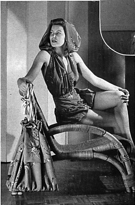
Rudolf Brauchbar & Co., Zürich. Crêpe « Turango » Zellwolle bedruckt. Modell Scheidegger-Mosimann.