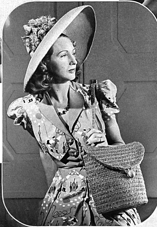
Stoffel & Co., St. Gallen. « Cretesto » Zellwolle bedruckt. Otto Steinmann & Co. A.-G., Wohlen. Hut- und Taschen- geflechte. Modelle I. und R. Polla.