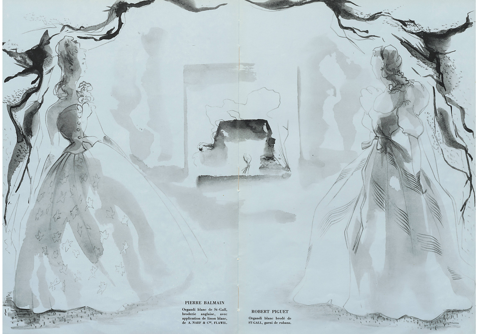
PIERRE BALMAIN Organdi blanc de St-Gall, broderie anglaise, avec application de linon blanc, de A. NAEP & C o , FLAWIL.