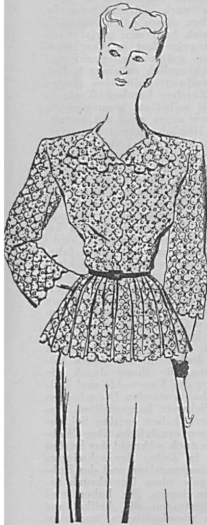
Casaque aus schweizerischer Aetzspitze getragen über einem schwarzen Kunstseidenen Jersey-Jupe.