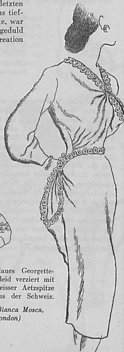
Blaues Georgette-Kleid verziert mit weisser Aetzspitze aus der Schweiz.