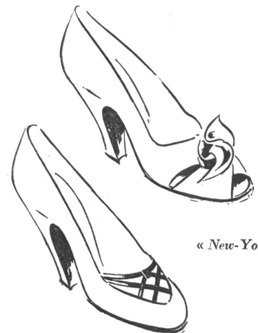
« New-York »