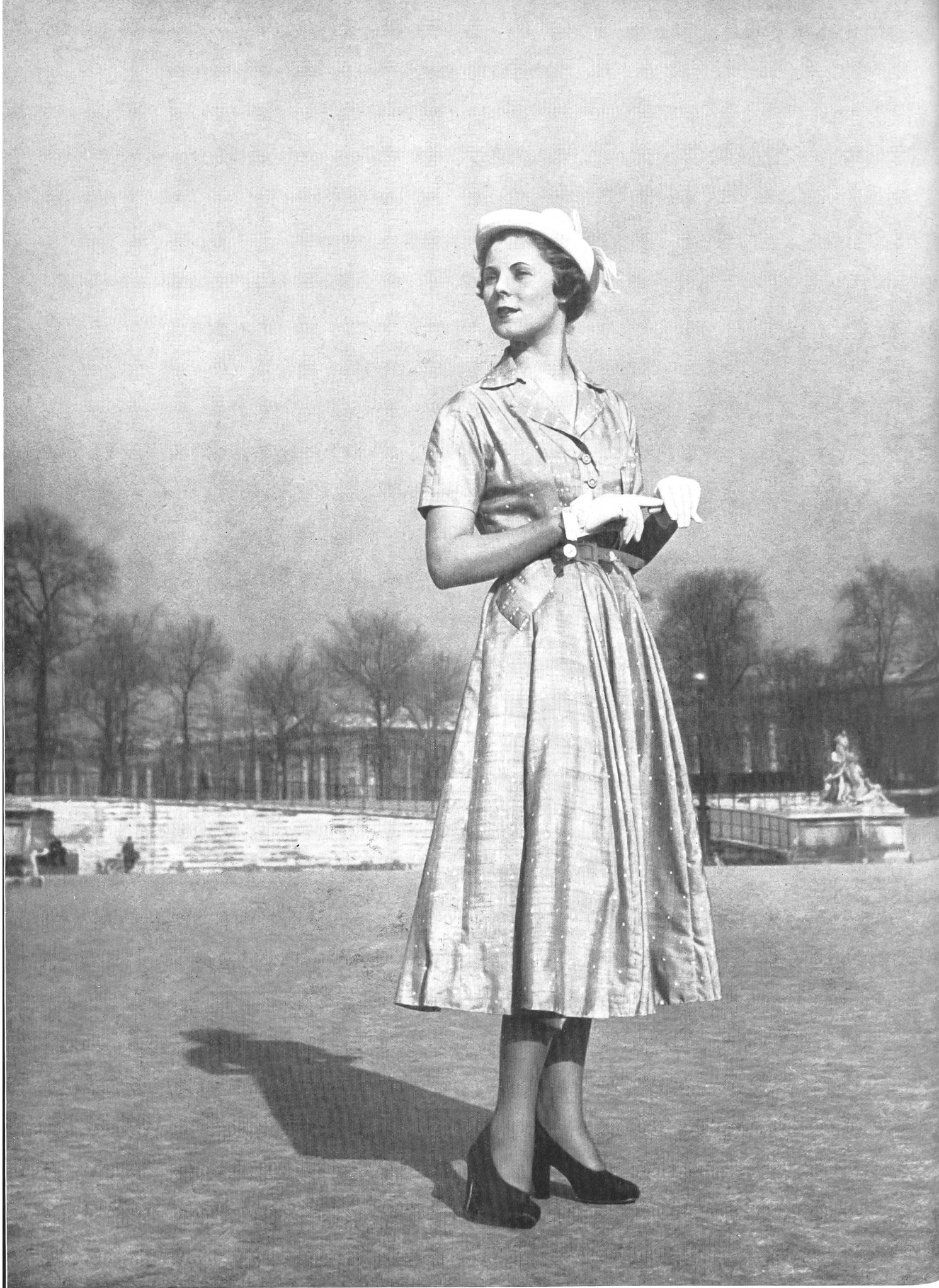
JACQUES HEIM L. Abraham & Cie, Soieries S.A., Zurich