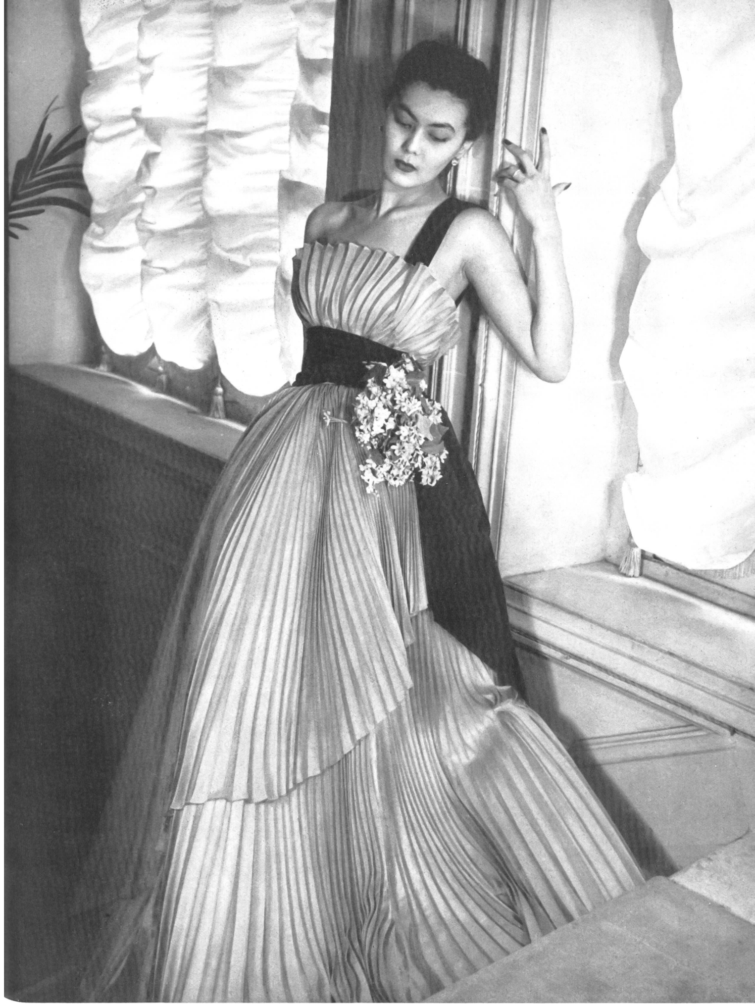
CHRISTIAN DIOR Emar S.A., Zurich INAMO, ZURICH