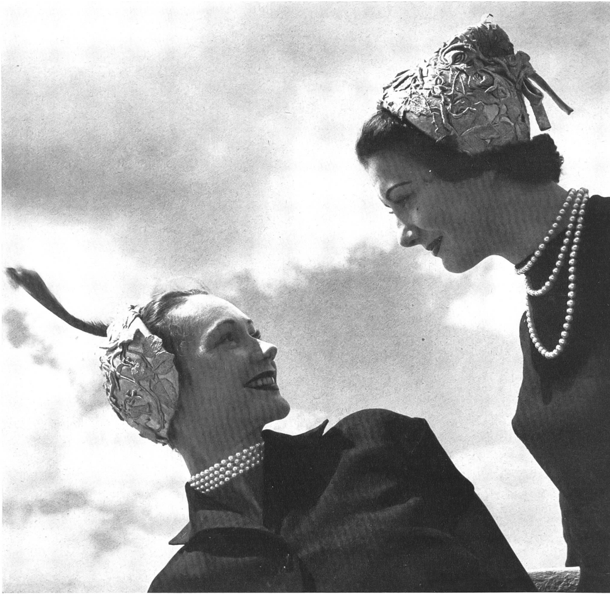
LEGROUX SOEURS Forster Willi & Cie, St-Gall INAMO, ZURICH