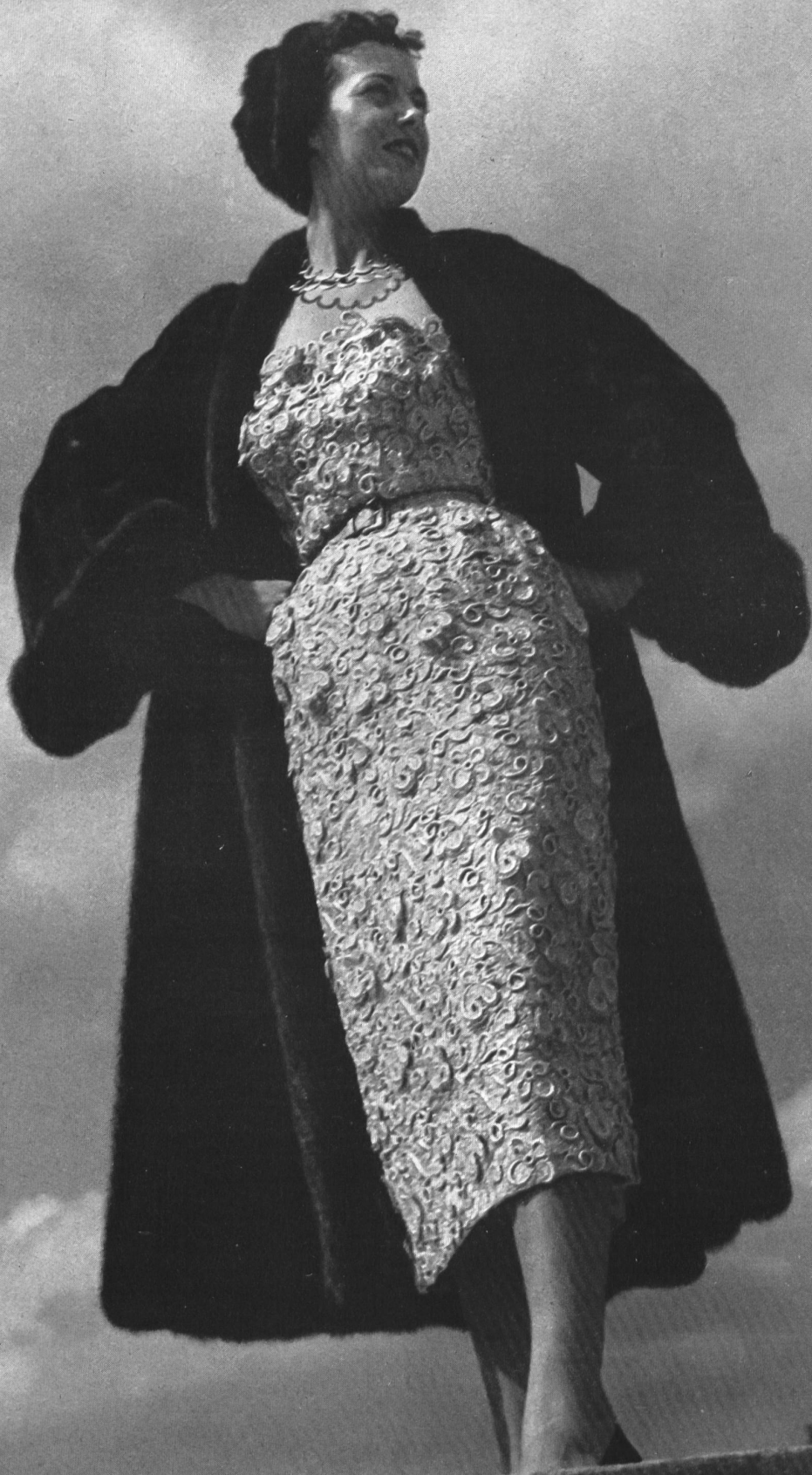
CHRISTIAN DIOR Forster Willi & Cie, St-Gall INAMO, ZURICH