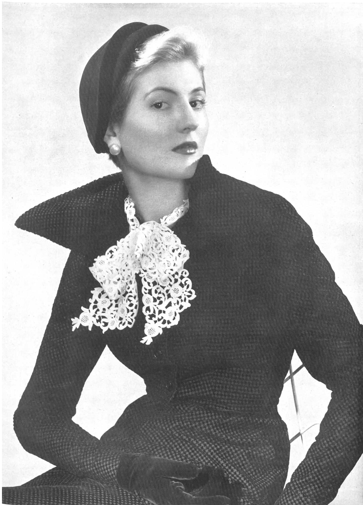
JACQUES FATH Union S. A., St-Gall PIERRE BRIVET FILS, PARIS