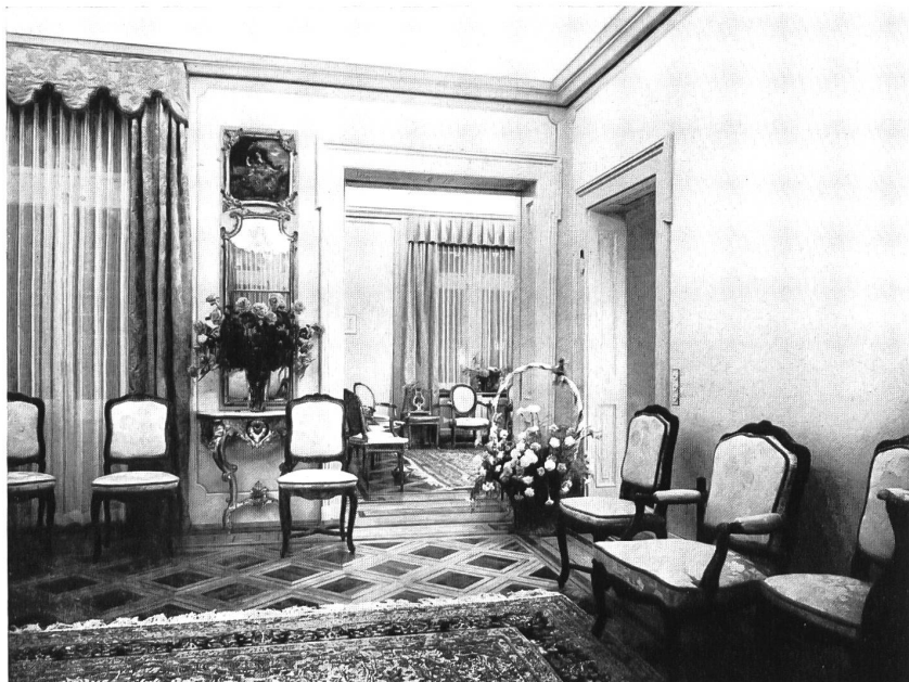
Salon Régence, au fond salon Louis XVI.

Jean Dessès, der die Asymetrie in den Vordergrund stellt, sie seiner Phantasie unterwirft und uns seine einzigartige Schulterlinie bringt ; die « ligne coquille » von Jeanne Lanvin, mit ihren gegen vorne eingeschlagenen Bewegungen und, in der Tradition dieses Hauses, die Spitzen. Bei Jean Patou, der gerne mit der perlgrauen Farbe, mit Rubin und Onyx spielt, lassen wir uns von der grossen und glücklich ausgewogenen jugendlichen Richtung und durch eine nicht weniger grosse Vornehmheit begeistern.