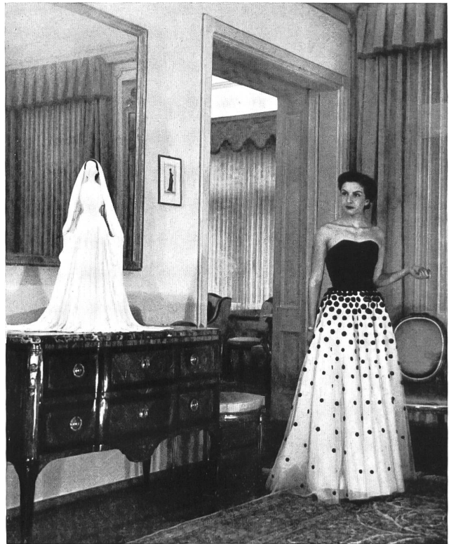
Un modèle Bruyère.