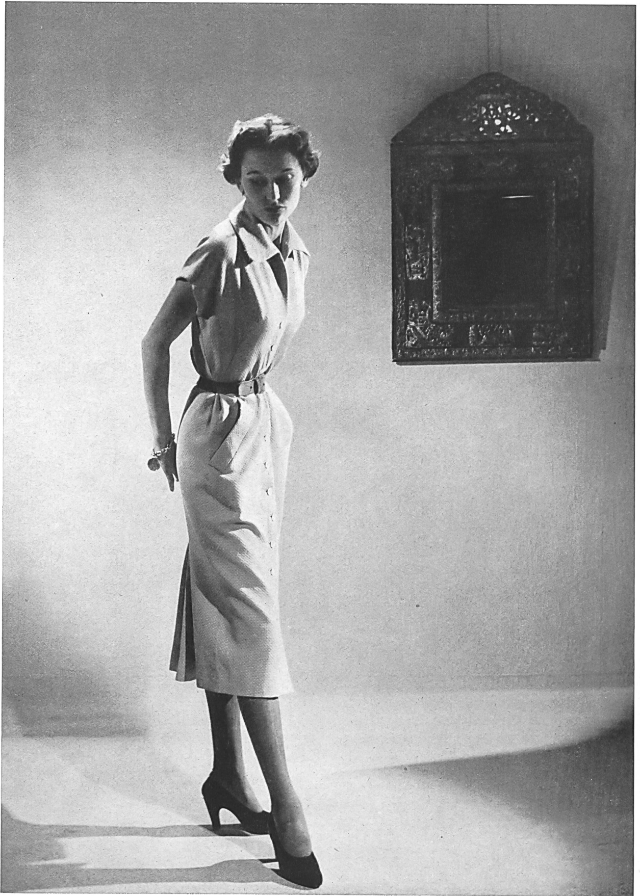
CHRISTIAN DIOR Stoffel & Cie, St-Gall INAMO, ZURICH