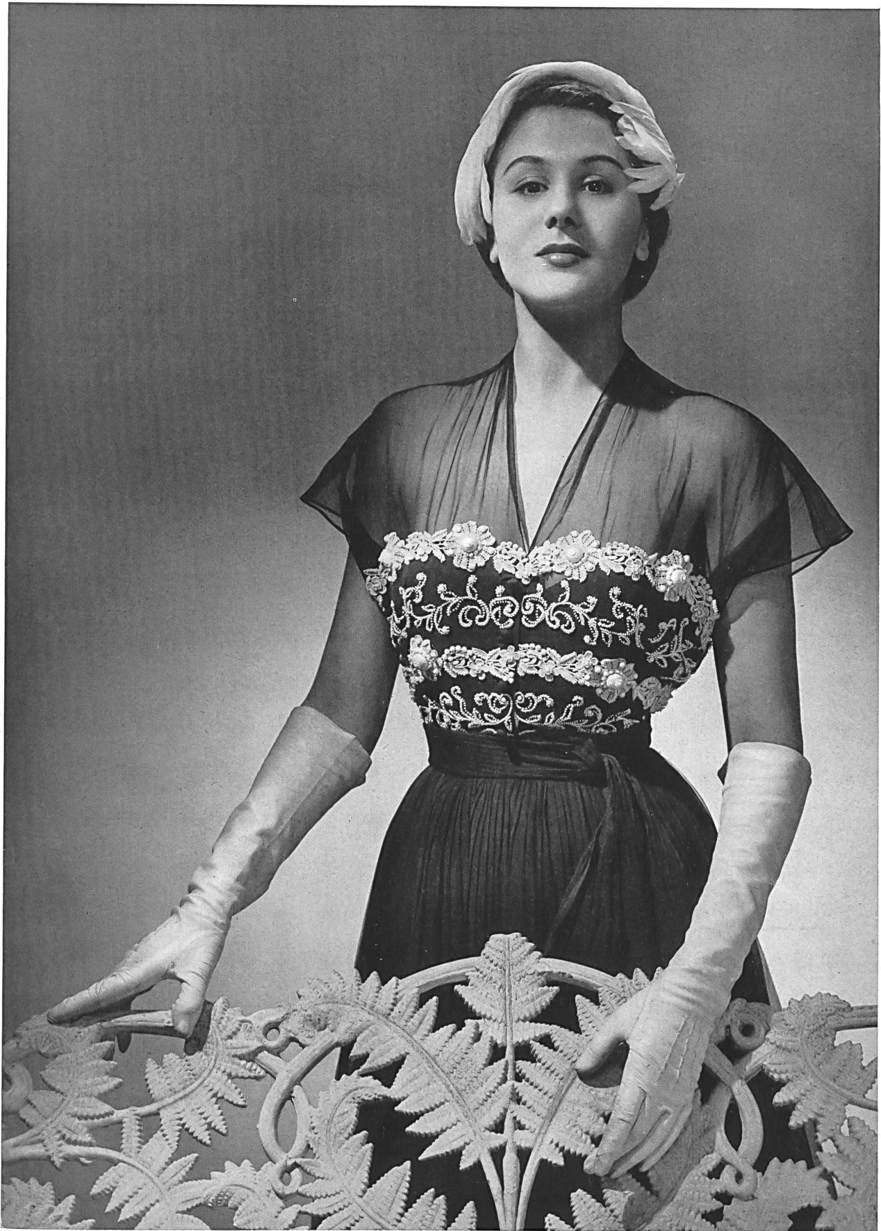
MARCEL ROCHAS Union S.A., St-Gall THIÉBAUT-ADAM, PARIS