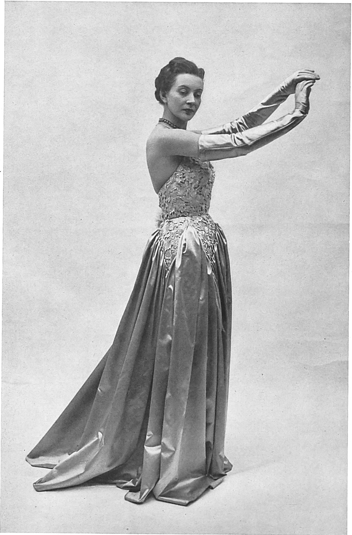
MOLYNEUX A. Naef & Cie, Flawil INAMO, ZURICH