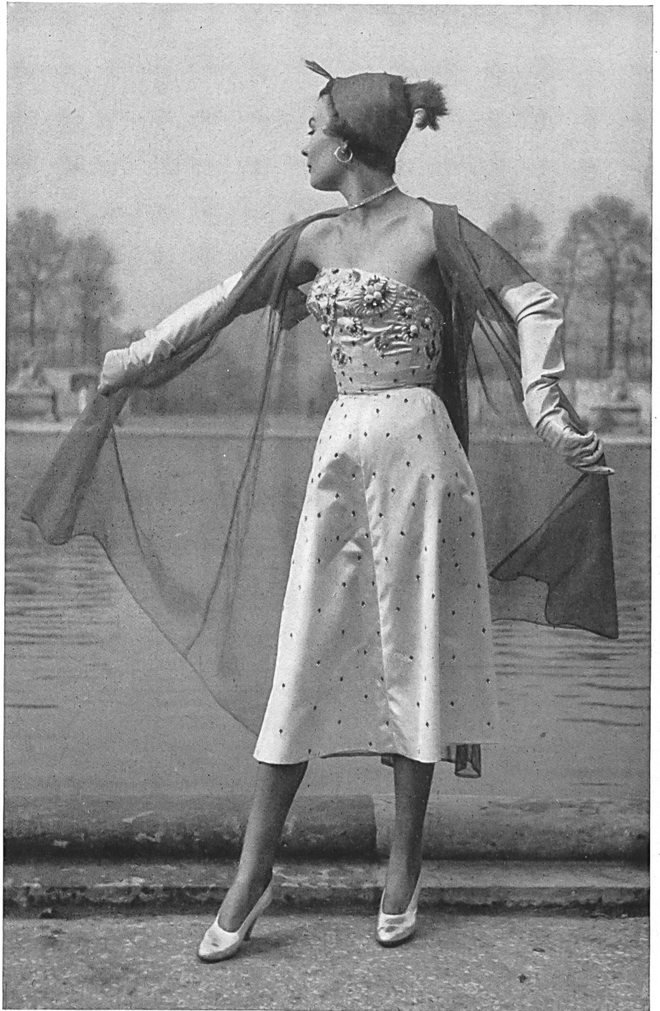
JACQUES FATH Union S.A., St-Gall PIERRE BRIVET FILS, PARIS