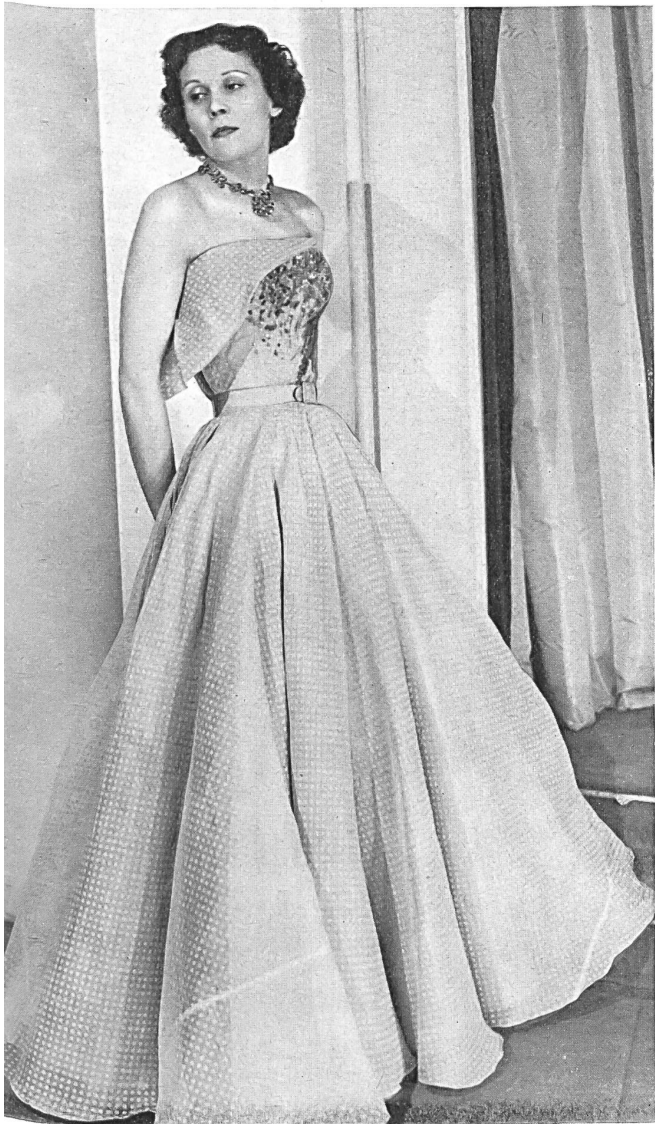
NINA RICCI Union S. A., St-Gall PIERRE BRIVET FILS, PARIS