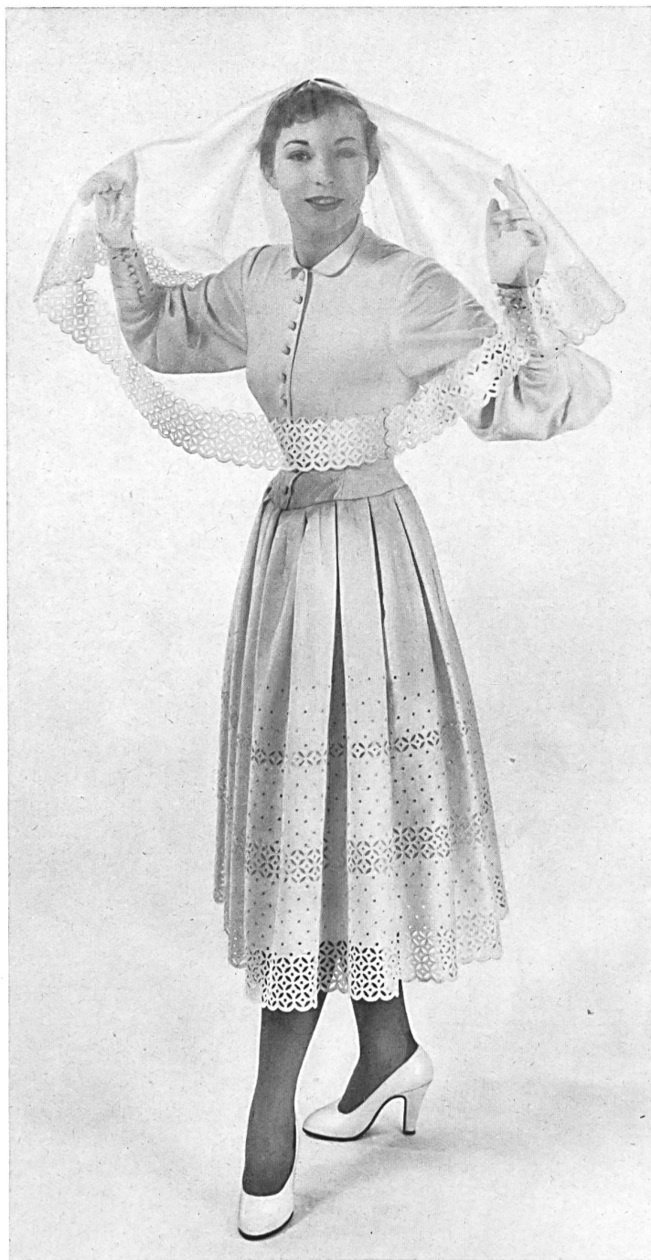
MARCEL ROCHAS Union S.A., St-Gall THIÉBAUT-ADAM, PARIS