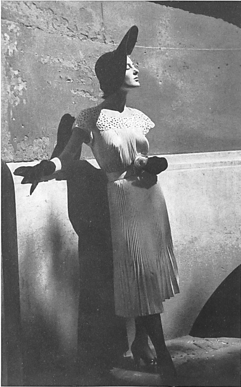
TRISTAN MAURICE Walter Schrank & Cie, St-Gall THIÉBAUT-ADAM, PARIS