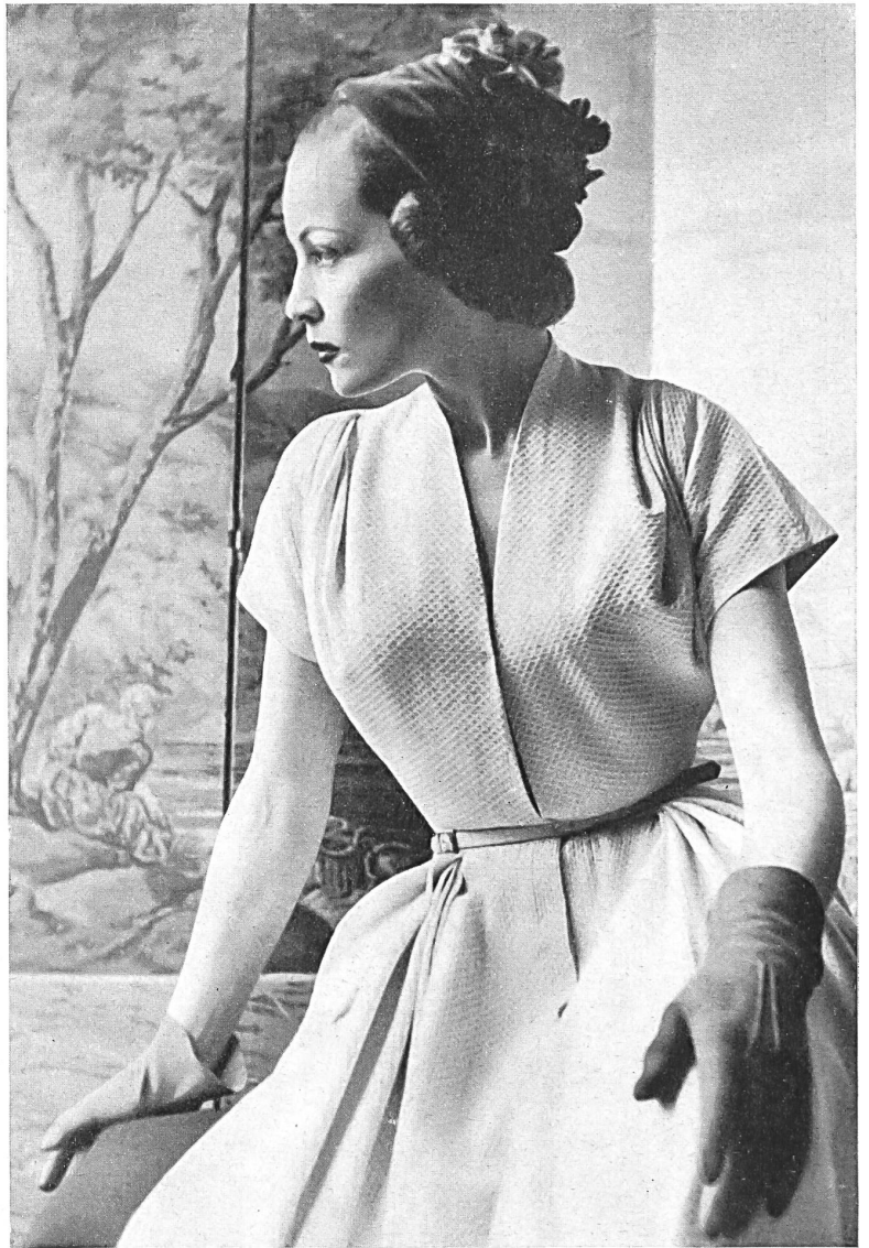
MANGUIN Stoffel & Cie, St-Gall INAMO, ZURICH