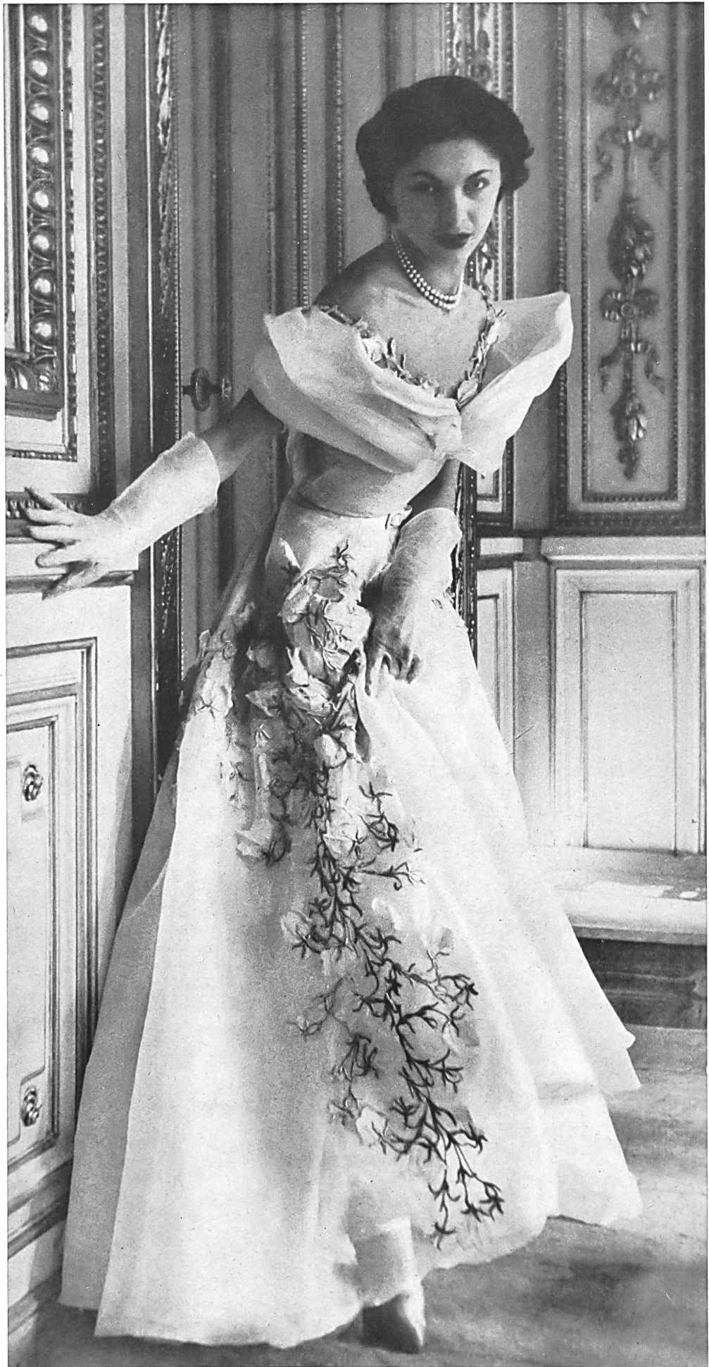
JEAN DESSÈS Forster Willi & Cie, St-Gall INAMO, ZURICH