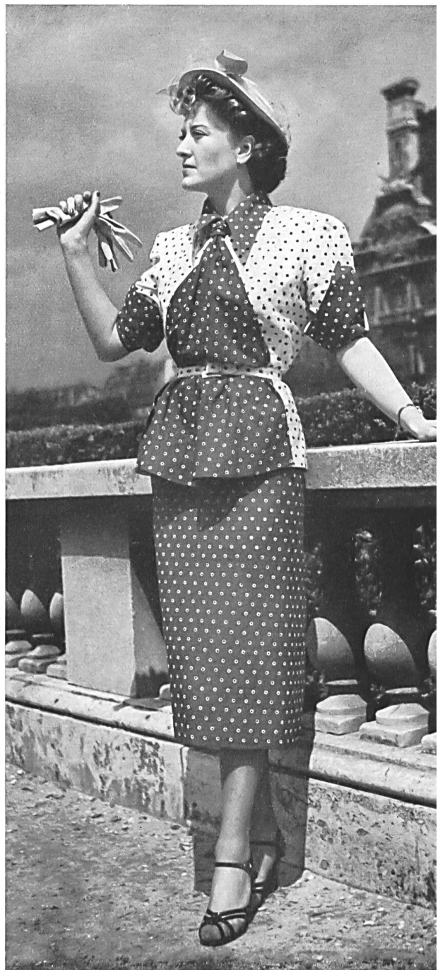
MARTIAL ET ARMAND Reichenbach & Co., St-Gall THIÉBAUT-ADAM, PARIS