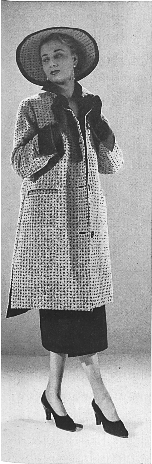
CHRISTIAN DIOR A. Naef & Cie, Flawil INAMO, ZURICH