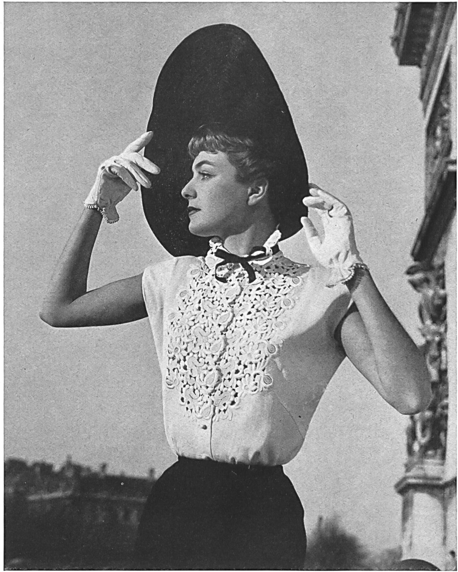
JACQUES FATH Walter Stark, St-Gall MONTEX, PARIS