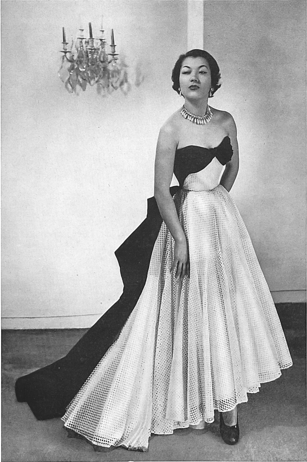
NINA RICCI J. G. Nef & Cie, Hérisau M. GUITRY, PARIS