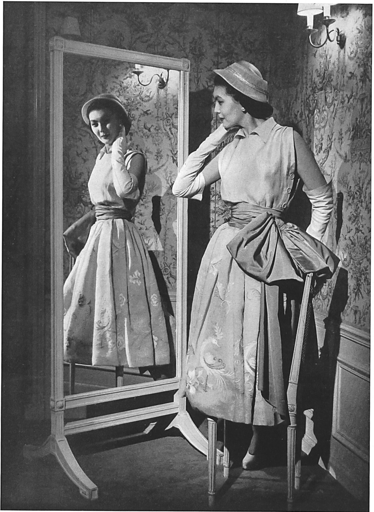
CHRISTIAN DIOR Forster Willi & Cie, St-Gall INAMO, ZURICH