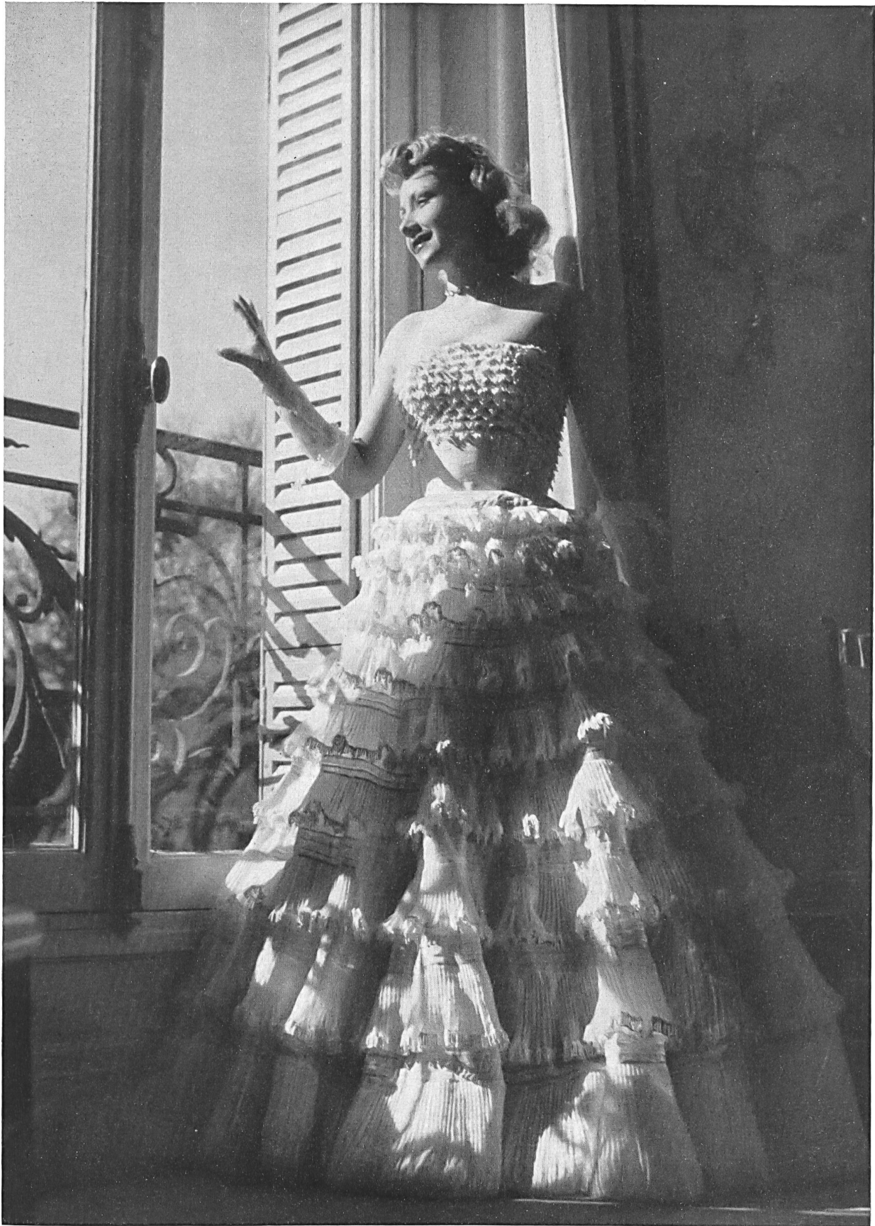
CARVEN Union S. A., St-Gall PIERRE BRIVET FILS, PARIS