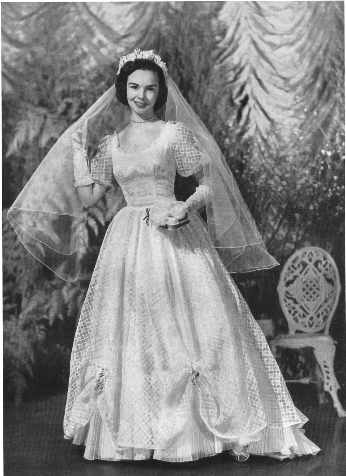
SWISS FABRIC GROUP, NEW YORK A wedding gown in a wonderful sheer novelty Swiss cotton by Ruth For- mals.

Im Waldorf Astoria in New York fand dieses Frühjahr eine beachtenswerte, von der « Swiss Fabric Group » organisierte « Fashion Show » statt, an welcher den Vertretern der amerikanischen Presse und den Leitern von Konfektionshäusern eine Serie ausschliesslich aus schweizerischen Stoffen und Stickereien hergestellter Kleider, Blusen und Wäschestücke vorgeführt wurde.