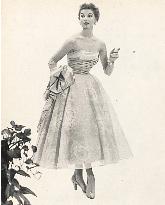
Kiviette, New York «Recoflock» flockprinted organdy by Reichenbach & Co., St.Gall