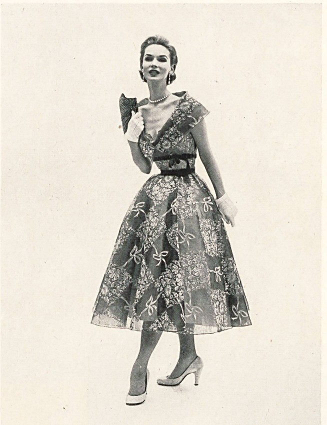
Kiviette, New York «Recoflock» flockprinted organdy by Reichenbach & Co., St.Gall