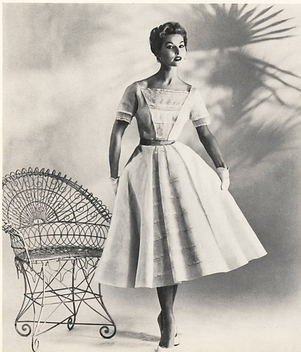
Jane Derby Inc. White Swiss organdy by Stoffel & Co., St.Gall

Dieses Jahr fand die elfte jährliche Schau der Swiss Fabric Group am 9. Februar im Hotel Pierre in New York statt. In unserer nächsten Nummer werden wir einen durch zahlreiche Photos ergänzten Bericht unserer New Yorker Korrespondentin über diese Veranstaltung veröffentlichen. Als Vorschau können wir jedoch schon heute einige erste Bilder bringen, die wir soeben aus New York erhalten haben.