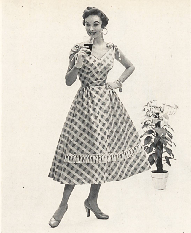
Tina Leser «Nelo-Clariosa» silky pure cotton fancy twill in soft pastel shades by J. G. Nef & Co., Herisau