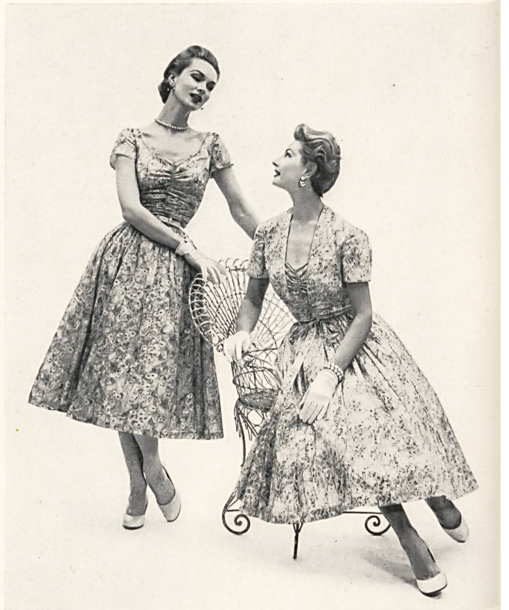
Fair Child Frocks, New York Everflat organdy by Taco Ltd., Zurich