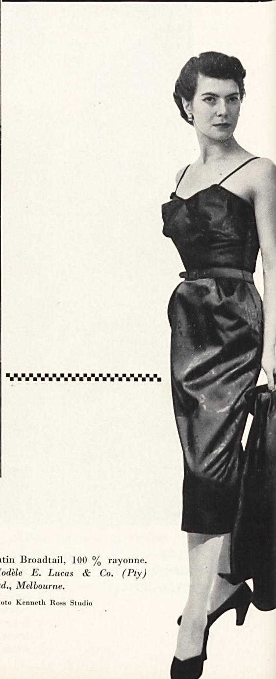
Satin Broadtail, 100 % rayonne. Modèle E. Lucas & Co. (Pty) Ltd., Melbourne.