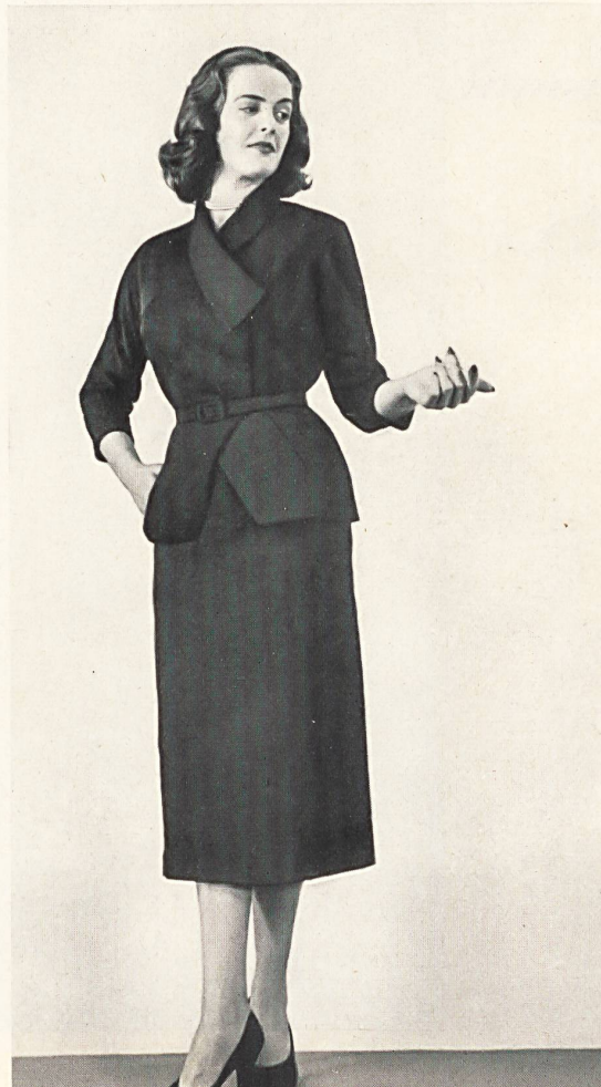
HEER & CIE S. A., THALWIL