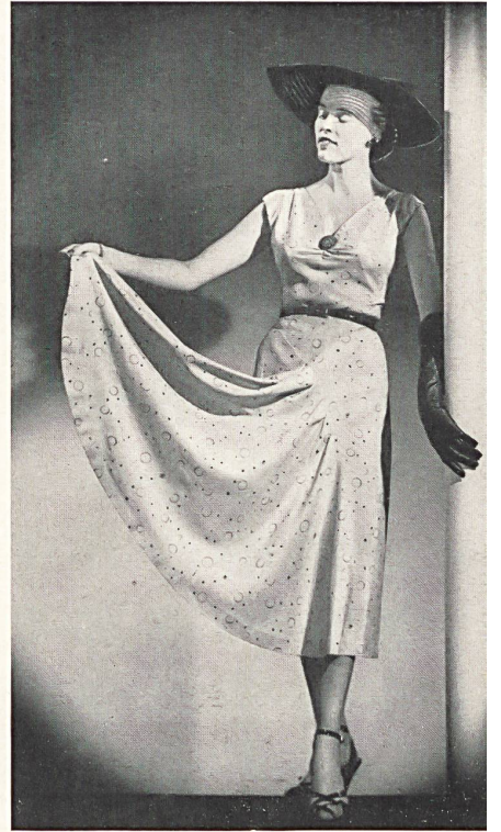
Matelassé façonné lamé. Modèle Molstad & Co., Oslo.