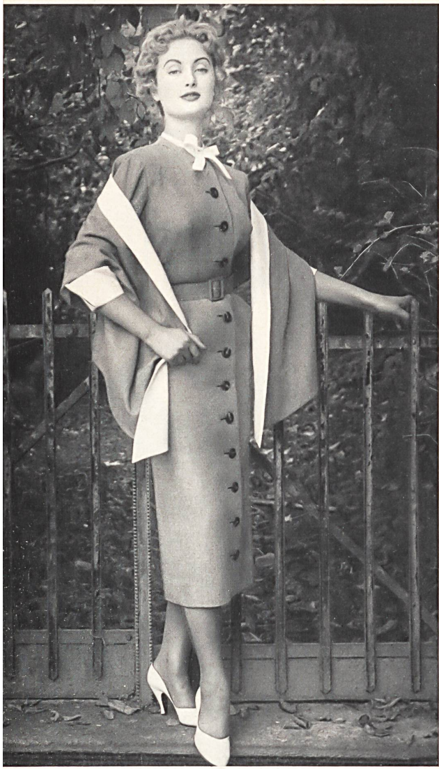
Tweed Belrobe fibranne. Modèle R. Cafader & Cie, Zurich.