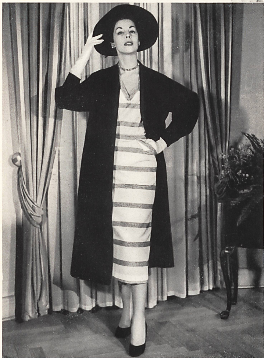
Bouclé Sport, 100 % rayonne. Modèle Bengtsons Konfektions A. B., Stockholm.