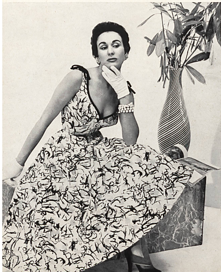
Piqué de coton imprimé. Modèle Patric of Miss America, New-York.