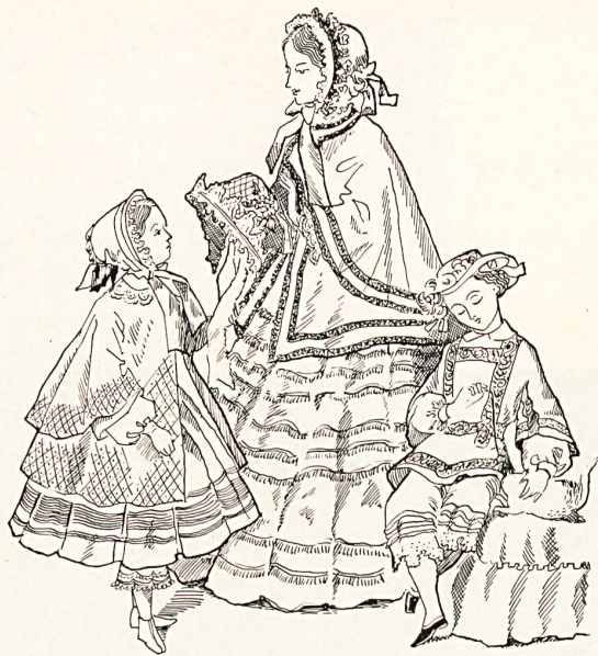
Damen- und Kindermode vor 100 Jahren.