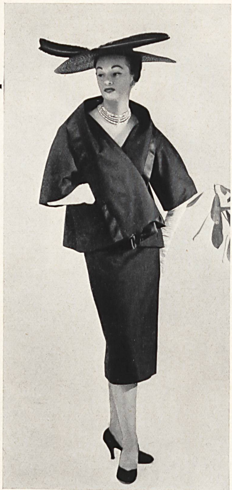
Faille tussah. Modèle Pierre Balmain, New-York.