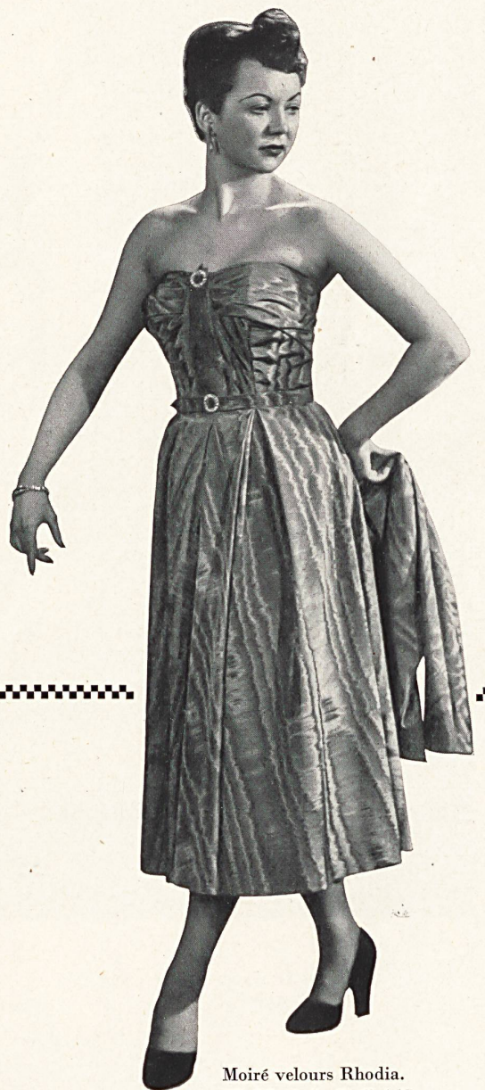
Moiré velours Rhodia. Modèle O. L. Hoff A/S, Oslo.