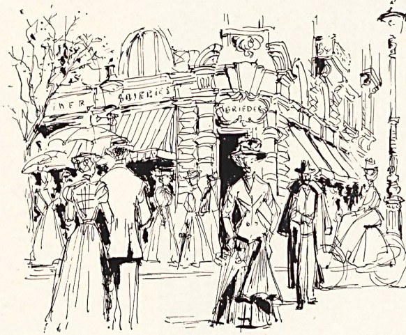
Seiden-Grieder — Ecke Börsenstrasse/Bahnhofstrasse 1903-1913.