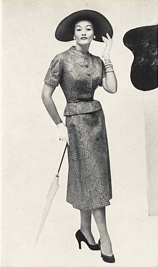
Twill de coton imprimé. Modèle Hattie Carnegie, New-York.