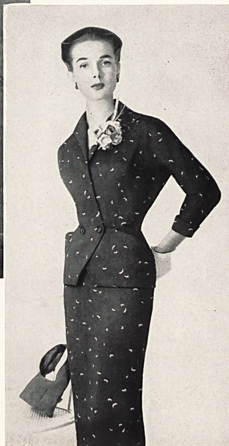
Faille Monaco. Modèle Julius Hoffmann, Zurich. Photo Hoenig