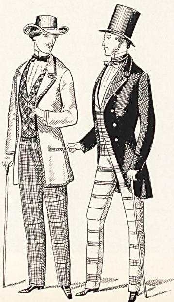
Elegante Herren anno 1854, zur Zeit der Gründung der Zürcherischen Seidenindustrie Gesellschaft.