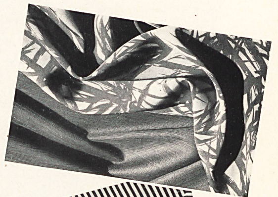
Armure élégante reine Seide. Crêpe Marlène imprimé reine Seide.

aus den mit Sachkenntnis und Liebe zum edlen Material zusammengestellten Sortimenten, was ihr Herz erfreut. Sie wählen aus Hunderten von Qualitäten, aus Tausenden von Farben, und verbreiten so stets aufs neue in aller Welt den Ruf der Grieder-Seide... der Zürcher Seide.