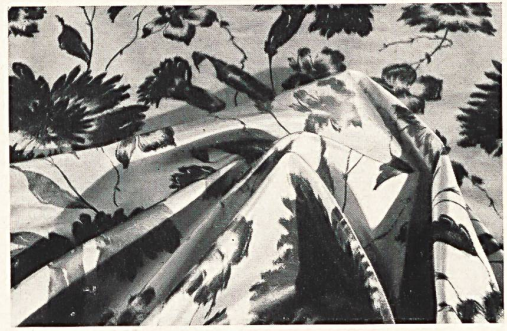
Taffetas chiné reine Seide.

bewussten Bürgertums. So wurde Grieders Seidengeschäft zunächst an der Fraumünsterstrasse, dann an der Börsenstrasse und seit 1913 im stolzen Grieder-Haus am Paradeplatz zum Treffpunkt kultivierter Menschen aus aller Herren Länder. Sie wählten — und wählen noch heute —