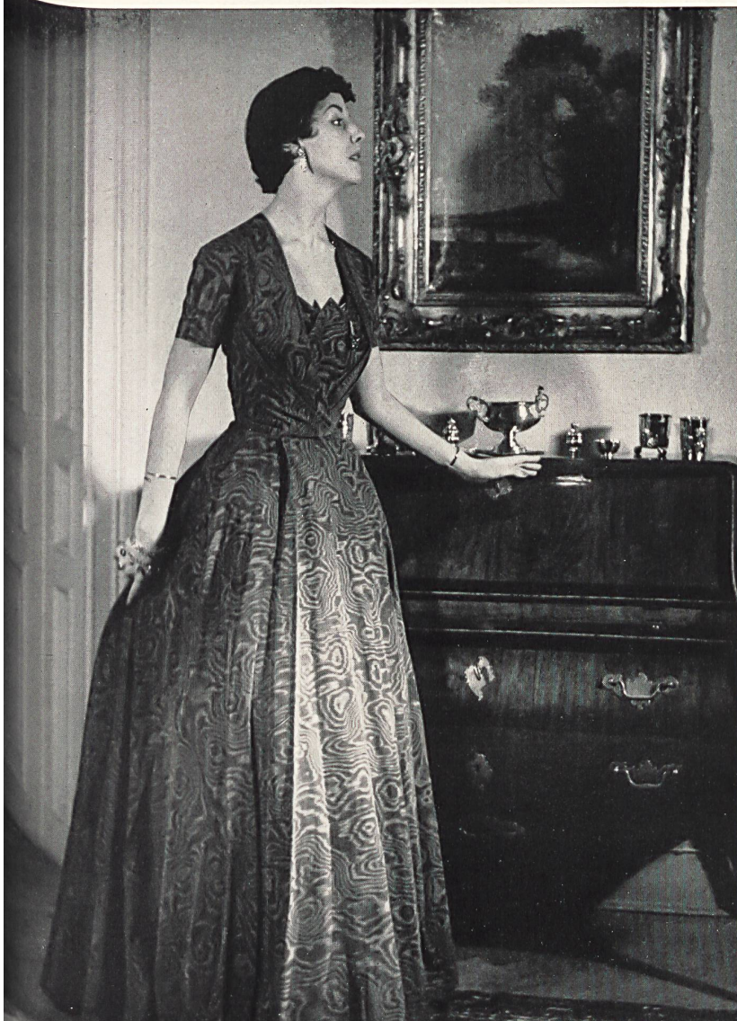
Moiré Galoche Rhodia. Modèle Bengtsons Konfektions AB, Stockholm.