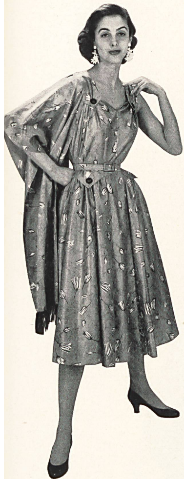
Satin coton Casablanca. Modèle Felix S. Meyerstein, Zurich.