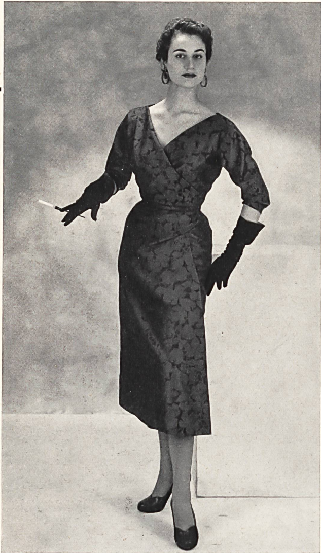
Shantung noppé imprimé. Modèle Hugo Brandeis S. A., Zurich.