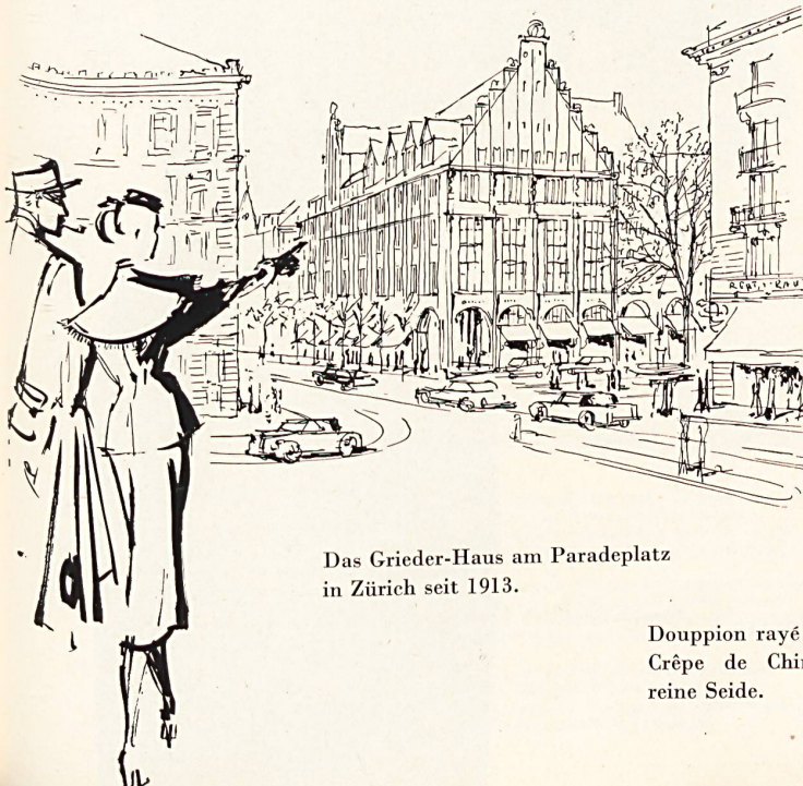
Das Grieder-Haus am Paradeplatz in Zürich seit 1913.