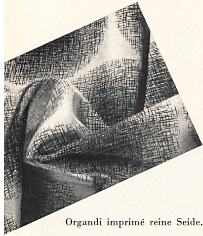
Organdi imprimé reine Seide.