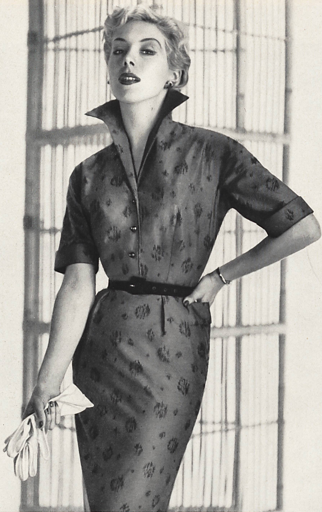
Coton Jacquard, finissage soyeux. Modèle Atrima, Londres.