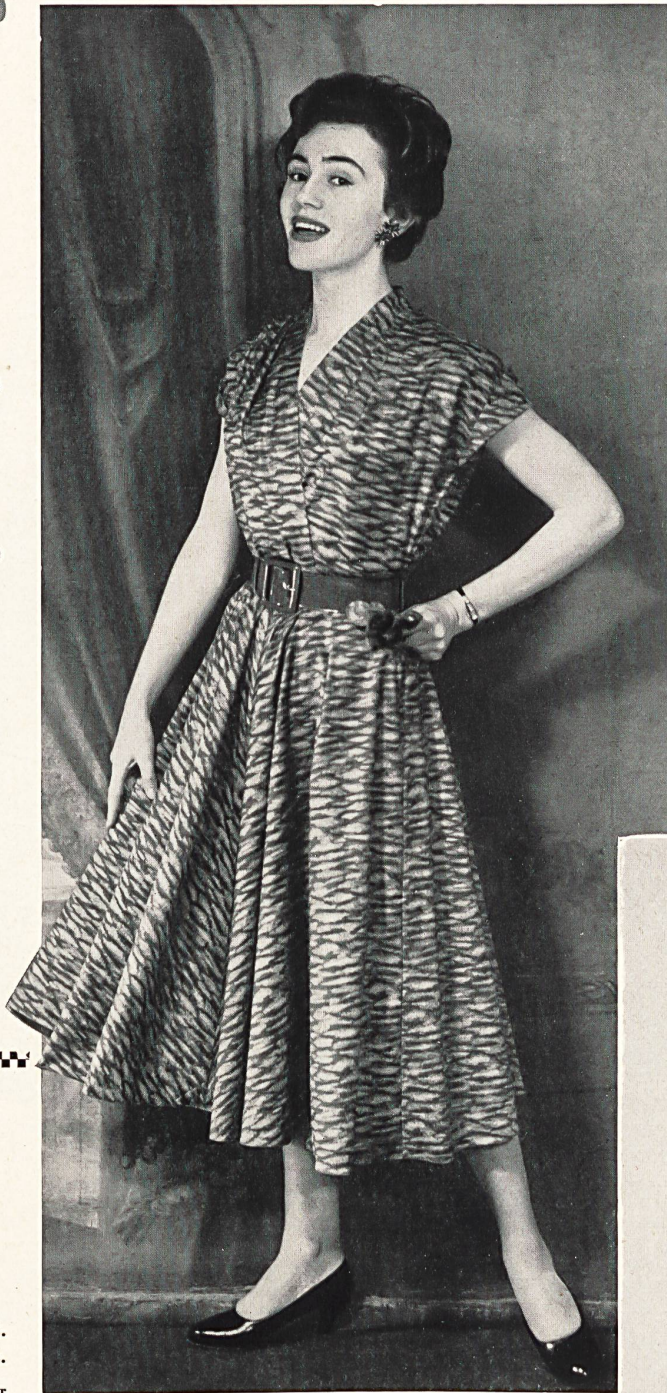
Coton « bégé » infroissable. Modèle Weko, Zurich.