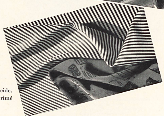
Douppion rayé reine Seide. Crêpe de Chine imprimé reine Seide.