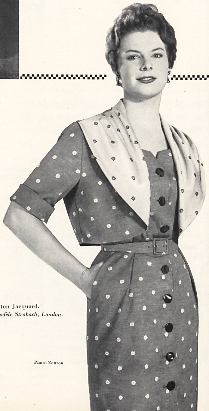
Coton Jacquard. Modèle Strobach, London.