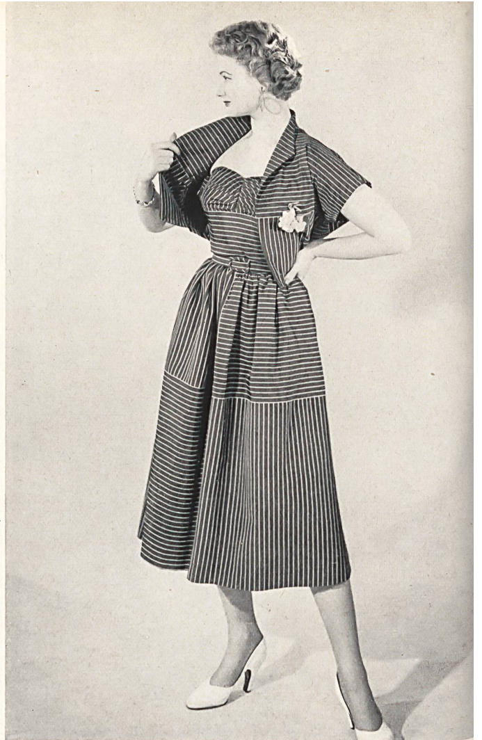
Reps rayé. Modèle Yvel S. A., Zurich.