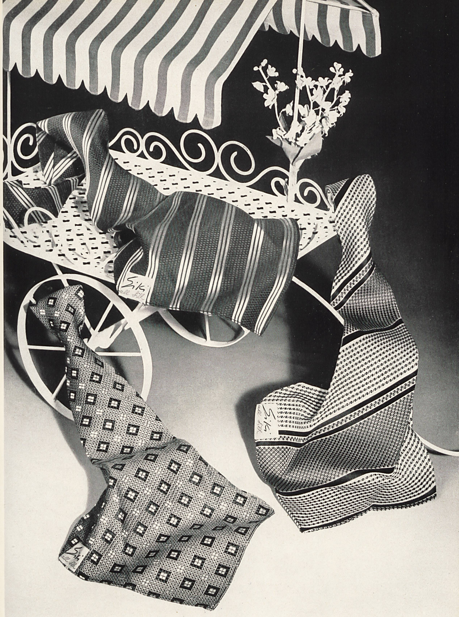
S. KIRSCHNER, ZURICH Fabrique de cravates