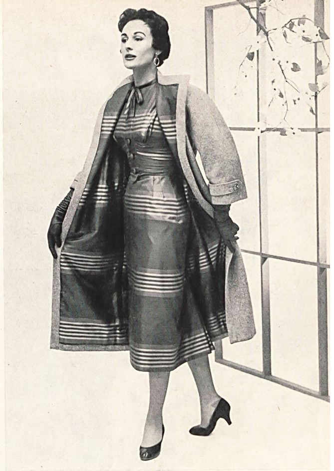
Surah barré pure soie. Modèle Patric of Miss America, New-York.