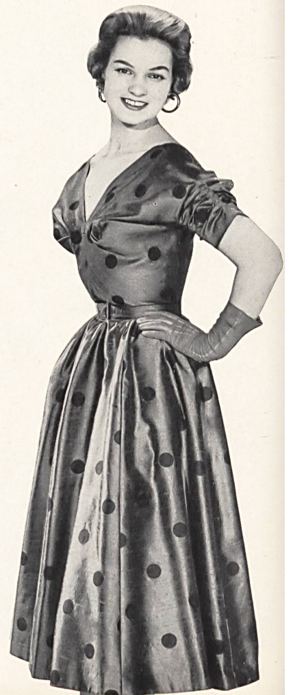
Shantung noppé imprimé. Modèle H. Haller & Cie, Zurich.