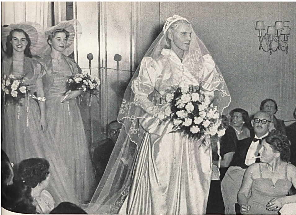
Satin Crystal. Textiel Import « Welia », Amsterdam.