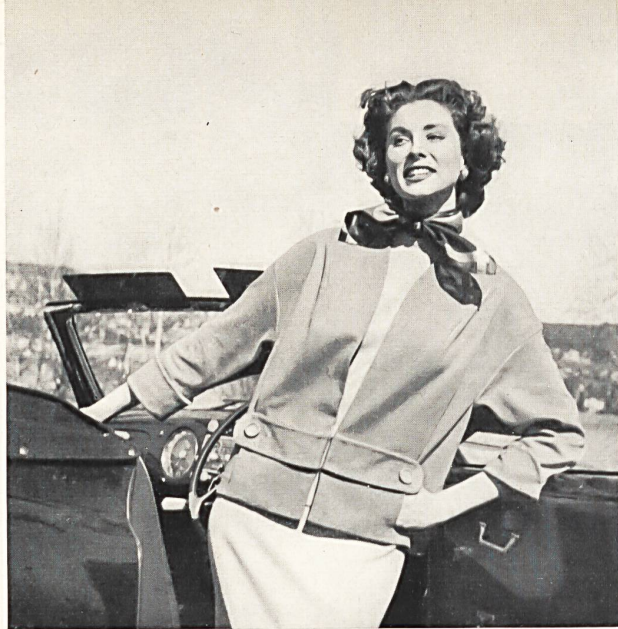
Einige der Modelle, die in Kopenhagen gezeigt wurden.