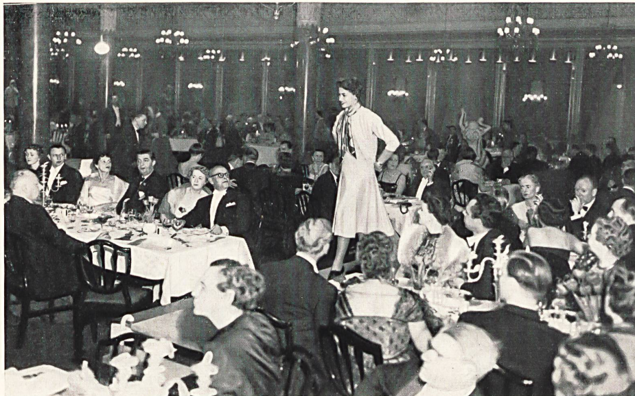
Die Vorführung während des Gala-Diners im « Wivex ».