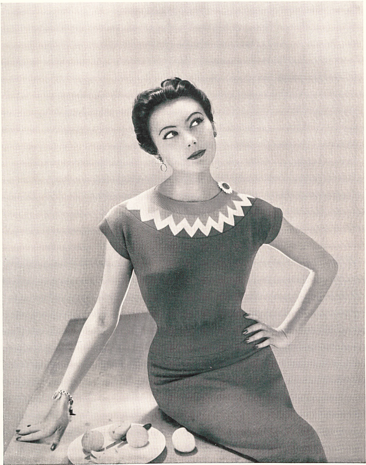
« ALPINIT » Ruepp & Cie S.A., Sarmenstorf Tricots et jerseys.