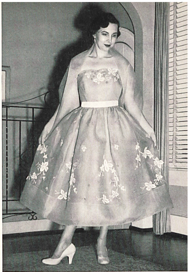
Mrs. X. wearing an embroidered organdy dress by Caro-Lena Shoppe, Birmingham (Alabama) Fabric by A. Naef & Co., Flawil Representatives: M. E. Feld & Co., New York

In Amerika sind die St. Galler Stickereien in den geläufigsten Qualitäten jederzeit nachgeahmt und kopiert worden, und zwar für eine derart gewaltige Produktion, dass ihr die Schweiz nie hätte Genüge leisten können. In der Tat bewegt sich die jährliche Produktion der amerikanischen Stickereien um 50 Millionen Dollar, während die durchschnittliche Jahreseinfuhr von Stickereien aus der Schweiz die Summe von 900 000 Dollar nicht übersteigt. Aus diesem Grunde ist die Schweiz im Bereich der Stickereierzeugnisse keine Konkurrentin für die Vereinigten Staaten. Doch ist ihre Produktion vollkommen verschiedenartig: sie baut sich auf der Qualität, auf der Exklusivität auf. Die Ideen und Entwürfe der Schwei-