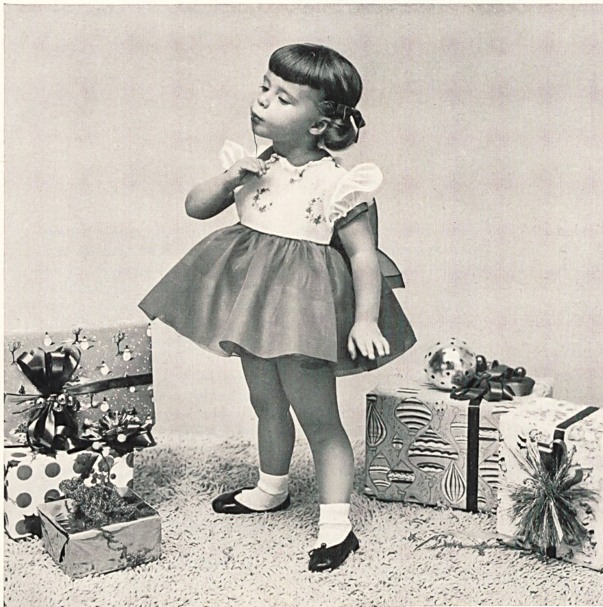
Youngland, New York Embroidered organdy by A. Naef & Co., Flawil Representatives: M. E. Feld & Co., New York