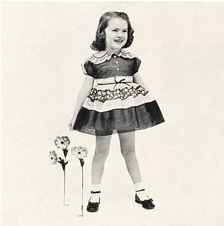
Celeste, New York Embroidered organdy by A. Naef & Co., Flawil Representatives: M. E. Feld & Co. New York

Wenn die Hersteller von Kinder- und Mädchenkleidern solch schöne Stickereien auswählen, so bedeutet das, dass diese Firmen nicht zurückschrecken vor dem ver-