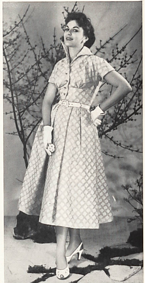
Schweizerische Modellkonfektion wie sie in Deutschland vertrieben wird. Couture en gros suisse distribuée en Allemagne.