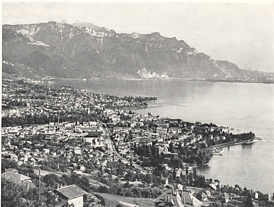
Generalansicht der Stadt Vevey, wo im nächsten August das Winzerfest stattfinden wird.

Das letzte Winzerfest wurde 1927 abgehalten; das bevorstehende wird im nächsten August stattfinden. Rund dreitausend Mitwirkende, davon 950 Kinder, die Schauspieler und Tänzer, Sänger